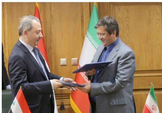
פגישת נגידי הבנקים המרכזיים של איראן וסוריה (אירן"א, 2 בספטמבר 2019).

◀ ב-29 באוגוסט חשף צה"ל מידע חדש אודות פרויקט דיוק הטילים של חזבאללה המתנהל בהובלת איראן. על-פי המידע שנחשף, בעקבות סיכול רוב משלוחי הטילים המדויקים, שניסתה איראן להעביר לסוריה בין 2013 ל-2016, פעלה איראן לדיוק הטילים המיוצרים בסוריה. לאחר שגם פרויקט זה סוכל בהתקפות אוויריות ישראליות, הוחלט להעבירו ללבנון באמצעות הקמת מפעלים ממוגנים לדיוק טילים ברחבי המדינה. איראן השתמשה בשלושה נתיבים להעברת חומרי הגלם הדרושים לייצור הטילים: נתיב יבשתי דרך גבול סוריה, ציר ימי וציר אווירי דרך שדה התעופה הבינלאומי בבירות. צה"ל חשף שלושה קצינים במשמרות המהפכה הנוטלים חלק בהובלת הפרויקט: מחמד חסין-זאדה חג'אזי (Mohammad Hosseinzadeh Hejazi), מפקד כוח קדס בלבנון; עלי אצער נורוזי (Ali Asghar Nowroozi), ראש אגף הלוגיסטיקה במשמרות המהפכה האחראי על העברת הציוד והרכיבים הלוגיסטיים מאיראן לסוריה ומשם לאתרי פרויקט הדיוק בלבנון; ומג'יד נואב (Majid Navab), מהנדס מומחה בתחום טילי קרקע-קרקע המופקד על ההיבטים הטכנולוגיים בפרויקט ופועל תחת הנחיית כוח קדס.