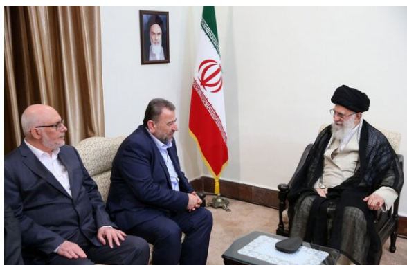
פגישת משלחת חמאס עם מנהיג איראן ביולי 2019 (תסנים, 22 ביולי 2019).

◀ במכתב למנהיג איראן, עלי ח'אמנהאי, הבטיח ראש הלשכה המדינית של חמאס, אסמאעיל הניה, כי ארגונו ימשיך במאבק נגד ישראל לצד יתר כוחות "ההתנגדות", ובראשם איראן, עד לניצחון הסופי. הניה הודה לח'אמנהאי על קבלת הפנים לה זכתה משלחת בכירי חמאס, שביקרה בטהראן בסוף חודש יולי, ועל דבריו במהלך הפגישה שקיים עימה בנוגע לתמיכה ב"התנגדות" הפלסטינית ולנכונותו לסייע לה ככל הנדרש. הוא הוסיף, כי דבריו פתחו "אופקים רחבים" וישפיעו משמעותית על ההיבטים האסטרטגיים ועל שדה הקרב של המאבק נגד "האויב הציוני" (אירנ"א, 1 בספטמבר 2019).