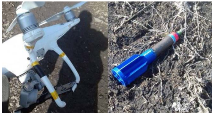
طوافة ملغمة لتنظيم الدولة الإسلامية أسقطها الحشد الشعبي إلى الجنوب الشرقي من بعقوبة (al-hashed.net، 11 أيلول/ سبتمبر 2019).