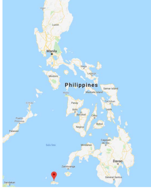
جزيرة سولو جولو في جنوب الفلبين.