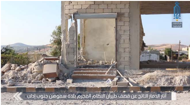
آثار الدمار الناتج عن قصف طيران النظام المحرم بلدة سموهان جنوب إدلب

◀ في 12 أيلول/ سبتمبر 2019 ضرب سلاح الجو السوري مواقع للتنظيمات الجهادية في محيط جسر الشغور. حيث كان ذلك أو قصف جوي منذ أعلن الجيش السوري عن وقف إطلاق النار. كما أعلنت هيئة تحرير الشام بأن الطائرات السورية قد قامت بتوجيه عدد من الضربات في محيط بلدة سفوهان، على مسافة ما يقارب أربعين كيلومتراً إلى الجنوب من إدلب. وفي الشريط المصور الذي نشره التنظيم تظهر بعض المباني التي أصابها القصف الجوي (إباء، 12 أيلول/ سبتمبر 2019). وأفادت التقارير الإعلامية عن مشاركة طائرات روسية في القصف.