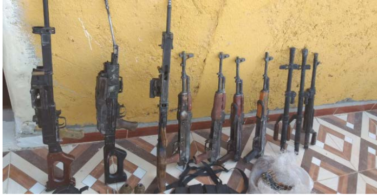
الأسلحة التي تم ضبطها بحوزة أربعة عناصر من تنظيم الدولة الإسلامية إلى الجنوب الشرقي من الميادين (SDF Press، 14 أيلول/ سبتمبر 2019).

◀ في سياق عمليات ملاحقة خلايا تنظيم الدولة الإسلامية قبضت قوات سوريا الديمقراطية (SDF) على أربعة عناصر من تنظيم الدولة الإسلامية على مبعده ما يقارب ثلاثين كيلومتراً إلى الجنوب الشرقي من الميادين، حيث ضُبطت بحوزتهم أسلحة (SDF Press، 14 أيلول/ سبتمبر 2019).