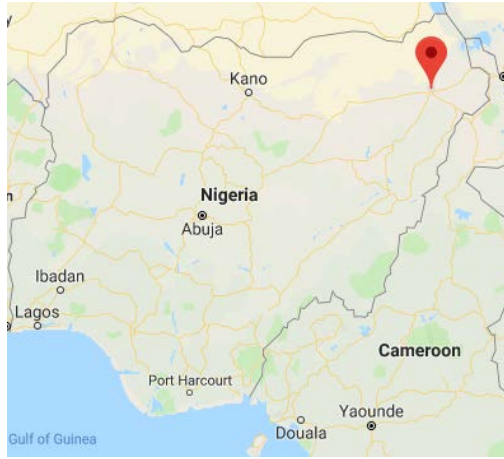
مدينة مايدوجوري في شمال شرق نيجيريا.

◀ أعلنت ولاية غرب أفريقيا في تنظيم الدولة الإسلامية أن عناصر التنظيم نصبوا كميناً لقوات جيش نيجيريا ما بين بلدة جوبيو (Gubio) ومدينة مايدوجوري (Maiduguri)، في منطقة ولاية بورنو (شمال شرق نيجيريا). اندلع اشتباك بين القوات وأسفر عن مقتل خمسة جنود من جيش نيجيريا. وفي وقت لاحق هجم عناصر تنظيم الدولة الإسلامية على معسكر لجيش نيجيريا في المنطقة، ما أسفر عن مقتل جنديين نيجيريين وإصابة عدد آخر من الجنود (تلغرام، 15 أيلول/ سبتمبر 2019).