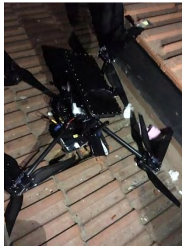
שרידי שני הרחפנים (אתר Lebanon24, 25 באוגוסט 2019).

◀ מקורות בחזבאללה טענו, כי המדובר בתקיפה של שני רחפנים נגד מבנה יחידת קשרי ההסברה של חזבאללה בפרבר הדרומי של ביירות (לפי גרסא אחרת הותקף "משרד פוליטי בפרבר בדרומי של ביירות"). חזבאללה מסר, כי הוא לא הפיל אף אחד מהרחפנים, אולם הרחפן הראשון, שנפל מבלי לגרום נזק, נמצא ברשותו. נמסר כי חזבאללה מנתח כעת את הרקע להטסתו ואת המשימות אותן הוא ניסה לבצע (ראיון עם מחמד עפיף, אחראי יחידת קשרי ההסברה, לערוץ אלעאלם האיראני, 25 באוגוסט 2019; ראיון של בכיר בחזבאללה לסוכנות רויטרס, 25 באוגוסט 2019).