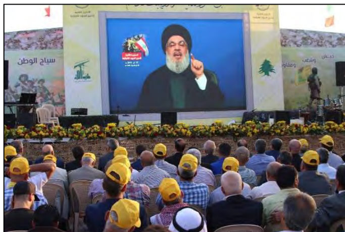
קהל צופה בנאום נצראללה המוקרן על גבי מסך (אלמנאר, 25 באוגוסט 2019).

ב-25 באוגוסט 2019 נשא חסן נצראללה, מזכ"ל חזבאללה, נאום לוחמני בו טען כי ישראל עומדת מאחורי שתי תקיפות בלבנון ובסוריה: אירוע הרחפנים בפרבר הדרומי השיעי של ביירות (שישראל לא קיבלה עליו אחריות); ותקיפת בסיס מדרום מערב לדמשק , (שישראל קיבלה אחריות עליה), אשר שיבשה תכנית של כוח קדס האיראני לשגר רחפנים חמושים נגד מטרות בצפון ישראל. נצראללה תיאר (בהגזמה רבה) את הסיכון הנשקף ללבנון כתוצאה מהתקדים של הפעלת רחפן נפץ ("רחפן מתאבד"), שלטענתו נקבע בפרבר הדרומי של ביירות 1 . תקדים זה, לטענתו, עלול להוביל לעיראקיציה של לבנון (קרי, לתקיפות ישראליות נגד חזבאללה בשטחה של לבנון). נצראללה שב והדגיש, כי "אנחנו מההתנגדות האסלאמית [קרי, חזבאללה] לא נאפשר [לישראל לעלות על] מסלול כזה, יהיה המחיר אשר יהיה" .