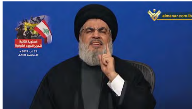
חסן נצראללה מאיים על ישראל (חשבון הטוויטר של חדשות ערוץ אלמנאר באנגלית, 25 באוגוסט 2019).

◀ מכאן עובר נצראללה לתגובה הצפויה של חזבאללה. הוא פונה לתושבי צפון ישראל ולכל תושבי "פלסטין הכבושה": "אל תחיו, אל תנחו, אל תחשו ביטחון, ואל תחשבו אפילו לרגע, שחזבאללה יאפשר מסלול כזה ותוקפנות כזאת". בהמשך הודיע נצראללה כי מעתה חזבאללה תתעמת עם הרחפנים בשמי לבנון ותפיל אותם. ברקע לדבריו ציין נצראללה, כי מאז שנת 2000 ואחר כך מאז שנת 2006 "התרגלנו לחיות עם הרחפנים בשמי לבנון". חזבאללה יכול היה להפיל את הרחפנים ולא עשה זאת כדי שאף אחד בלבנון לא יאשים את חזבאללה כי הוא רוצה לגרור אותה לעימות ולפגוע בתיירות ובכלכלה שלה. אולם מעתה, גישתו של חזבאללה תשתנה: "הרחפנים הישראליים הנכנסים ללבנון בעינינו הם כבר לא רחפנים [שנועדו] להפרת ריבונות [לבנון] או רחמנים [שנועדו] לאיסוף מודיעין. אלו הם [בעיני חזבאללה] רחפנים [תוקפים] לפיצוץ, התאבדות והרג".