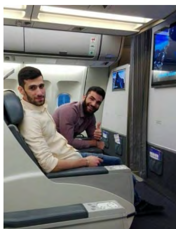
שני ההרוגים באחת מטיסותיהם לאיראן בחברת Mahan Air לצרכי הכשרה (אתר צה"ל, 26 באוגוסט 2019).

ב-24 באוגוסט 2019 תקף צה"ל מספר יעדים בעיירה עקרבה (47 ק"מ מדרום מערב לדמשק). התקיפה כוונה נגד פעילי כוח קדס האיראני ומליציות שיעיות שעסקו בקידום פיגוע נגד מטרות ישראליות משטח סוריה . בתקיפת חיל האוויר נהרגו שני פעילי מליציות שיעיות שהופעלו ע"י כוח קדס למימוש שיגור הרחפנים (דובר צה"ל, 26 באוגוסט 2019).