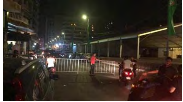
זירת האירוע בפרבר הדרומי של ביירות (אתר הכוחות הלבנוניים, 25 באוגוסט 2019).