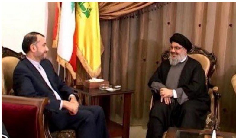
פגישת עבדאללהיאן עם חסן נצראללה (אלעאלם, 19 ביולי 2019)

◀ בתום ביקורו בסוריה המשיך עבדאללהיאן לבירות ונפגש עם בכירים בממשל הלבנוני, עם מזכ"ל חזבאללה, חסן נצראללה, ועם משלחת חמאס. בפגישה עם יו"ר הפרלמנט הלבנוני, נביה ברי, הדגיש עבדאללהיאן את תמיכת איראן בלבנון וב"התנגדות" בלבנון [קרי לחזבאללה]. הוא ציין, כי איראן ובעלות בריתה לא יאפשרו לעולם ל"משטר הציוני" ולארה"ב לפגוע בביטחון האזור (פארס, 17 ביולי 2019). בפגישתו עם עבדאללהיאן אמר חסן נצראללה, כי ארה"ב אינה מסוגלת לכפות מלחמה נגד איראן וכי במקרה של מלחמה, האזור כולו יהיה מעורב בה. הוא ציין, כי ה"התנגדות" היא הדרך היחידה והחזקה ביותר למאבק נגד פשעי הציונים ותוקפנותם וכי הציונים מבינים רק את שפת ההתנגדות (פארס, 19 ביולי 2019).