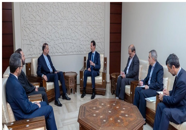
פגישת עבדאללהיאן עם הנשיא אסד (תסנים, 15 ביולי 2019)

◀ בתום ביקורו בסוריה המשיך עבדאללהיאן לבירות ונפגש עם בכירים בממשל הלבנוני, עם מזכ"ל חזבאללה, חסן נצראללה, ועם משלחת חמאס. בפגישה עם יו"ר הפרלמנט הלבנוני, נביה ברי, הדגיש עבדאללהיאן את תמיכת איראן בלבנון וב"התנגדות" בלבנון [קרי לחזבאללה]. הוא ציין, כי איראן ובעלות בריתה לא יאפשרו לעולם ל"משטר הציוני" ולארה"ב לפגוע בביטחון האזור (פארס, 17 ביולי 2019). בפגישתו עם עבדאללהיאן אמר חסן נצראללה, כי ארה"ב אינה מסוגלת לכפות מלחמה נגד איראן וכי במקרה של מלחמה, האזור כולו יהיה מעורב בה. הוא ציין, כי ה"התנגדות" היא הדרך היחידה והחזקה ביותר למאבק נגד פשעי הציונים ותוקפנותם וכי הציונים מבינים רק את שפת ההתנגדות (פארס, 19 ביולי 2019).