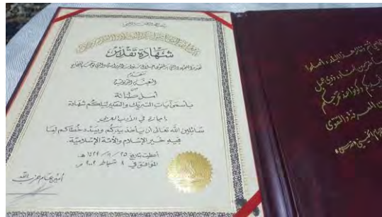
תעודת הוקרה מטעם "גיוס החינוך" על סיום תואר ראשון בספרות ערבית בחתימת נצראללה בתעודה לא נכתבת מטעם איזה מוסד לימודים ניתן התואר

הפעילות הנמרצת בקרב הסטודנטים השיעים באוניברסיטה הלבנונית, בהכוונת "גיוס החינוך", נשאה פרי עבור חזבאללה. בעבודת מרכז המידע שבחנה את הפרופיל של הרוגי חזבאללה במלחמת האזרחים הסורית, עלה, כי לפחות 15 מפעילי הארגון, שנהרגו במהלך המלחמה בסוריה, למדו באוניברסיטה הלבנונית, הרבה יותר מאשר פעילים, שלמדו במוסדות אקדמיים אחרים. 13