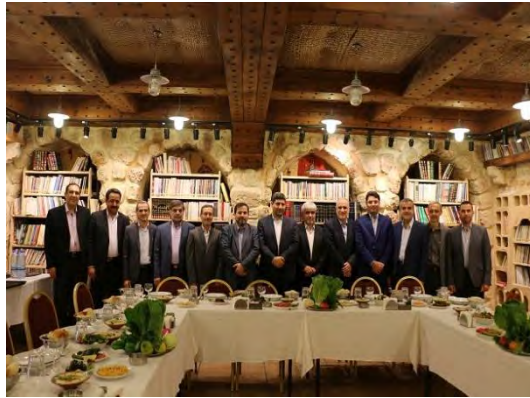
מפגש משלחת בכירים ממערכת החינוך האיראנית עם פעילי "גיוס החינוך".