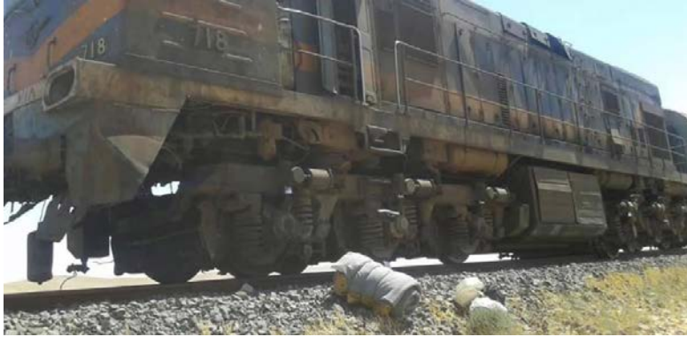
قاطرة قطار الشحن الذي أصابته العبوة الناسفة (التي زرعتها تنظيم الدولة الإسلامية) (وزارة المواصلات السورية، 21 تموز/ يوليو 2019).

تنظيم الدولة الإسلامية بياناً تبنى فيه المسؤولية عن تفجير العبوة الناسفة التي استهدفت القطار، وجاء في البيان أن القطار انحرّف عن السكة الحديدية وأصيب اشخاص ممن كانوا على متنه (تلغرام، 22 تموز/ يوليو 2019).