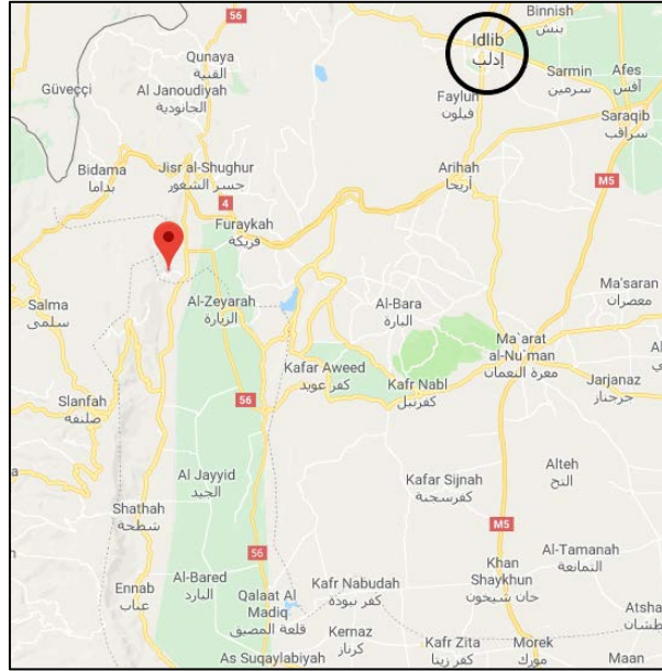
بلدة السرسمانية التي فشلت محاولة الجيش السوري لاحتلالها.