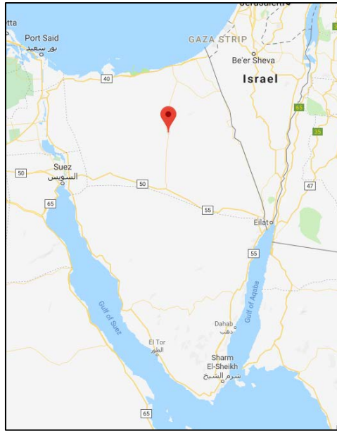
الحسنة وسط سيناء (Google Maps).

◆ كمين لأفراد إحدى الميليشيات وسط سيناء: أعلنت وسائل الإعلام التابعة لتنظيم الدولة الإسلامية بأن عناصر التنظيم قد نصبوا كميناً لمقاتلين من ميليشيا مساندة للجيش المصري على شارع الحسنة وسط سيناء، ما أسفر عن مقتل ثلاثة عناصر من الميليشيا (تلغرام، 18 تموز/ يوليو 2019).