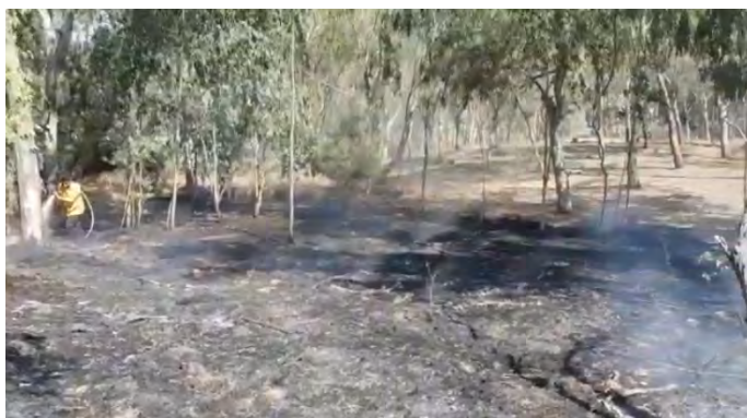
כיבוי שריפה ביער בארי (יוטיוב, 28 במאי 2019)

◀ 28 במאי 2019: בלון תבערה ששוגר מעזה גרם לשריפה ביער בארי . בנוסף, שיגרו מחבלים בלוני תבערה שעברו מעל יישובי עוטף עזה . לא ידוע מקום נחיתתם (תקשורת ישראלית, 28 במאי 2019).