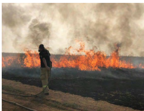
כיבוי שריפות בעוטף עזה בעקבות שיגור בלוני תבערה מהרצועה (חשבון הטוויטר PALINFO, 23 במאי 2019)