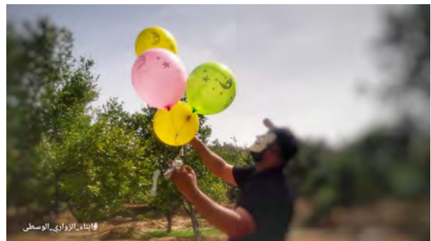
פעילי יחידת "בני אלזוארי" במרכז הרצועה משגרים בלוני תבערה ונפץ לעבר ישראל (חשבון הטוויטר PALINFO, 23 במאי 2019).