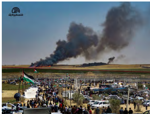
שריפות ביישובי עוטף עזה, כתוצאה מבלוני תבערה, כפי שהן נראות ממזרח העיר עזה