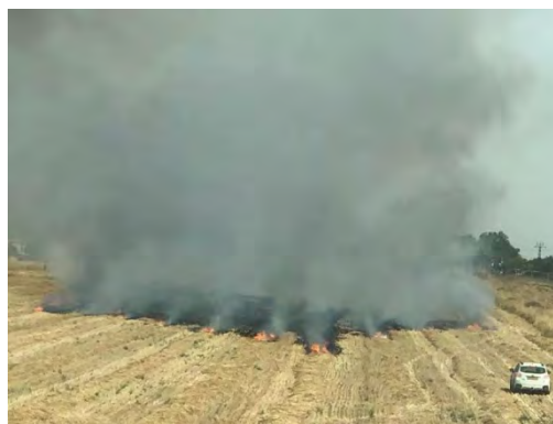
מימין : שריפה באזור שער הנגב בעקבות שיגור בלון תבערה מהרצועה (חשבון הטוויטר PALINFO, 24 במאי 2019). משמאל : שריפה בקרבת אחד מיישובי עוטף עזה (דף הפייסבוק של יחידת "בני אלזארי במזרח ח'אן יונס", 23 במאי 2019)