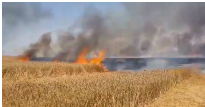
השריפה סמוך לקיבוץ נחל עוז (צילום איציק לוגסי יערן קק"ל, 29 במאי 2019).

◀ 28 במאי 2019: בלון תבערה ששוגר מעזה גרם לשריפה ביער בארי . בנוסף, שיגרו מחבלים בלוני תבערה שעברו מעל יישובי עוטף עזה . לא ידוע מקום נחיתתם (תקשורת ישראלית, 28 במאי 2019).