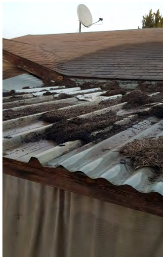
נזק בגג פרגולה של בית מגורים בנתיבות (אתר 29,0404 29 במאי 2019).

29 במאי 2019: בלון תבערה שהופרח ע"י מחבלים מרצועת עזה הצית שריפה בגג פרגולה של בית מגורים בנתיבות . צוות כיבוי אש שפעל במקום הצליח להשתלט על השריפה (כיבוי והצלה מחוז דרום, 29 במאי 2019).