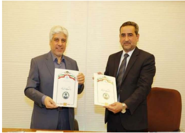
נגידי אוניברסיטאות אצפהאן ונג'ף חותמים על מזכר הבנה (מהר, 27 באפריל 2019).

◀ במסגרת הרחבת שיתוף הפעולה האקדמי בין איראן לעיראק נחתם בפברואר 2019 הסכם לשיתוף פעולה מדעי גם בין אוניברסיטת אזאד, רשת האוניברסיטאות והמכללות הפרטית האיראנית, למשרד ההשכלה הגבוהה והמחקר המדעי העיראקי. ההסכם, שנחתם במהלך ביקור נשיא האוניברסיטה בבגדאד, נועד לאפשר את הרחבת שיתוף הפעולה המדעי, המחקרי והאקדמי בין שתי המדינות, ובכלל זה עריכת מחקרים וכנסים משותפים.