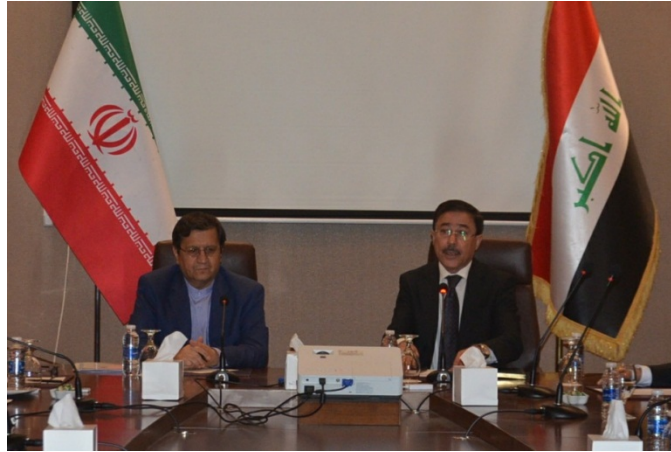
נגיד הבנק המרכזי האיראני (משמאל) בבגדאד (אירן"א, 23 באפריל).

◀ נגיד הבנק המרכזי האיראני, עבד אל-נאצר המתי (Abdol-Nasser Hemmati), הגיע ב-21 באפריל לביקור בבגדאד לפגישות עם בכירים עיראקים, ובראשם ראש הממשלה, שר האוצר ונגיד הבנק המרכזי. הביקור נועד להשלים את ההסכמים להרחבת שיתוף הפעולה הבנקאי והמוניטרי בין שתי המדינות, שגובשו במהלך ביקור הנשיא רוחאני בעיראק (מרץ 2019) וביקור ראש ממשלת עיראק, עאדל עבד אל-מהדי, באיראן (אפריל 2019). זהו ביקורו השני של המתי בעיראק בחודשיים האחרונים (אירן"א, 23 באפריל).