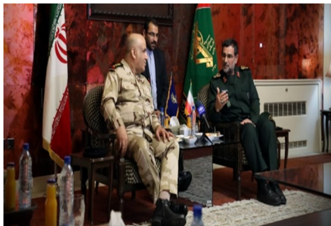
פגישת מפקד צי משמרות המהפכה ומפקד חיל הים העיראקי (פארס, 1 במאי 2019).

◀ מפקד צי משמרות המהפכה נפגש ב-30 באפריל 2019 בטהראן עם מפקד חיל הים העיראקי ודן עימו בשיתוף הפעולה הימי בין שתי המדינות, ובכלל זה באפשרות לערוך תמרון ימי משותף לשני חילות הים. מפקד הצי של משמרות המהפכה, עלי-רזא תנגסירי (Alireza Tangsiri), ומפקד חיל הים העיראקי, אחמד ג'אסם אלמעארג' (Ahmad Jasim Maarij), דנו בדרכים להרחיב את שיתוף הפעולה הימי בין שתי המדינות, כגון: הקמת ועדה משותפת לשיתוף פעולה ימי, הגברת התאום בין חילות הים, שיתוף פעולה טכני והנדסי ימי וביצוע הדרכות משותפות. תנסגירי אמר במהלך הפגישה, כי האויבים חותרים לפלג בין המוסלמים, משום שאחדותם עלולה לערער את נוכחות הזרים באזור. אלמעארג' אמר, כי איראן מילאה תפקיד חשוב בסיוע לכוחות העיראקים ולמיליציות העיראקיות במערכה נגד דאעש, והביע תקווה להרחבת הקשרים בין שתי המדינות בעתיד (פארס, 1 במאי 2019).