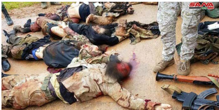
Трупы "боевиков террора", убитых в ходе совершения нападения на позиции сил сирийской армии к северу от г. Хама (агентство новостей САНА, 3 марта 2019 г.)

► В органах СМИ, принадлежащих сирийскому режиму, сообщалось, что в ночь со 2-го на 3-е марта 2019 г. несколько групп боевиков из группировки "Штаб по освобождению Аль Шаам" совершили нападение на позиции сил сирийской армии , расположенные приблизительно в 16 км к северу от г. Хама. Представители сирийской армии сообщили, что это нападение было отбито, и при этом были убиты 22 боевика группировки "Штаб по освобождению Аль Шаам", прибывших из южной части анклава, существующего в районе г. Идлиб. Как следует из версии группировки "Штаб по освобождению Аль Шаам", ее боевики совершили "акцию высокого качества", проникнув ночью, под прикрытием артиллерийского огня, на позиции сил сирийской армии. По утверждению группировки, в результате этого нападения были убиты и ранены десятки солдат сирийской армии (социальная сеть "Телеграм", 4 марта 2019 г.). 3-го марта 2019 г. самолеты сирийских ВВС нанесли удары по скоплениям боевиков повстанческих организаций в южной части анклава (сайт "батулат аль джиш аль сури", 3 марта 2019 г.; агентство новостей САНА, 3 марта 2019 г.).