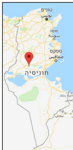
Гора Арбата, расположенная в центральной части Туниса

солдат туниской армии был убит (Shems FM, тунисская радиостанция и сайт новостей, 1 марта 2019 г.).