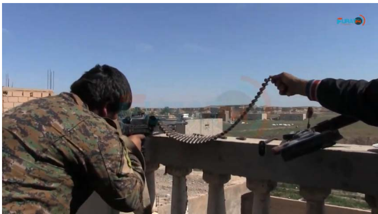
Боец группировки SDF в ходе ведения боевых действий в селе Аль Багуз Аль Фукани (сайт www.furatfm.com , 5 марта 2019 г.)

► 3-го марта 2019 г. было объявлено прекращение огня протяженностью в несколько часов , в ходе которого из села Аль Багуз Аль Фукани было эвакуировано около 3000 человек, подавляющее большинство из которых - мирные жители . Около 300 боевиков организации ИГИЛ, находившихся в составе этой группы эвакуированных, сдались в плен бойцам группировки SDF. Сообщается, что в настоящее время на "плацдарме" в селе Аль Багуз Аль Фукани осталось приблизительно 1000 боевиков организации ИГИЛ . Кроме того, на территории села все еще имеются заблокированные мирные жители (агентство новостей Ройтерс, страница Фейсбук "Прат пост", аккаунт Твиттер Мустафы Бали, руководителя центра по связям с прессой в группировке SDF, 4 марта 2019 г.). Было получено сообщение о том, что в результате проведения "операции высокого качества" силы группировки SDF освободили 5 из своих бойцов, попавших в плен к боевикам организации ИГИЛ (агентство новостей SANNA, 5 марта 2019 г.).