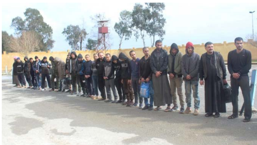
24 человека, подозреваемых в принадлежности к организации ИГИЛ, которые были освобождены силами группировки SDF (SDF Press, 4 марта 2019 г.)

► Силы группировки SDF освободили из-под стражи 24 человек из района г. Эр Ракка, которые были арестованы по подозрению в принадлежности к организации ИГИЛ, но на руках которых не было крови сирийцев. Освобожденные были переданы членам их семей (SDF Press, 4 марта 2019 г.).