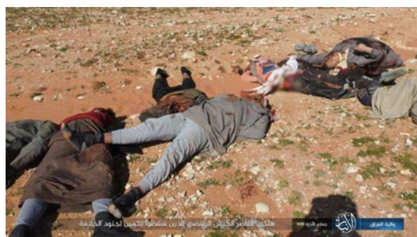
Тела боевиков сил "народного призыва", погибших в результате нападения боевиков организации ИГИЛ на пограничный пункт Арар, на границе между Ираком и Саудовской Аравией, а также личные документы, захваченные боевиками организации ИГИЛ (сайт "Шубакат Шамуах", 2 марта 2019 г.)