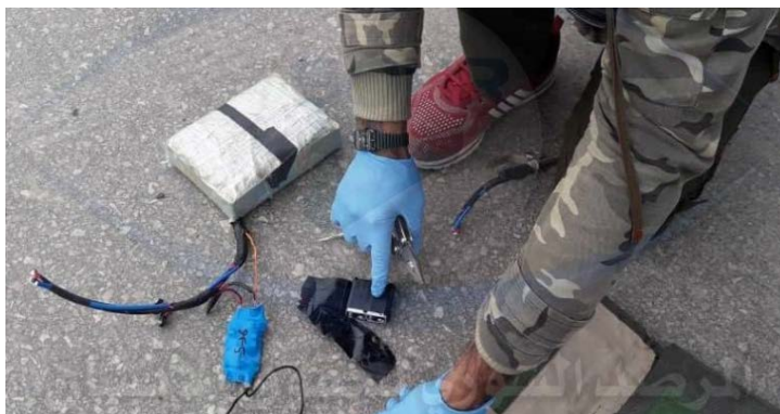
Предотвращение самоубийственного теракта в г. Эр Ракка: элементы обезвреженного пояса со взрывчаткой (сирийский наблюдательный центр по защите прав человека, 5 марта 2019 г.)

► Силы группировки SDF освободили из-под стражи 24 человек из района г. Эр Ракка, которые были арестованы по подозрению в принадлежности к организации ИГИЛ, но на руках которых не было крови сирийцев. Освобожденные были переданы членам их семей (SDF Press, 4 марта 2019 г.).