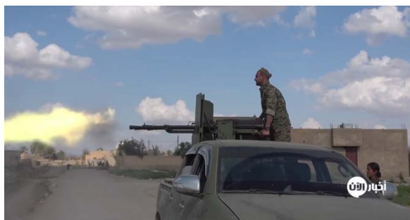
Справа: группа бойцов группировки SDF в селе Аль Багуз Аль Фукани (5 марта 2019 г.). Слева: клубы дыма поднимаются над зоной ведения боевых действий в селе Аль Багуз Аль Фукани (3 марта 2019 г.)