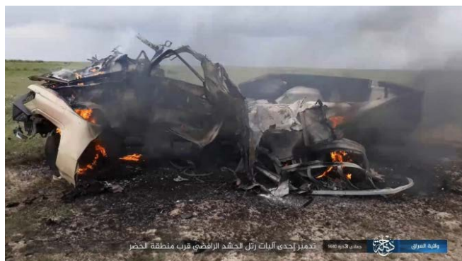
Транспортное средство сил "народного призыва", уничтоженное в результате нападения боевиков организации ИГИЛ и з засады (сайт "Шубакат Шамуах", 1 марта 2019 г.)