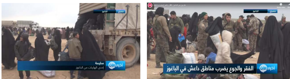
Селекция и эвакуация членов семей боевиков организации ИГИЛ в селе Аль Багуз Аль Фукани (телеканал "Аль Аан", 24 февраля 2019 г.)

Евфрат на лодках и бежать в западном направлении, направляясь в район г. Пальмира, однако, по нашим оценкам, масштабы бегства в западном направлении незначительны, так как оно связано с серьезными трудностями (представители ВВС Британии сообщили, что английский боевой самолет выпустил ракету в направлении лодки, на которой боевики организации ИГИЛ пытались переправиться через реку Евфрат).