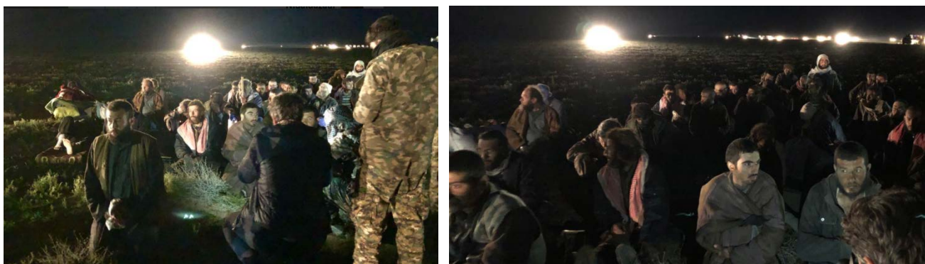
Некоторые из более 350 боевиков организации ИГИЛ, которые сдались в плен силам группировки SDF в селе Аль Багуз Аль Фукани (аккаунт Твиттер Nidalgazau@Nidalgazau, 26 февраля 2019 г.)

который был создан для них силами группировки SDF. Большинство мирных жителей бежало из села в течении последних дней 1 . Однако на территории "плацдарма" все еще остается в блокаде большое число гражданских лиц, большинство из которых является членами семей боевиков организации ИГИЛ (женщины и дети) , и по этой причине боевики снабжают их продуктами питания и питьевой водой, несмотря на их общую нехватку в результате блокады, созданной силами группировки SDF. 26-го февраля 2019 г. свыше 350 боевиков организации ИГИЛ сдались в плен бойцам группировки SDF. Этот случай массовой капитуляции не имеет прецедентов и служит свидетельством падения морального духа боевиков на остатках "плацдарма".