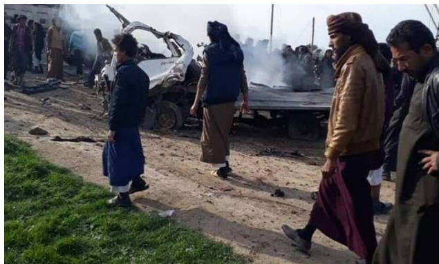
Место совершения теракта к северу от г. Аль Миадин