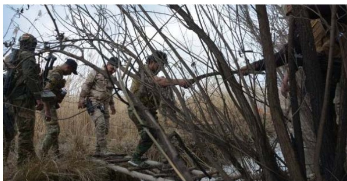
Боевики сил "народного призыва" в ходе проведения операции, в результате которой были разрушены тайные укрытия организации ИГИЛ в западной части провинции Диала (сайт al-hashed.net, 23 февраля 2019 г.)

◆ Провинция Диала: отряд боевиков сил "народного призыва" разрушил потайные укрытия организации ИГИЛ, обнаруженные приблизительно в 24 км к северо-востоку от г. Бакуба. Силы иракской армии и "народного призыва", при поддержке иракских ВВС, наносили удары по боевикам организации ИГИЛ на протяжении нескольких дней (сайт al-hashed.net, 23 февраля 2019 г.).