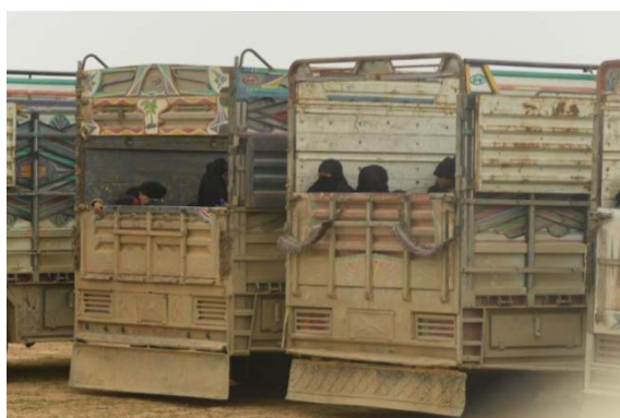
Эвакуация членов семей боевиков организации ИГИЛ, которым удалось бежать из "плацдарма" в селе Аль Багуз Аль Фукани (аккаунт Твиттер MossadNews , 20 февраля 2019 г.)