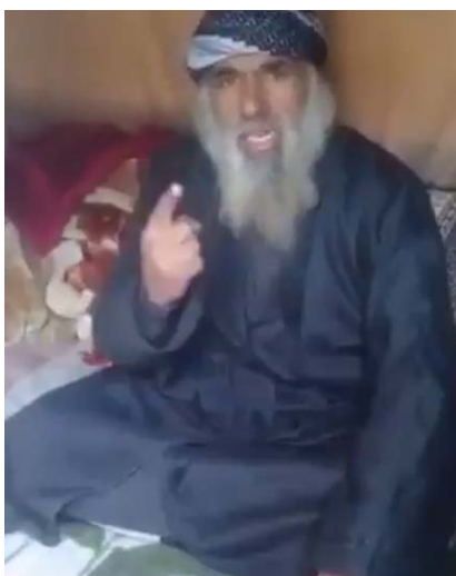
Религиозный деятель и поэт организации ИГИЛ, снятый в ролике (аккаунт Твиттер Rosanna@RosannaMrtnz, 26 февраля 2019 г.)

укрепить дух тех, кто намерен вести военные действия "до конца". В ролике снят религиозный деятель и поэт организации ИГИЛ , находящийся в селе Аль Багуз Аль Фукани и воспевающий единство и джихад. В ходе съемок ролика он отметил, что "село Аль Багуз превратилось в символ для тех, кто проявляет терпение", что представляет собой призыв, обращенный к боевикам и к их приспешникам, не сдаваться и продолжать эту долгую битву (аккаунт Твиттер Rosanna@RosannaMrtnz, 26 февраля 2019 г.).