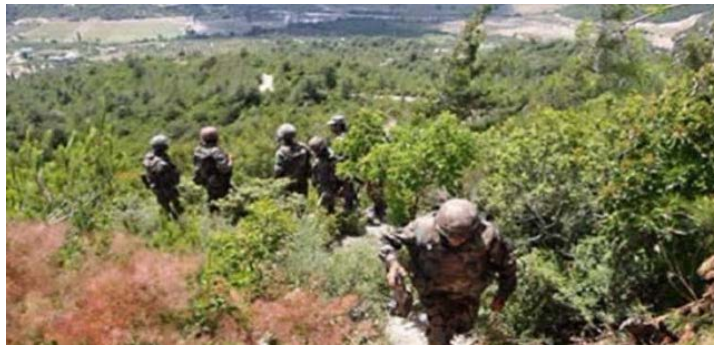
פעילות כוחות הביטחון התוניסאים נגד "פעילי טרור" באזור של חורש במחוז ג'נדובה במערב תוניסיה, בקרבת הגבול עם אלג'יריה (סוכנות הידיעות התוניסאית, 16 במרץ 2019).