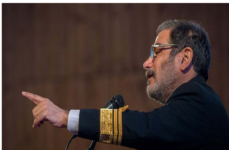
עלי שמח'אני, מזכיר המועצה העליונה לביטחון לאומי (פארס, 3 במרץ 2019)

◀ מזכיר המועצה העליונה לביטחון לאומי של איראן, עלי שמח'אני (Ali Shamkhani), הצהיר, כי מאמצי ישראל נגד נוכחות איראן בסוריה הינם חסרי תועלת. במסיבת עיתונאים בטהראן אמר שמח'אני, כי איראן אינה מייחסת כל תשומת לב לדיבוריו ולנסיעותיו של ראש הממשלה נתניהו המכוונים נגד נוכחותה בסוריה וכי זו תימשך כל עוד ממשלת סוריה מעוניינת בכך (פארס, 3 במרץ 2019).