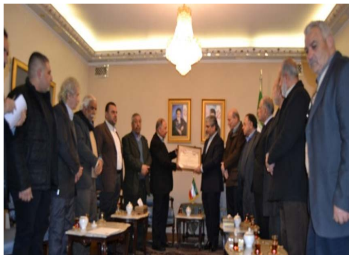
פגישת שגריר איראן בדמשק עם ראשי הפלגים הפלסטינים (פארס, 4 במרץ 2019)

בריטניה להוציא את ארגון חזבאללה אל מחוץ לחוק. שגריר איראן אמר בפגישה, כי מאבק העם הפלסטיני הוא כשלעצמו ניצחון גדול והיסטורי (פארס, 4 במרץ 2019).