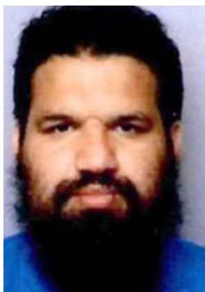
פביאן קלאן (Fabien Clain), פעיל דאעש בכיר ממוצא צרפתי, שנהרג בתקיפת הקואליציה בעיירה אלבאע'וז פוקאני (אח'באר אלא'אן, 1 במרץ 2019).

◀ פביאן קלאן, שכונה אבו אנס הצרפתי , היה קשור למתקפת הטרור המשולבת בפריס שביצע דאעש ב-13 בנובמבר 2015 בשש זירות שונות בפאריס שבה נהרגו לפחות 132 בני אדם ו-352 נפצעו. הוא גם היה זה שקיבל אחריות על המתקפה בשם דאעש (France 24, 28 בפברואר 2019; אח'באר אלא'אן, 1 במרץ 2019; וושינגטון פוסט, 5 במרץ 2019).