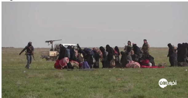
מימין: האזרחים ששחררו מ"כיס" דאעש באלבאע'וז (ערוץ אלא'אן, 5 במרץ 2019) משמאל: חלק מפעילי דאעש (ערוץ אלא'אן, 5 במרץ 2019).

◀ ב-4 במרץ התחדשו הקרבות בין SDF לדאעש. דאעש עשה שימוש רב במכוניות תופת ובמחבלים מתאבדים, כפי שהוא נוהג כאשר "גבו אל הקיר". מצטפא באלי, אחראי מרכז העיתונות של כוחות SDF, דיווח כי מספר מכוניות תופת של דאעש הושמדו בתקיפות אוויריות של מדינות הקואליציה הבינלאומית. כמו כן הושמדו שלוש מכוניות תופת על-ידי כוחות SDF. דובר הקואליציה הבינלאומית, קולונל שון, מסר ב-4 במרץ 2019 כי תקיפות אוויריות של מטוסי הקואליציה הבינלאומית פגעו בשני מחסני תחמושת של דאעש בעיירה אלבאע'וז פוקאני. דווח על שריפות גדולות כתוצאה מפיצוץ המחסנים (Military Times, 4 במרץ 2019).