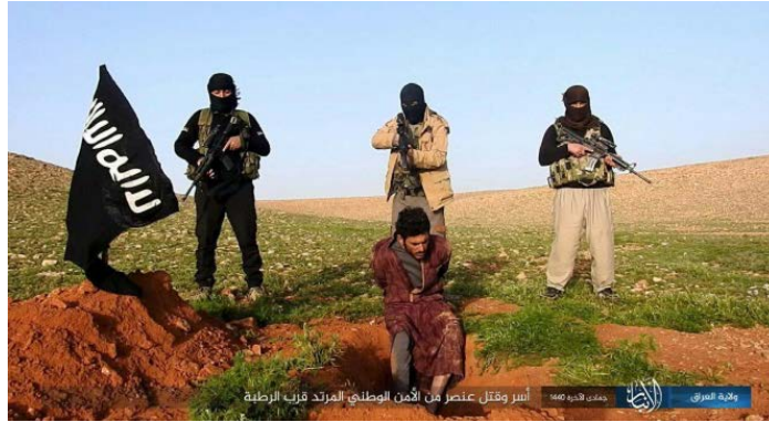
פעיל מנגנון הביטחון הלאומי העיראקי שנלקח בשבי דאעש, מוצא להורג (שבכת שמוח', 1 במרץ 2019).

◆ מחוז דג'לה (החידקל): פעילי דאעש הציבו מארב נגד כוח של "הגיוס העממי", כתשעים ק"מ דרומית-מערבית למוצול. כלי רכב אחד הושמד (שבכת שמוח', 1 במרץ 2019).