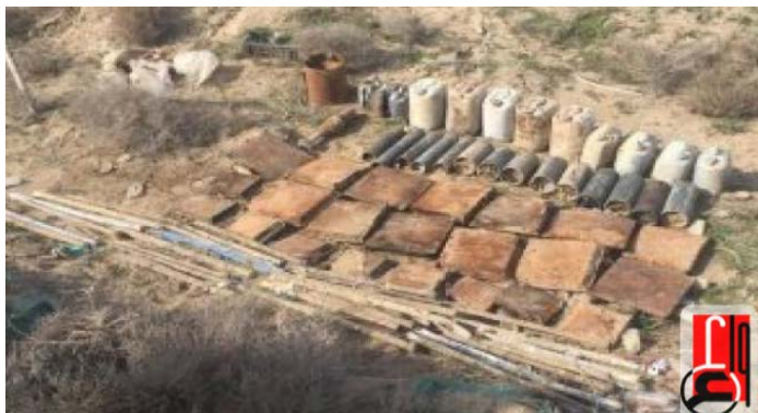
מטעני חבלה של דאעש, שאותרו על-ידי כוחות הביטחון העיראקים (סוכנות הידיעות העיראקית, 24 בפברואר 2019).

◆ מחוז אלאנבאר: כוח של המודיעין העיראקי איתר מצבור של 265 מטעני חבלה, כ-45 ק"מ ממערב לבגדאד. באזור נחשפו שלוש מנהרות, ששימשו מחבוא עבור פעילי דאעש. צוותי הנדסה קרבית פוצצו את מטעני החבלה והמנהרות (סוכנות הידיעות העיראקית, 24 בפברואר 2019).