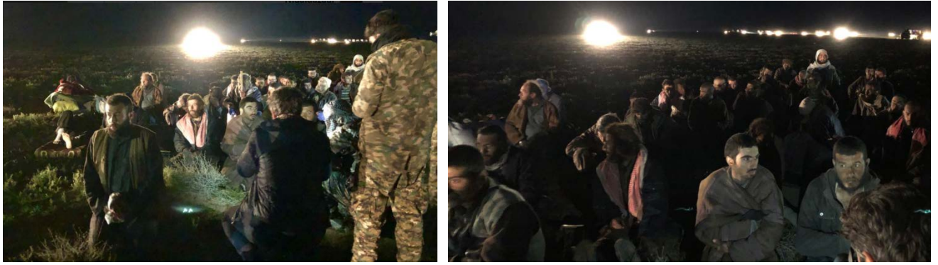
חלק מלמעלה מ-350 פעילי דאעש, שנכנעו לידי כוחות SDF באלבאע'וז פוקאני (חשבון הטוויטר @Nidalgazui, 26 בפברואר 2019).

◆ הטיפול בפעילים והאזרחים שהצליחו להיחלץ: הגברים שהצליחו להיחלץ עוברים חקירה ראשונית (בה מעורבים חיילי ארה"ב), בעיקר כדי לוודא אם הם פעילים זרים. לאחר מכן הם נשלחים לבתי כלא. הנשים נבדקות ע"י SDF ולאחר מכן מועברות למחנות עקורים שבעורף. נראה, כי מחנה העקורים המרכזי אליו מועברות הנשים הינו מחנה אלהול, שבלב שטח השליטה הכורדי (כארבעים ק"מ דרום מזרח לאלחסכה).