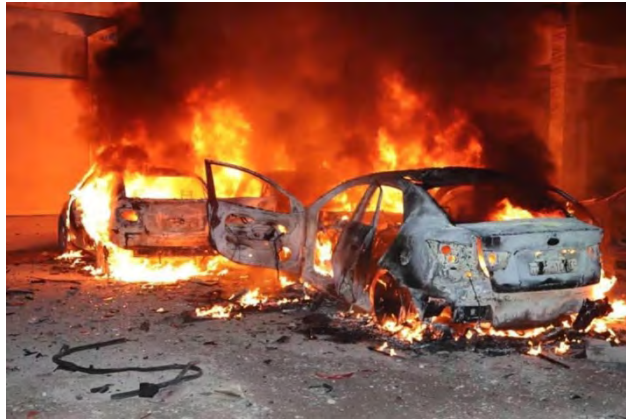
שלוש מכוניות עולות באש בזירת פיצוץ מכונית התופת בעיר אלרקה (חשבון הטוויטר @raedsyrian002, 17 בפברואר 2019).