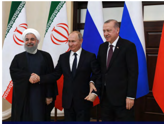
נשיאי תורכיה, רוסיה ואיראן בוועידת סוצ'י.

◀ במקביל לוועידת וורשה שהתקיימה בהובלת ארה"ב (13-14 בפברואר 2019), נערכה ועידת סוצ'י השנייה (14 בפברואר 2019) בהשתתפות נשיאי רוסיה, תורכיה ואיראן . הוועידה עסקה במגוון נושאים הקשורים לסוריה ובכלל זה סוגיית מובלעת אדלב ומנבג' , שלגביהן קיימות מחלוקות בין המשתתפים. בשלב זה לא ידוע לנו האם הושגו הסכמות בנושא אדלב ומנבג' ואם כן מה טיבן. נשיא תורכיה טאיפ ארדואן מסר לעיתונאים עם שובו מפסגת סוצ'י, כי יתכנו מבצעים משותפים (קרי, של תורכיה עם מדינות נוספות) באדלב נגד "פעילי טרור קיצוניים" (Hurriyet Daily News, 16 בפברואר 2018).