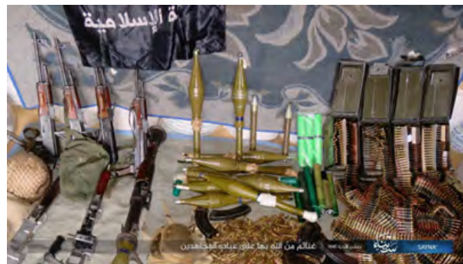
אמצעי לחימה של צבא מצרים, שנפלו בידי דאעש (שבכת שמוח', 19 בפברואר 2019).