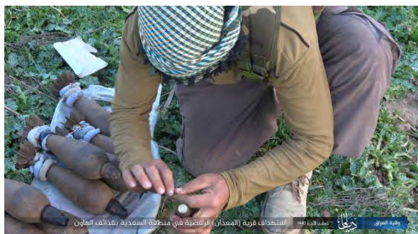
ירי פצצות המרגמה לעבר כפר שיעי, שמצפון מזרח לבעקובה (שבכת שמוח', 14 בפברואר 2019).

◆ מחוז דיאלא: רקטה שוגרה לעבר כוחות הביטחון העיראקיים באזור העיירה קרה טפה, כ-112 ק"מ מצפון מזרח לבעקובה (שבכת שמוח', 16 בפברואר 2019).