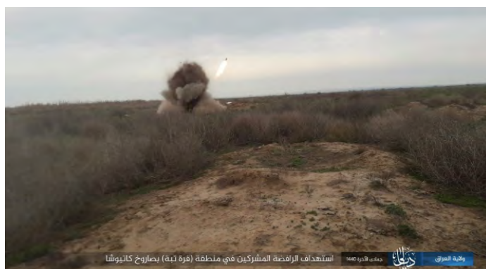
שיגור רקטה לעבר כוחות הביטחון העיראקיים מצפון מזרח לבעקובה (שבכת שמוח', 16 בפברואר 2019).

◆ מחוז דיאלא: רקטה שוגרה לעבר כוחות הביטחון העיראקיים באזור העיירה קרה טפה, כ-112 ק"מ מצפון מזרח לבעקובה (שבכת שמוח', 16 בפברואר 2019).