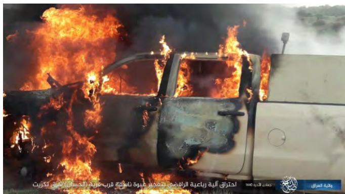
כלי רכב של כוחות הביטחון העיראקיים עולה באש לאחר שהופעל נגדו מטען חבלה (שבכת שמוח', 14 בפברואר 2019).

◆ מחוז דיאלא: פצצות מרגמה שוגרו לעבר כפר שיעי, כשבעים ק"מ מצפון מזרח לבעקובה (שבכת שמוח', 14 בפברואר 2019).