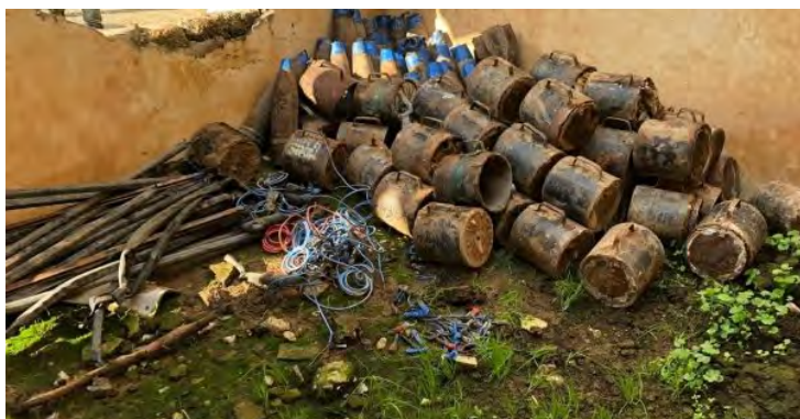
מטעני קלע (EFP), פגזים ופסי דריכה, שאותרו על-ידי כוח של "הגיוס העממי" מדרום מזרח למוצול (al-hashed.net, 17 בפברואר 2019).