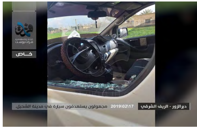
כלי הרכב שלעברו בוצע הירי באלשחיל, שמצפון לאלמיאדין (דף הפייסבוק פראת פוסט, 17 בפברואר 2019).

◆ ב-17 בפברואר ירו "אלמונים" (סביר פעילי דאעש) לעבר לוחם SDF בכפר אלחצאן, כ-5 ק"מ מצפון לدير الزور. הירי בוצע בגדה המזרחית של הפרת. הלוחם נפצע (חשבון הטוויטר דיר אלזור, 24, 17 בפברואר 2019). עד כה לא אותרה הודעת קבלת אחריות של דאעש אך סביר שפעילי הארגון הם שביצעו פיגוע זה.