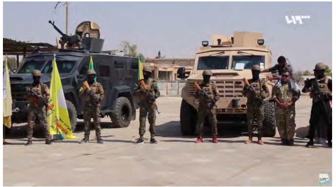
מימין: לוחמי SDF בקרבת העיירה אלבאע'וז פוקאני, המעוז האחרון של דאעש. משמאל: אלבאע'וז פוקאני (18 בפברואר 2019, SYRIA TV).