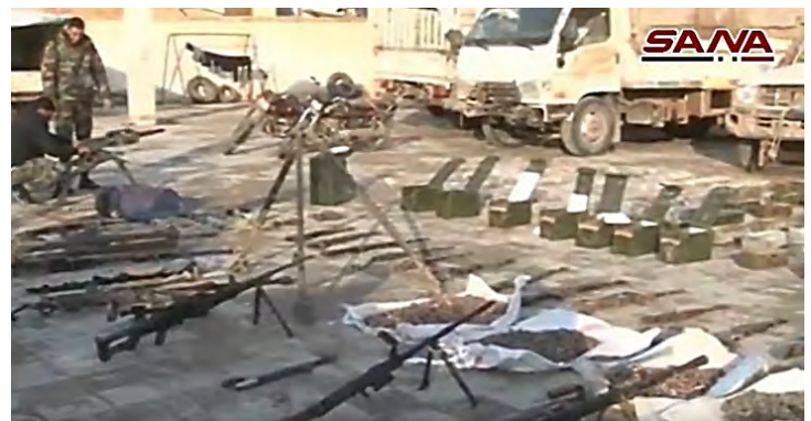
אמצעי לחימה, תחמושת וציוד צבאי של דאעש עליהם השתלט צבא סוריה (סאנא, 14 בפברואר 2019).