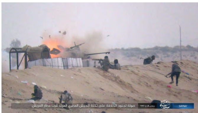
התקיפה שביצע דאעש נגד עמדת צבא מצרים (שבכת שמוח', 19 בפברואר 2019).