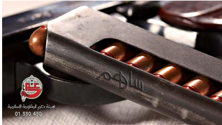
כרזה שהשיקה רשות הסיוע להתנגדות האסלאמית בפברואר 2015 עבור קמפיין גיוס התרומות. בערבית נכתב: "השתתף" (חשבון טוויטר komi_088, 16 בפברואר 2015)