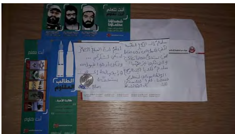
מעטפת תרומות של רשות הסיוע להתנגדות, בליווי התנצלות של התלמיד התורם על סכום התרומה הנמוך (חשבון הטוויטר סאג'ד SAJED, 10 בפברואר 2018)

◆ תשלום במזומן: לטענת מנהל מחלקת ההסברה ברשות הסיוע להתנגדות, מתנדבי רשות הסיוע חילקו לתומכי הארגון בכל רחבי לבנון מעטפות לתרומה במזומן (העיתון אלאח'באר, 10 במרץ 2018).