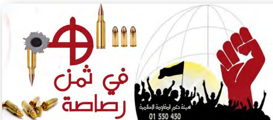
פרסום מבצע התרמה "לפי מחיר כדור רובה" (חשבון הטוויטר komi, 16 בפברואר 2015)

◆ מבצע "צייד לוחם" (אתר ג'נוביה, 8 באוגוסט 2011 ו-5 בפברואר 2017; רשת החדשות של אלנבטיה, 6 ביולי 2016). מבצע התרמה המתקיים בתחילת כל שנה, מזה מספר שנים. המבצע מיועד לאיסוף תרומות לרכישת אמצעי לחימה וציוד צבאי עבור לוחמי חזבאללה.