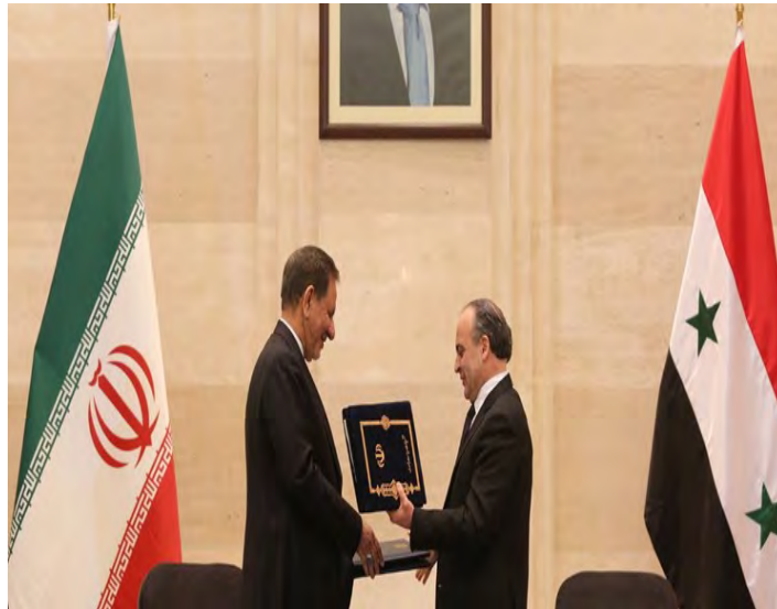
סגן נשיא איראן וראש ממשלת סוריה (מהר, 29 בינואר 2019).