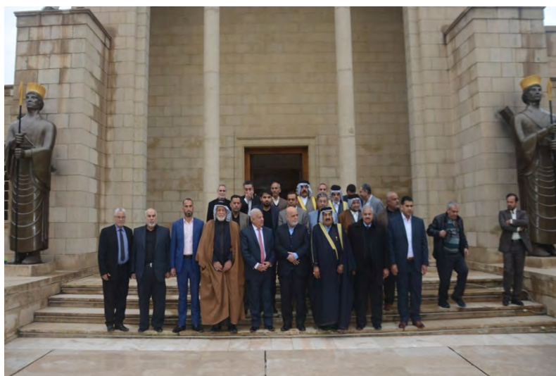
שגריר איראן בבגדאד נפגש עם משלחת אנשי ציבור עיראקים (אירנ"א, 28 בינואר 2019).

◀ אירג' מסג'די (Iraj Masjedi), שגריר איראן בעיראק, נפגש בסוף ינואר 2019 עם קבוצת מרצים, עיתונאים וראשי שבטים עיראקים. בפגישה אמר מסג'די, כי המאמצים לעורר מחלוקות ועוינות בין העם האיראני לעם העיראקי ייכשלו, משום שהיחסים בין שתי המדינות הם היסטוריים ועמוקים. מסג'די אמר, כי איראן גאה בסיוע, שהעניקה לעיראק במלחמתה נגד דאעש, וראתה בכך את חובתה. הוא התייחס לשיתוף הפעולה בין שתי המדינות בתחומי האנרגיה ואמר, כי איראן מייצאת לעיראק חשמל וגז ומסייעת לה בהקמת תחנת כוח לייצור חשמל, שהשלמתה תפתור את מצוקת החשמל בדרום עיראק. הוא הדגיש, כי איראן ניצבת לצד עיראק לא רק במלחמה אלא גם בתקופת שיקומה (אירנ"א, 28 בינואר 2019).