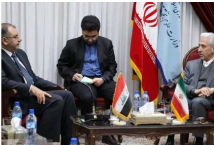
פגישת שרי המדע של איראן ועיראק (מהר, 2 בפברואר 2019).

◀ איראן ועיראק חתמו על הסכם לשיתוף פעולה מדעי וטכנולוגי. בפגישה בין שר המדע האיראני, מנצור ע'לאמי (Mansour Qolami), לשר המדע וההשכלה הגבוהה העיראקי, קצי עבד אלוהאב אלסהיל ( Qusai Abdul Wahab al-Suhail), שהתקיימה בטהראן ב-2 בפברואר 2019, הסכימו שני הצדדים להגביר את שיתוף הפעולה האקדמי והמדעי בין שתי המדינות. שר המדע האיראני אמר בפגישה, כי יותר מ-3,300 סטודנטים עיראקים לומדים כיום באוניברסיטאות איראניות, כ-700 מהם סטודנטים לתואר שלישי. הוא ציין, כי איראן מוכנה לקבל סטודנטים עיראקים נוספים ולהרחיב את חילופי הסטודנטים והמרצים בין שתי המדינות (מהר, 2 בפברואר 2019).