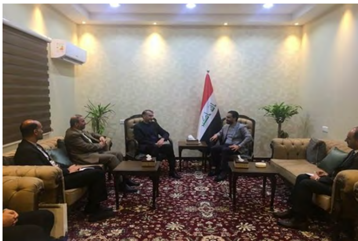
פגישת עבדאללהאן עם יו"ר הפרלמנט העיראקי (מהר, 5 בפברואר 2019).

◀ איראן ועיראק חתמו על הסכם לשיתוף פעולה מדעי וטכנולוגי. בפגישה בין שר המדע האיראני, מנצור ע'לאמי (Mansour Qolami), לשר המדע וההשכלה הגבוהה העיראקי, קצי עבד אלוהאב אלסהיל ( Qusai Abdul Wahab al-Suhail), שהתקיימה בטהראן ב-2 בפברואר 2019, הסכימו שני הצדדים להגביר את שיתוף הפעולה האקדמי והמדעי בין שתי המדינות. שר המדע האיראני אמר בפגישה, כי יותר מ-3,300 סטודנטים עיראקים לומדים כיום באוניברסיטאות איראניות, כ-700 מהם סטודנטים לתואר שלישי. הוא ציין, כי איראן מוכנה לקבל סטודנטים עיראקים נוספים ולהרחיב את חילופי הסטודנטים והמרצים בין שתי המדינות (מהר, 2 בפברואר 2019).