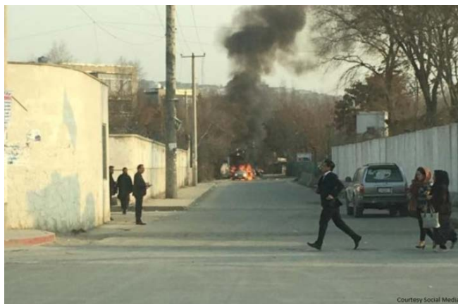
Место совершения теракта у комплекса правительственных учреждений в Кабуле (Khaama Press, 24 декабря 2018 г.)