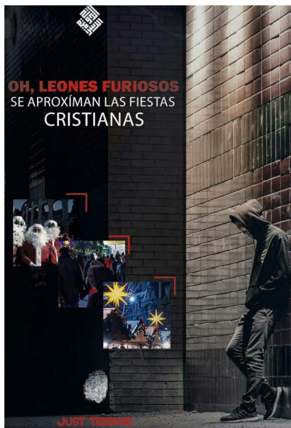
Листовка на испанском языке с призывами к совершению терактов в период рождественских праздников (социальная сеть "Телеграм", 24 декабря 2018 г.)