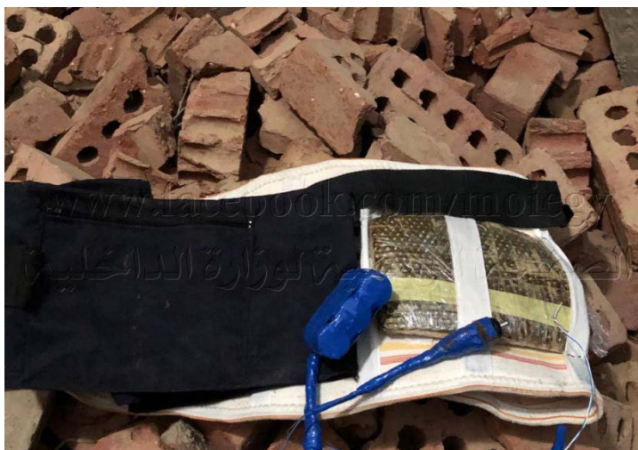
Пояс со взрывчаткой, обнаруженный на теле одного из "боевиков террора"