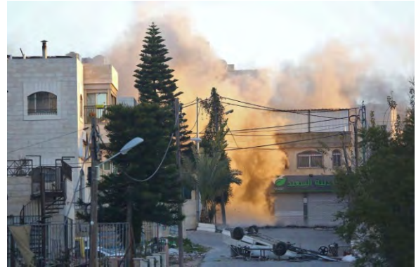
הריסת בית משפחת המחבל אסלאם אבו חמיד במחנה הפליטים אלאמערי בראמאללה (ופא, 15 בדצמבר 2018)