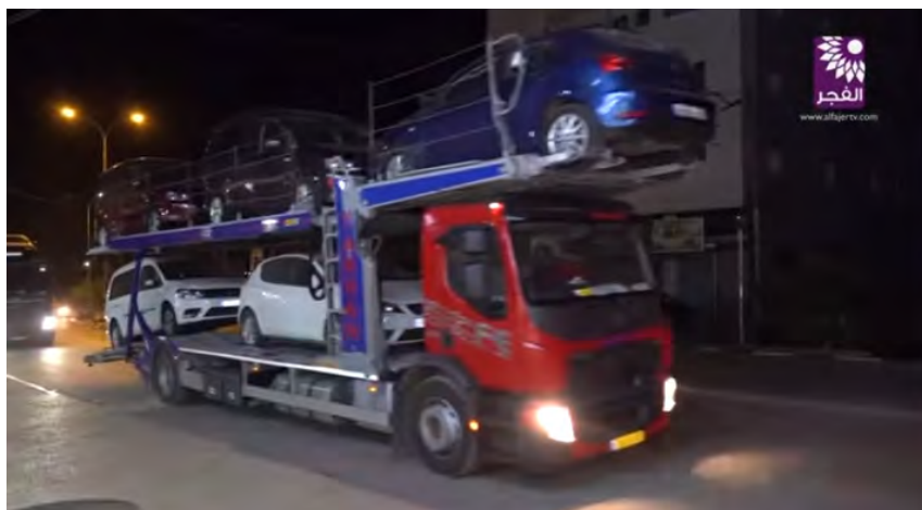
חברת אלעואד לסחר במכוניות בטול כרם מקבלת משלוח של מכוניות חדשות דרך נמל אשדוד בישראל (ערוץ הטלביזיה אלפג'ר בטול כרם, 31 באוקטובר 2018)