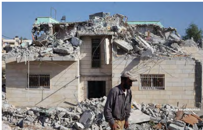
הריסת אחד מבתי משפחות המחבלים בכפר יטא, באוגוסט 2016. שני המחבלים ביצעו את הפיגוע במתחם שרונה בלב תל אביב (אלקדס, 12 בדצמבר 2018)

נהרגו ארבעה בני אדם). הבתים הללו בכפר יטא (דרומית לחברון) כבר נהרסו באוגוסט 2016 אך נבנו מחדש ללא היתר. צה"ל שוקל הריסתם מחדש (דובר צה"ל, 12 בדצמבר 2018).