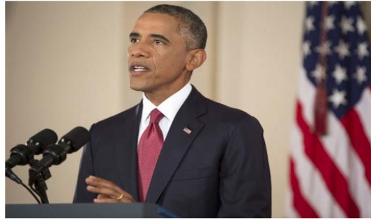
President Barack Obama delivers an address to the nation on the U.S. Counterterrorism strategy to combat ISIL, in the Cross Hall of the White House, Sept. 10, 2014.

"Our objective is clear: We will degrade, and ultimately destroy, ISIL through a comprehensive and sustained counter-terrorism strategy."