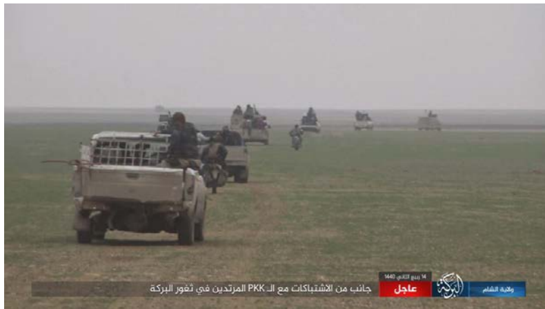
כלי רכב שטח ואופנועים של דאעש נעים בשטח פתוח במהלך ההתקפה נגד כוחות SDF (מחוז אלשאם-אלברכה של דאעש, 21 בדצמבר 2018).

◆ הגיבוי המדיני: להערכתנו יש משמעות מדינית לעצם הימצאותם של חיילים אמריקאים במרחב שבשליטת הכורדים, ובמיוחד ממערב לפרת (אזור העיר מנבג'). זאת, משום שנוכחות כוחות אמריקאים ודגל אמריקאי הרתיעו (עד כה) את תורכיה מלפעול נגד הכורדים, אפילו ממערב לפרת (אזור מנבג'). אנו סבורים, כי תחושת הבגידה והעדר הגיבוי המדיני היא התוצאה השלילית המשמעותית ביותר של הודעת הנשיא טראמפ. שכן בעקבות זאת עלולים הכוחות הכורדים להפסיק את המערכה נגד דאעש במורד עמק הפרת ולהפנות את עיקר תשומת ליבם לעבר הגבול עם תורכיה (אינדיקציות ראשוניות לכך ניתן למצוא בדברי דוברים כורדים לאחר הודעת טראמפ). ◀ בשלב זה עדיין לא ניתן להצביע על דעיכת הלחימה של SDF במובלעת דאעש. אולם, יש לזכור, שהודעת הנשיא טראמפ באה ל-SDF בעיתוי בעייתי במיוחד. לאחר למעלה משלושה חודשים לחימה נגד דאעש עלה בידי SDF, ערב הצהרת טראמפ, לזכות בהישג משמעותי בדמות כיבוש מרבית העיר הג'ין (מעוז דאעש ממזרח לנהר הפרת). כוחות SDF, שספגו פגיעה מורלית קשה, ניצבים עתה בפני התקפות נגד של דאעש שגברו לאחר הודעת טראמפ. לא ברור לנו עדיין כיצד תתפתח הלחימה אולם דומה, שתנופת ההתקפה של SDF נגד דאעש במובלעת שמצפון לאלבוכמאל צפויה לדעוך, במיוחד בתסריט שבו תופנה תשומת ליבם של הכוחות הכורדים לגבול עם תורכיה, הנתפסת כאויב העיקרי של הכורדים.