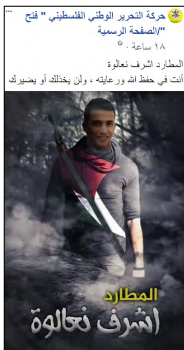
הפוסט שהועלה בדף הפייסבוק הרשמי פתח (דף הפייסבוק הרשמי של פתח, 28 בנובמבר 2018).

נרשמו תגובות רבות מרביתן כאלה המברכות את המחבל ומתפללות לשלומו (דף הפייסבוק הרשמי של פתח, 28 בנובמבר 2018).