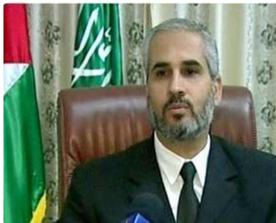
דובר חמאס, פוזי ברהום: הלובי היהודי בארה"ב עומד מאחורי הכלכלה האמריקאית (צילום: פלסטיין-אינפו, 7 באוקטובר 2008).