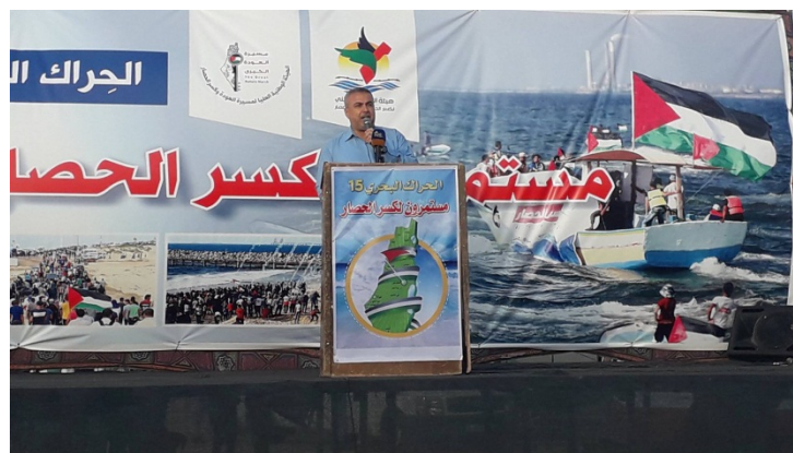
נאומו האנטישמי של אסמאעיל רצ'ואן בעת המשט השבועי ב-5 בנובמבר 2018 (דף הפייסבוק של אסמאעיל רצ'ואן, 6 בנובמבר 2018).

ב-5 בנובמבר 2018 נשא בכיר חמאס אסמאעיל רצ'ואן , נאום במהלך הפגנה שנלוותה למשט השבועי ברצועת עזה. בנאום ציין רצ'ואן, כי "צעדות השיבה" והמשטים נמשכים עד ששיגו מטרותיהם, שבמרכזן שבירתו המוחלטת של "המצור" על רצועת עזה, מימוש "זכות השיבה" והפלת "עסקת המאה" [של ארה"ב]. במהלך הנאום קרא אסמאעיל רצ'ואן לתמוך ב"התנגדות שלנו ובירושלים שלנו" ואיים על אלו שלא יתמכו: "האדמה תקיא אותם מקרבה, אללה ימאס בהם, והאש (אש הגיהנום) תיקח אותם יחד עם הקופים והחזירים (סרטון שהועלה לדף הפייסבוק של אסמאעיל רצ'ואן, 6 בנובמבר 2018). הערה: באנטישמיות הערבית- אסלאמית, "הקופים והחזירים" הינו כינוי ליהודים, אשר מוצגים כבעלי חיים "נחותים" במטרה ללבות שנאה כלפיהם. אין זאת התבטאות ראשונה מסוגה של אסמאעיל רצ'ואן. בעבר הוא נשא דרשה אנטישמית הקוראת למוסלמים להרוג יהודים ביום הדין.