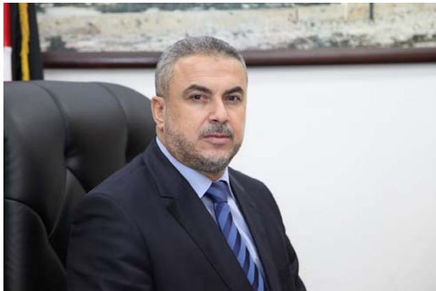
בכיר חמאס אסמאעיל רצ'ואן

✓ אסמאעיל סעיד מחמד רצ'ואן הינו בכיר בתנועת חמאס ברצועת עזה. מוצאו משכונת עבד אלרחמן במערב העיר.