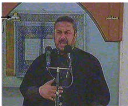
אסמאעיל רצ'ואן נושא את דרשת יום השישי: קריאה לשחרר את פלסטין ולהרוג ביהודים (30 במרץ 2007, טלוויזיה פלסטינית)

◆ בכיר חמאס אסמאעיל רצ'ואן (שנשא לאחרונה נאום אנטישמי בעת המשט), נשא ב-30 מרץ 2007 דרשה אנטישמית הקוראת ל"שחרור פלסטין", בעת שנשא את הנאום שימש רצ'ואן כדובר חמאס והדרשה שנשא הועברה בשידור ישיר בטלוויזיה הפלסטינית הממסדית . הדרשה כללה קריאה להלחם ביהודים ולהרוג בהם , תוך ציטוט דברים מתוך חדית' בשם "חזון אחרית הימים" 7 אסמאעיל רצ'ואן ציטט בדרשה שנשא, בין השאר, את הפסוק: "...יום הדין לא יגיע, אלא כאשר ילחמו המוסלמים ביהודים ויהרגו אותם . או אז יסתגר יהודי מאחורי אבן או עץ, אך האבן או העץ יאמרו: 'מוסלמי, עבד אלוהים, יהודי עומד מאחוריי, בוא והרגהו' פרט לעץ הימלוח (ע'רקד בשמו הערבי) שהוא עץ מעצי היהודים".