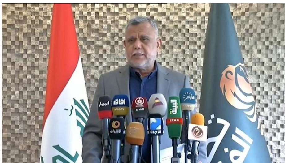
האדי אל-עאמרי (אלערביה, 9 בדצמבר 2018)

◀ האדי אלעאמרי, שעמד בראש קואליציית אלפתח של המיליציות השיעיות בבחירות הכלליות האחרונות בעיראק, אישר במסיבת עיתונאים בבגדאד, כי איראן מתערבת בענייניה הפוליטיים של עיראק כדי להבטיח את זכויותיהם של השיעים. הוא ציין, עם זאת, כי איראן נמנעה מלהתערב בבחירות האחרונות בעיראק, ובהן בניגוד לסעודיה ולארה"ב. אלעאמרי ציין, כי איראן מסייעת באופן ישיר לכמה מיליציות שיעיות בעיראק, ובהן עצאא'ב אהל אלחק בראשות קיס אלח'זעלי, תנועת אלנג'באא' (האצילים) בהנהגת אכרם אלכעבי, כתאא'ב חזבאללה, כתאא'ב סיד אלשהדאא' וסראיא ח'ראסאני, מספקת להן אמצעי לחימה ומימון ואף הקימה עבורן תחנות טלוויזיה לווייניות. הוא ציין, כי לאחרונה סירב לדרישת איראן שרשימתו תחבור לקואליציית אלנצר בהנהגת ראש הממשלה לשעבר, חידר אלעבאדי, כדי לכונן ברית שיעית (אלערביה, 9 בדצמבר 2018).