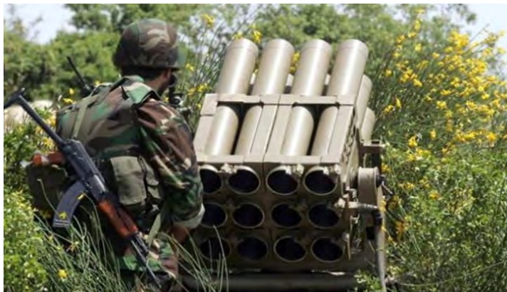
חייל צבא סוריה בסמוך למשגר רקטות במסגרת ההיערכות מול כוחות המורדים במרחב אדלב (בטולאת אלג'יש אלסורי, 8 בדצמבר 2018).

◆ באתר המזוהה עם המשטר הסורי דווח, כי צבא סוריה פגע [יתכן באמצעות ירי ארטילרי] בתגבורות שהגיעו ל" צבאות הקווקז ", כחמישים ק"מ מדרום לאדלב ("צבאות הקווקז": ארגון סלפי-ג'האדי של לוחמים שמוצאם מהקווקז הפועל בסוריה). כמה מפעילי הארגון נהרגו ונפצעו וכמה עמדות הושמדו (בטולאת אלג'יש אלסורי, 8 בדצמבר 2018).