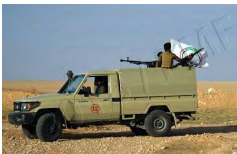
כלי רכב של "הגיוס העממי" נושא מקלע כבד במהלך פעילות ביטחונית (Al-Hashed.net, 6 בדצמבר 2018).

◆ מחוז צלאח אלדין: כוח של "הגיוס העממי" הרג ברכס הרי חמרין מחבל מתאבד של דאעש ופצע שני מחבלים נוספים, שנמלטו מהזירה. בידי השלושה נמצאו חגורות נפץ ומטעני חבלה (Al-Hashed.net, 6 בדצמבר 2018).