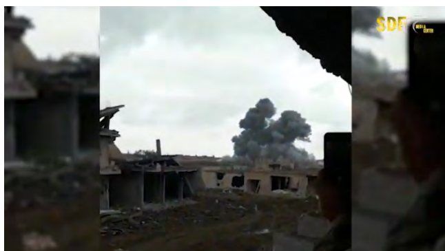
מימין: עשן מתמר ממבנה של דאעש בעיר הג'ין, שהותקף ע"י מטוסי מדינות הקואליציה (ערוץ היוטיוב SDF PRESS, 8 בדצמבר 2018). משמאל: פגיעה של מטוסי הקואליציה במבנה של דאעש בעיר הג'ין (ערוץ היוטיוב SDF PRESS, 8 בדצמבר 2018).