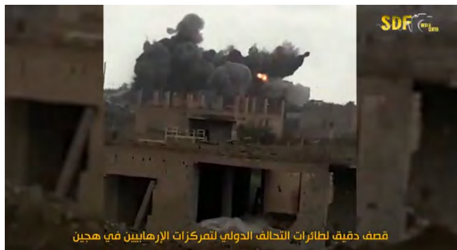
قصف دقيق لطائرات التحالف الدولي لمركزات الإرهابيين في هجين