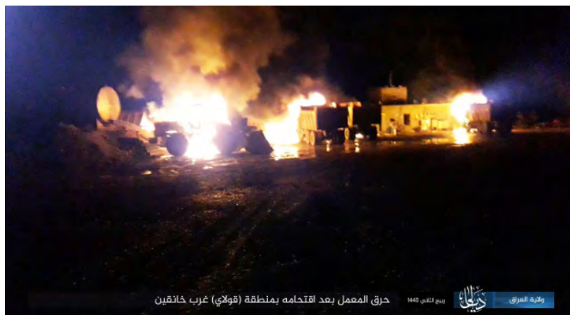
משאיות וטרקטור, שהוצתו ע"י פעילי דאעש (מחוז עיראק-דיאלא, 9 בדצמבר 2018).

◆ מחוז צלאח אלדין: ב-7 בדצמבר 2018 הפעילו פעילי דאעש מטען חבלה נגד כלי רכב של המשטרה הפדרלית העיראקית בקרבת שדה הנפט עלאס ('Allas Oil Field'), כ-41 ק"מ ממזרח לתכרית. דאעש דיווח, כי נוסעי כלי הרכב נהרגו או נפצעו (רדיו אלביאן של דאעש, 9 בדצמבר 2018).