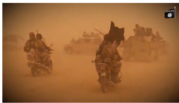
כוח של פעילי דאעש הכולל כלי רכב שטח ואופנועים בדרכו לתקוף את כוחות SDF בחסות סופת חול (שמוח', 10 בדצמבר 2018).