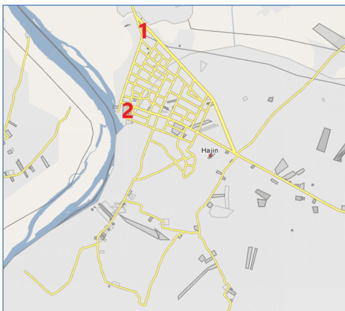
מוקדי עימותים בעיר הג'ין: בית החולים בצפון העיר (1) ושכונת אלחואמה במערבה (2) (Wikimapia)