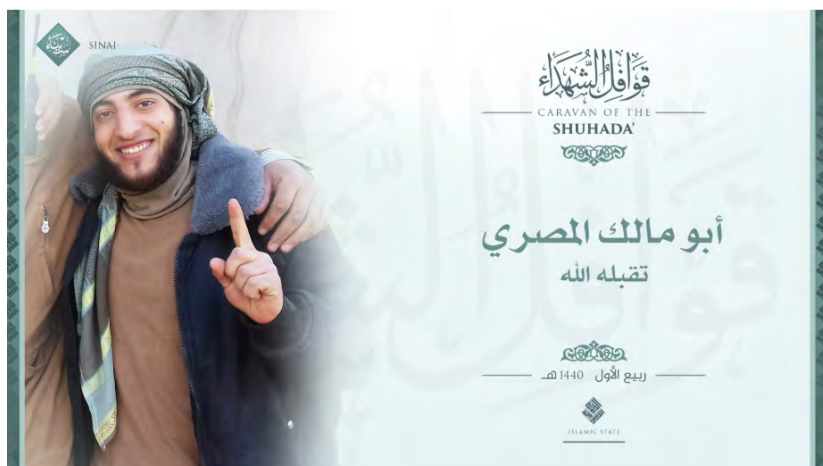
אבו מאלק המצרי, פעיל דאעש בכיר, שנהרג בחצי-האי סיני (אלע'רבאא', 6 בדצמבר 2018).