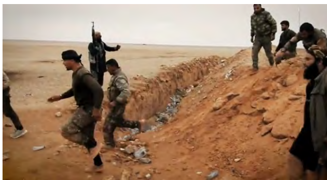
מימין: לוחמי SDF יוצאים לאחר שנכנעו לפעילי דאעש (שמוח', 10 בדצמבר 2018). משמאל: פעילי דאעש יורים לעבר כוחות SDF במהלך סופת חול במרחב, שמצפון לאלבוכמאל (שמוח', 10 בדצמבר 2018).