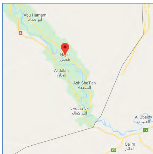
מימין: העיר הג'ין (Google Maps). משמאל: העיר הג'ין (1) והכפר אלבחרה (2) (Wikimapia).