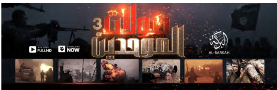
כרזת הסרטון השלישי בסדרה: "התקפות המייחדים את האל" (צולאת אלמוחדין) של מחוז אלברכה של דאעש (שמוח', 10 בדצמבר 2018).

◀ מחוז אלברכה פרסם סרטון, השלישי בסדרה, שכותרתו: "התקפות של [אלון] המייחדים את האל". מטרת הסרטון, שהופק באיכות טובה, להעלות את מורל פעיליו הנלחמים נגד SDF מצפון לאלבוכמאל. בתחילת הסרטון פנייה ישירה לכל אחד מפעילי הארגון ("מי אתה חייל הח'ליפות?"). בהמשך נראות תקיפות אוויריות של מטוסי כוחות הקואליציה ותיעוד של התקפות שערך דאעש בשבועות האחרונים. דאעש מציג בסרטון את הישגיו הכוללים פגיעות בעמדות באמצעות טילי נ"ט, הטמנת מטעני חבלה רבי עוצמה הפעלת מכונות תופת, כיבוש מתחמים המוגנים ע"י סוללת עפר, הצגת גופות של לוחמי כוחות SDF והצגת שבויים (שמוח', 10 בדצמבר 2018).