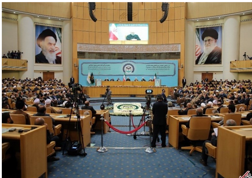
הועידה לאחדות אסלאמית בטהראן (תסנים, 24 בנובמבר 2018)

והפוליטי של עזה על ישראל יהיו השלכות גדולות בהכרעת הסכסוך. הניה הדגיש, כי חמאס תשתף פעולה עם כל גורם, אשר יסייע לה לממש את מטרותיה (תסנים, 24 בנובמבר 2018).