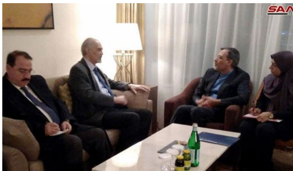
פגישת עוזר שר החוץ האיראני, חסין ג'אברי אנצארי, עם שגריר סוריה באו"ם, בשאר ג'עפרי, באסטנה, (סאנ"א, 28 בנובמבר 2018)

◀ סבב השיחות ה-11 במסגרת תהליך הסדרת הסכסוך בסוריה התקיים בתאריכים 28-29 בנובמבר 2018 באסטנה, בירת קזחסטן, בהשתתפות נציגי רוסיה, איראן, תורכיה, המשטר הסורי והאופוזיציה הסורית. בראש המשלחת האיראנית לשיחות עמד חסין ג'אברי אנצארי (Hossein Jaber Ansari), יועצו הבכיר של שר החוץ האיראני. השיחות התמקדו בהפסקת האש במחוז אדלב ובמאמצים להקמת ועדה חוקתית בסוריה. לקראת סבב השיחות נפגשו סגן שר החוץ הרוסי, סרגיי ורשינין, ושגריר איראן במוסקבה, מהדי סנאאי (Mehdi Sanaei), ודנו בהכנות לשיחות אסטנה ובשיתוף הפעולה בין שתי המדינות (אירנ"א, 27 בנובמבר 2018).