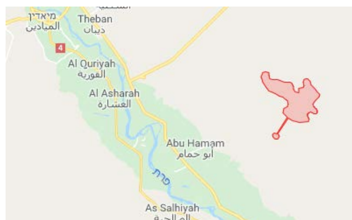
Нефтяное месторождение Аль Танек

► Агентство новостей "Аамак", принадлежащее организации ИГИЛ, сообщило о том, что несколько групп боевиков организации совершили нападение на позицию сил группировки SDF, расположенную поблизости от нефтяной скважины, принадлежащей к нефтяному месторождению Аль Танек (приблизительно в 37 км к юго-востоку от г. Аль Миадин). Как было указано в этом сообщении, в ходе столкновений между сторонами было убито не менее 15 бойцов группировки SDF, а еще несколько бойцов получили ранения (агентство новостей "Аамак", 25 октября 2018 г.).