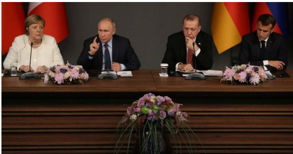
4-сторонняя встреча на высшем уровне в Стамбуле. Слева направо: Эммануэль Макрон, Раджеп Тайип Эрдоган, Владимир Путин и Ангела Меркель (сайт "Ахбал Алан", 28 октября 2018 г.)

► После завершения встречи 4 лидеров опубликовали совместное заявление, в рамках которого они отметили, что внимательно следили за развитием событий в Сирии, выразили свою общую озабоченность состоянием безопасности в регионе и согласие на сотрудничество, направленное на выработку решения для кризиса в Сирии. Среди прочего, в данном заявлении содержится и высказывание по поводу района г. Идлиб: 4 лидеров выразили свою обязанность разгромить организации ИГИЛ и "Фронт Аль Нусра" (то есть – группировку "Штаб по освобождению Аль Шаам") , а также всех остальных "боевиков террора", действующих на территории Сирии. Они также приветствовали достижение соглашения в отношении г. Идлиб и тот прогресс, который происходит в выводе средств тяжелого вооружения и "радикальных формирований" из демаркационной зоны (решение о создании которой было принято в ходе встречи на высшем уровне, проведенной в г. Сочи, между президентами России и Турции) (сайт резиденции президента Франции, 28 октября 2018 г.).