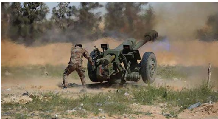
Силы сирийской армии ведут артиллерийский огонь (сайт "Батулат аль джиш аль Сури", 25 октября 2018 г.)

позиций группировки "Штаб по освобождению Аль Шаам", расположенных к северо-западу от г. Халеб (сайт "Батулат аль джиш аль Сури", 25 октября 2018 г.).