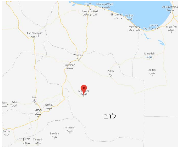
Аль Пакха

► Организация ИГИЛ опубликовала заявление, гласящее, что ее боевики провели рейд в село Аль Пакха в рамках поиска "лиц, объявленных в розыск" : служащих полиции, солдат и агентов армии Хафтара. Как было указано в заявлении, боевики организации ИГИЛ напали на местный полицейский участок, убили несколько служащих полиции и сожгли здание участка. Помимо этого, они арестовали несколько разыскиваемых и сожгли их дома (газета "Аль Гарба", 29 октября 2018 г.). Также организация ИГИЛ сообщила, что ее боевики уничтожили транспортное средство, которое предприняло попытку преследовать их по пустынной местности (округ Бараке организации ИГИЛ, 29 октября 2018 г.).