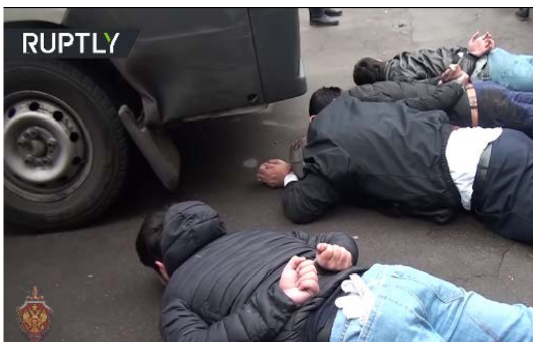
Кадр из ролика, в котором были сняты члены террористической ячейки непосредственно после их задержания (канал Ютуб газеты "Россия сегодня", 26 октября 2018 г.)

совершению терактов, а также техническое руководство по изготовлению взрывных устройств в домашних условиях. Террористическая ячейка получала финансирование как путем перечисления денежных средств из-за границы, так и путем ведения криминальной деятельности местного характера. Руководство ячейкой осуществлялось боевиками родом из Центральной Азии, находящимися на территории Сирии (агентства новостей "Спутник" и ТАСС, газета "Россия сегодня", 26 октября 2018 г.).