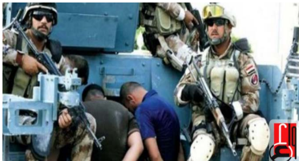
Служащие иракских сил безопасности и несколько из задержанных ими боевиков организации ИГИЛ