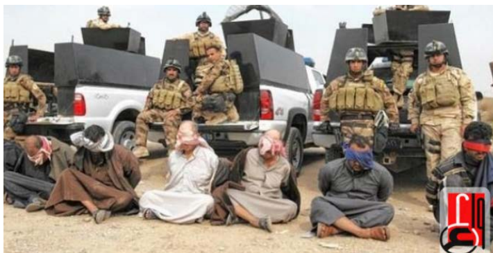
Служащие иракских сил безопасности и задержанные ими члены "террористической ячейки" (судя по всему – боевики организации ИГИЛ) (газета "Ираки ньюз", 28 октября 2018 г.)