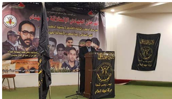
עצרת הג'האד האסלאמי באלבירה