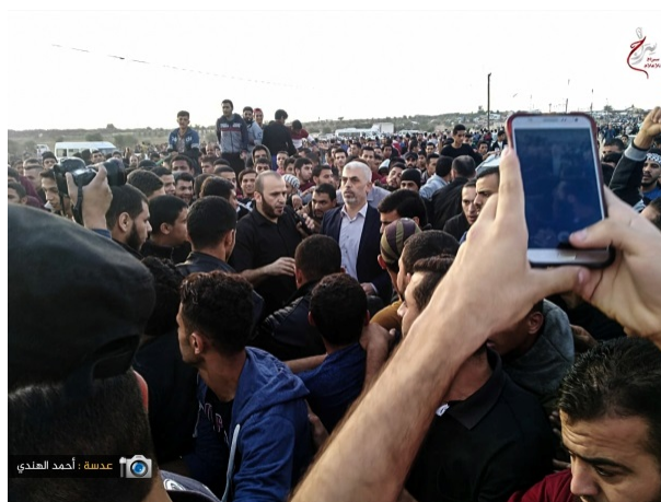
Yahya al-Sinwar, chef du bureau politique du Hamas dans la bande de Gaza (chemise blanche), lors de la marche dans l'Est de la ville de Gaza (Page Facebook de l'Autorité nationale suprême de la marche du retour, 10 novembre 2018)