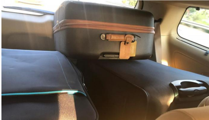
Transport de 15 millions de dollars du Qatar dans la bande de Gaza dans trois valises à l'arrière de la voiture de Mohammed al-Emadi (président du comité qatarien)