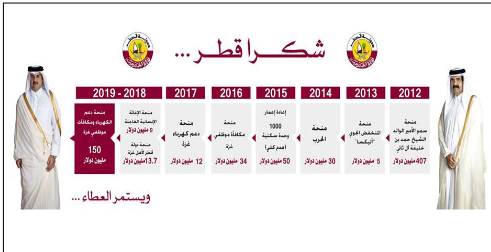
La page Facebook du Comité qatari indiquant le montant annuel de l'aide fournie par le Qatar à la bande de Gaza depuis 2012, pour un montant d'environ 717 millions de dollars (Page Facebook du fonds qatari, 12 novembre 2018)

► "De hauts responsables palestiniens" ont indiqué que Mahmoud Abbas avait déclaré aux Qataris que l'Autorité Palestinienne et l'OLP s'opposaient à l'aide financière fournie par le Qatar à la bande de Gaza. Cela est dû aux préoccupations concernant les implications politiques de l'aide, y compris la séparation de la bande de Gaza des autres territoires [de l'AP], la promotion de "l'accord du siècle" américain et le renforcement du régime du Hamas dans la bande de Gaza. (Al-Hayat, 11 novembre 2018).