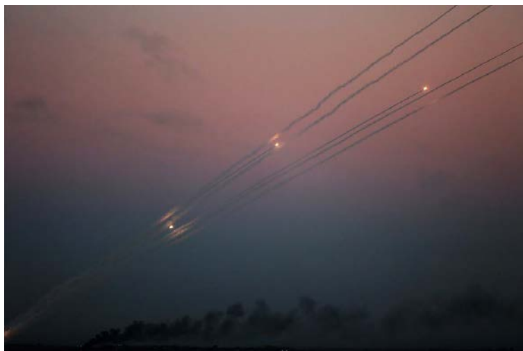
Les traces des roquettes tirées de la bande de Gaza en territoire israélien (Compte Twitter Palinfo, 13 novembre 2018)