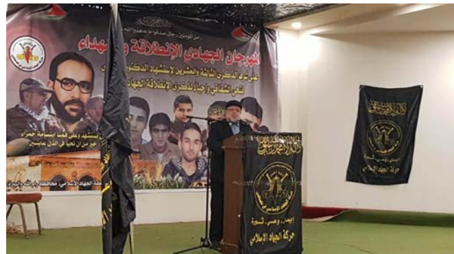
Le rassemblement du JIP à al-Bireh