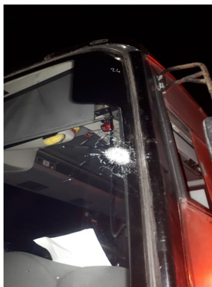
Le pare-brise du bus attaqué près de Beit El (Cécurité de Beit El, 7 novembre 2018)

► Le 7 novembre 2018, des coups de feu ont été tirés sur un bus israélien sur la route à l'Est de Ramallah. Plusieurs balles ont touché le pare-brise et le côté du bus. Le conducteur et un passager ont été légèrement blessés. Les forces de Tsahal ont recherché les tireurs dans la zone (Porte-parole de Tsahal, 7 novembre 2018).