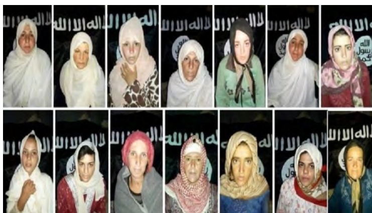
14 похищенных друзских женщин, все еще остающихся в плену организации ИГИЛ

Эта сделка стала возможной в результате давления, которое в последнее время оказывали друзские жители из района села Аль Сувейда на сирийские власти, что находило свое выражение в демонстрациях протеста, проводившихся жителями. Освобождение похищенных женщин приведет к ослаблению давления на сирийский режим со стороны местного населения, состоящего преимущественно из друзов, и позволит продолжать действия, направленные на укрепление и расширение контроля властей страны в этом районе. С точки зрения организации ИГИЛ, получение крупных сумм денег в обмен на освобождение удерживаемых ее боевиками похищенных и заложников может подтолкнуть ее к организации и совершению новых похищений мирных жителей, в качестве альтернативного "источника доходов", взамен тех, которые были утрачены организацией в результате крушения исламского государства.