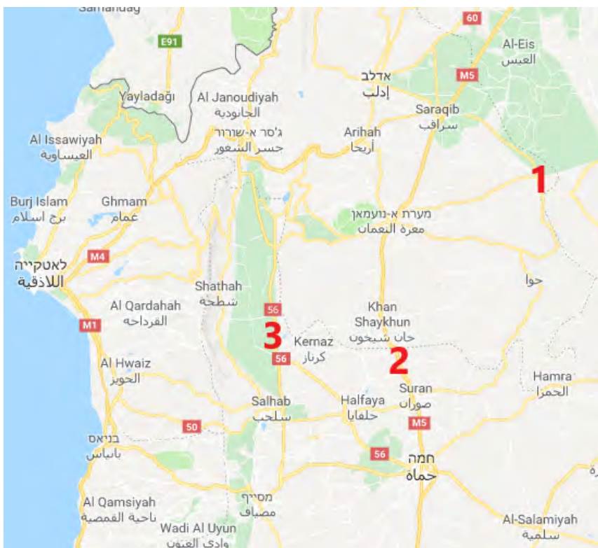
Гуманитарные пропускные пункты в районе г. Идлиб, открытие которых ожидается в ближайшие дни: Абу Аль Тахор (1), Мурак (2), Калаат Аль Мачик (3)

По нашим оценкам, приготовления к открытию "гуманитарных пропускных пунктов" можно рассматривать в качестве одного из элементов подготовки сил сирийского режима к возможному возобновлению боевых действий. Предоставление местным жителям возможности эвакуироваться с территорий, находящихся под контролем повстанческих организаций, имеет своей целью предотвратить тяжелые потери и массовое бегство в момент возобновления операции по захвату провинции Идлиб, что может привести к оказанию международного давления на сирийский режим. Можно с уверенностью предположить, что повстанческие организации, которые предпринимают различные действия с целью углубить и укрепить свои позиции в среде мирного населения и, в случае необходимости, воспользоваться им в качестве "живого щита", будут пытаться создавать помехи массовому перемещению жителей в районы, находящиеся под контролем сил сирийской армии, через "гуманитарные пропускные пункты".