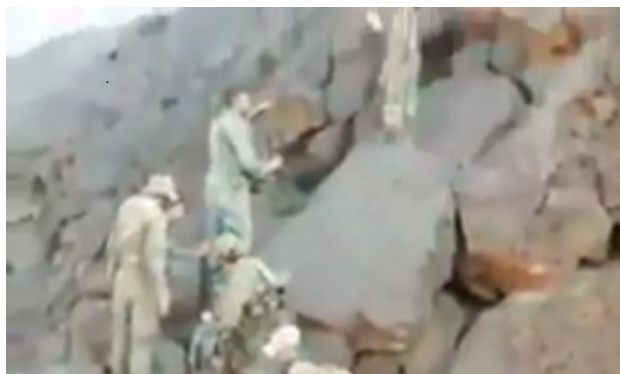
Солдаты сирийской армии сталкиваются с трудностями при продвижении по гористой местности в районе села Аль Сафа (Ютуб, 16 октября 2018 г.)

► В районе села Аль Сафа продолжались ожесточенные боевые действия между силами сирийской армии и боевиками организации ИГИЛ, которые удерживают свои укрепленные позиции в этом районе. 16-го октября 2018 г. из агентства новостей "Аамак", принадлежащего организации ИГИЛ, было получено сообщение о том, что боевики организации убили и ранили 46 солдат сирийской армии в районе села Аль Сафа. На следующий день агентство новостей "Аамак" сообщило об убийстве еще 4 солдат сирийской армии (газета "Анав Балади", 17 октября 2018 г.).