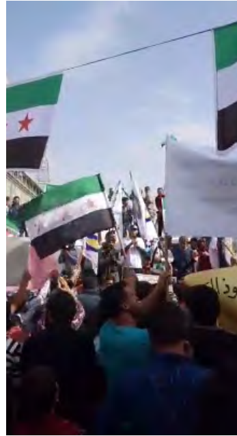
Справа: участники демонстрации несут флаги группировки "Свободная армия Сирии", в г. Мара, расположенном к северу от г. Халеб. Слева: ребенок держит в руках плакат с текстом на арабском языке: "Народ Сирии ... только он будет решать, кому уходить, а кому оставаться" (страница Фейсбук "Прат пост", 19 октября 2018 г.)