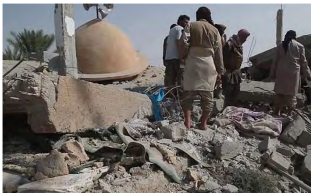
Развалины мечети Отман в селе Аль Суса, которая использовалась в качестве командного пункта организации ИГИЛ и была атакована самолетами сил международной коалиции

► Бойцы группировки SDF действующие в районе села Аль Суса, получали поддержку с воздуха со стороны сил международной коалиции. В ходе одного из боевых вылетов сил международной коалиции (18 октября 2018 г.), самолеты нанесли удар по мечети, которая расположена в селе Аль Суса и которая использовалась в качестве командного пункта организации ИГИЛ. Как сообщили представители сил международной коалиции, в результате этого удара было уничтожено 12 боевиков организации ИГИЛ. В дополнение к этому, сообщалось, что в результате удара с воздуха, нанесенного по мечети и нескольким домам, расположенным поблизости от берега реки Евфрат, было уничтожено еще 22 боевика организации ИГИЛ (агентство новостей Ройтерс, 21 октября 2018 г.).