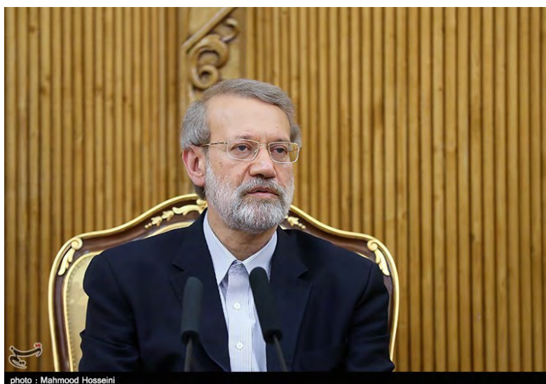
יו"ר המג'לס לאריג'אני (תסנים, 9 באוקטובר 2018).

◀ יו"ר המג'לס, עלי לאריג'אני (Ali Larijani), שביקר בראשית אוקטובר 2018 בתורכיה כדי להשתתף בכינוס פרלמנטרי בינלאומי, העריך בריאיון לערוץ הטלוויזיה Russia Today (RT) (8 באוקטובר 2018), כי ישראל לא תהיה מסוגלת לבצע "פעולה רצינית" נוספת בסוריה בעקבות הצבת מערכות ההגנה האווירית S-300 במדינה. הוא ציין, כי זכותה של רוסיה להציב את המערכת בסוריה כדי להגן על האינטרסים שלה, במיוחד לאחר המתקפה נגד המטוס הרוסי. עוד אמר לאריג'אני, כי קיימת הסכמה מלאה בין רוסיה ואיראן בנוגע לסוריה.