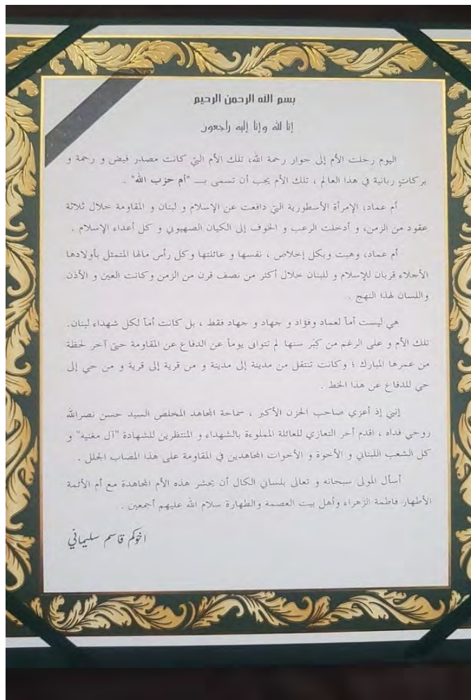
אגרת התנחומים של קאסם סלימאני לנצראללה (אל-עאלם, 10 באוקטובר 2018).

להמשך המאבק נגד "המשטר הציוני" עד לחיסולו המוחלט. הוא ציין, כי המשטר הציוני מתקרב יותר ויותר אל סופו (תסנים, 11 באוקטובר 2018). מפקד כוח קדס של משמרות המהפכה, קאסם סלימאני, שלח, אף הוא, אגרת תנחומים לנצראללה בה כינה את אמו של מע'ניה "אם חזבאללה" (אל-עאלם, 10 באוקטובר 2018).