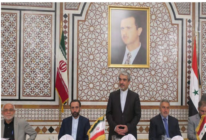
שגריר איראן בסוריה נפגש עם אנשי עסקים בדמשק (אירנ"א, 15 באוקטובר 2018).

◀ בתוך כך אמר שגריר איראן בדמשק, ג'ואד תרכאבאדי (Javad Torkabadi), כי אנשי עסקים איראנים וסורים צריכים להכיר טוב יותר את ההזדמנויות הכלכליות בשתי המדינות כדי לסייע בפיתוח הקשרים ביניהן. בפגישה עם אנשי עסקים וסוחרים סורים בדמשק אמר השגריר, כי משקיעים איראנים וסורים מהמגזר הפרטי יצרו קשרים טובים ביניהם במהלך התערוכה הבינלאומית לשיקום סוריה, שהתקיימה בראשית אוקטובר 2018 בדמשק, וכי אנשי עסקים פועלים לפיתוח הקשרים הכלכליים בין איראן וסוריה (פארס, 15 באוקטובר 2018).