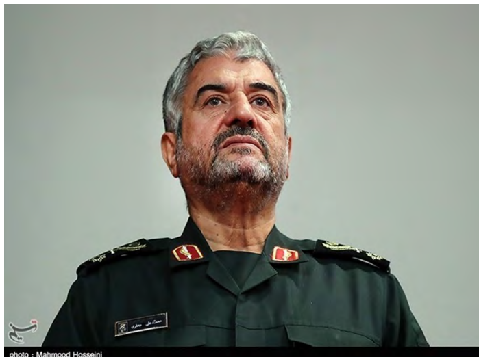
מפקד משמרות המהפכה (תסנים, 12 באוקטובר 2018).