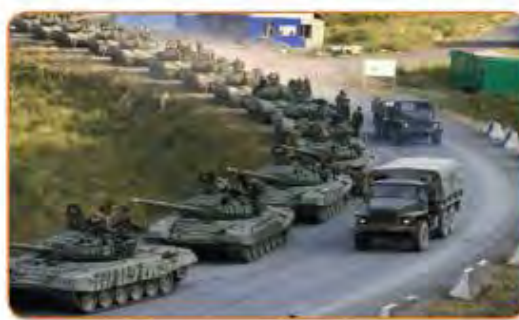
اجتياح لبنان عام 1982 م