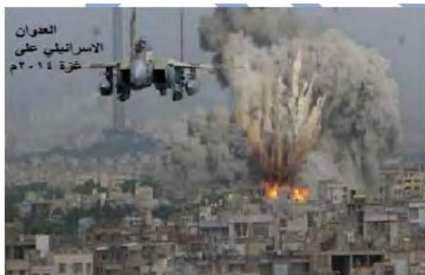
(לימודי היסטוריה, כתה י"ב, טיוטה (ללא תאריך [2018]) עמ' 4)

[הכיתוב על התמונה אומר: "התוקפנות הישראלית נגד עזה, 2014" 8]