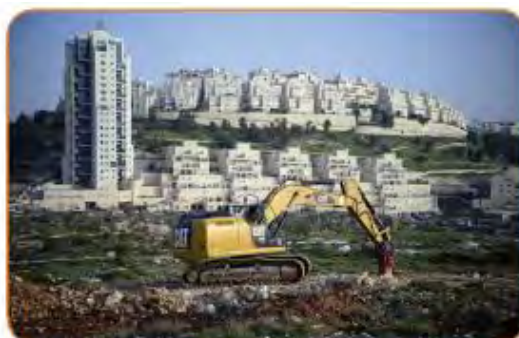
الاستيطان الصهيوني في فلسطين