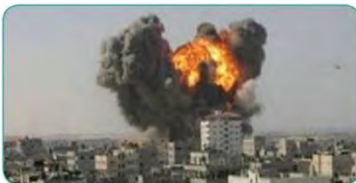
الغارات الصهيونية على غزة عام ٢٠١٤م

◀ תצלום בכותרת: "התקפות [האוויר] הציוניות על עזה בשנת 2014."