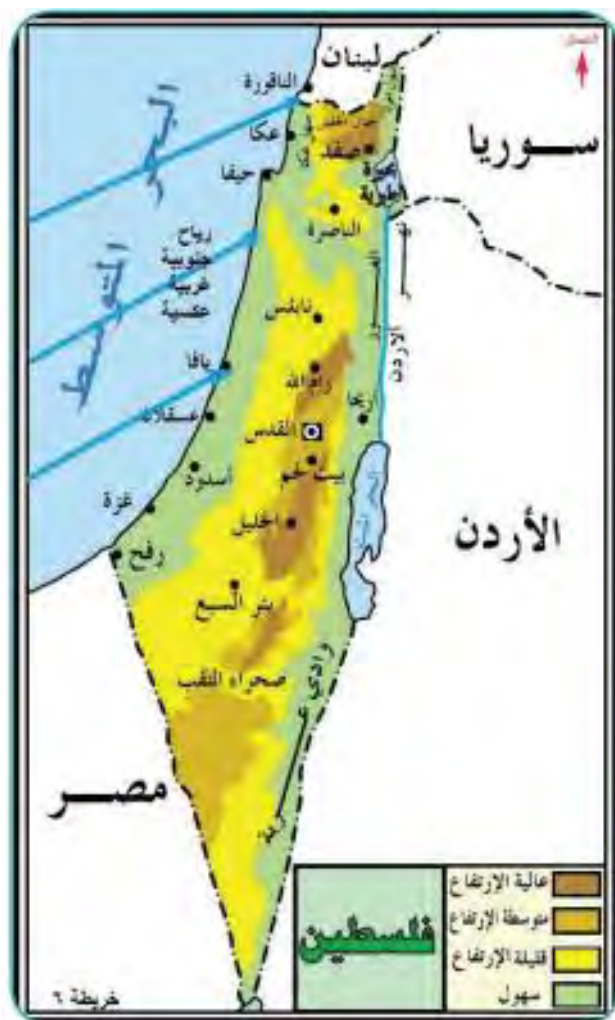
לימודי גיאוגרפיה (כתה י"ב (2018) עמ' 45)