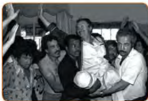
מחולת אגילאל רוסאא البلديات - 1980 מ

◆ "ההתנחלות הציונית [אל-איסתיטאן אל-צהיונין] בפלסטין; ניסיון ההתנקשות בראשי הערים 1980; השבויים הפלסטינים; ההפגנות הפלסטיניות; הפלישה ללבנון בשנת 1982; יציאת [כוחות] ההתנגדות הפלסטינית מלבנון [בעקבות הפלישה]".