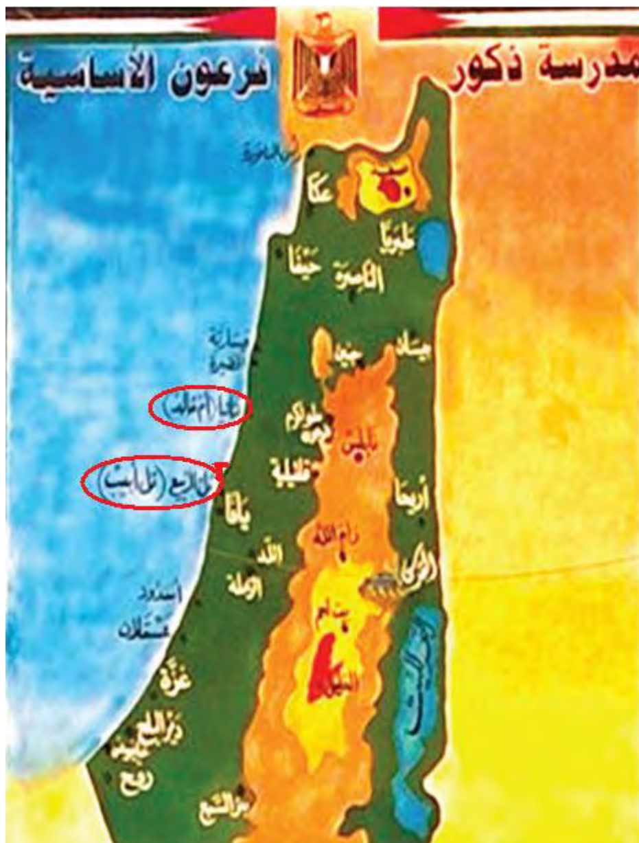
מתמטיקה (כתה י"ב [ריאלית] (2018) עמ' 100)

◀ המפה שלהלן אינה מציגה כלל ערים שנוסדו ע"י יהודים. מיקום הערים אשדוד (בעצם הכפר הערבי אשדוד) ואשקלון הוחלף בטעות: