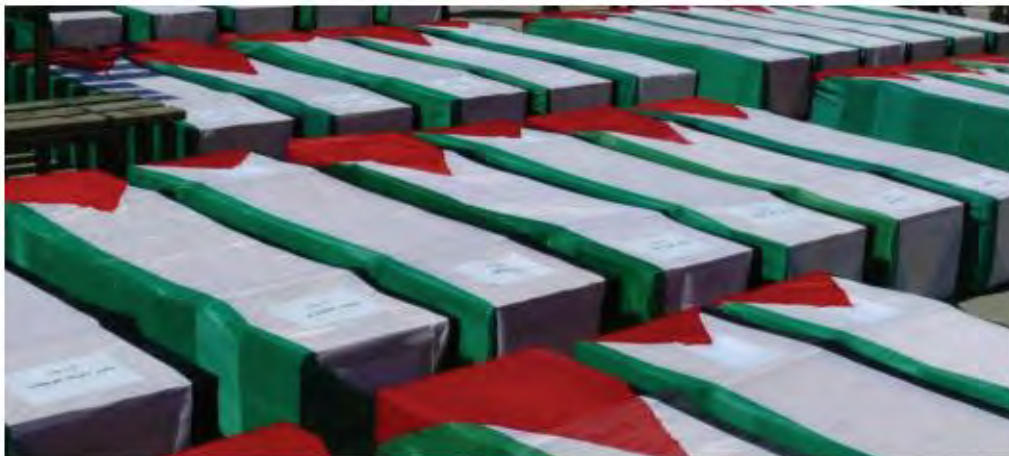
شهداء مقبرة الأرقام

◀ להלן תצלום של עשרות קבורה מכוסים בדגלי פלסטין. הכיתוב אומר: "המרטירים של בית הקברות של המספרים". המונח מתאר את המקום שבו נקברו ע"י השלטונות הישראליים תחת מספרים סידוריים מבצעי פיגועי התאבדות וטרוריסטים אחרים שנהרגו בפעולות דומות בתוך ישראל ומפעם לפעם מחזירים חלק מהם לרש"פ. זו חולקת להם כבוד גיבורים ומכסה את ארונותיהם בדגל הפלסטיני, כפי שנראה בתמונה.