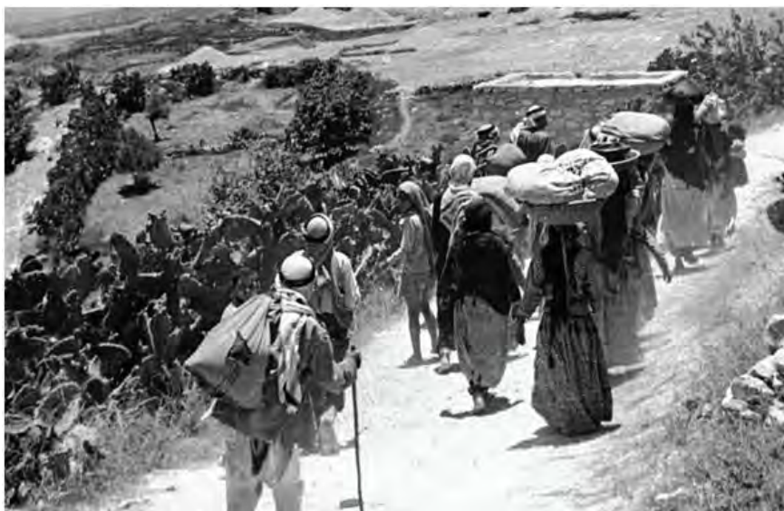
השפה הערבית 1: קריאה, דקדוק, משקלי שירה והבעה (המסלול האקדמי, כתה י"ב (2018) עמ' 83)