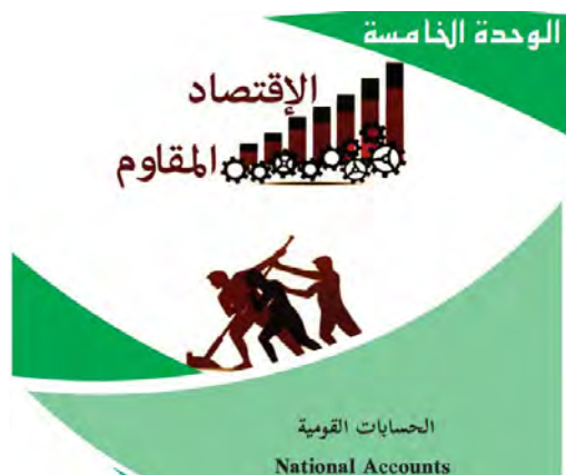
ניהול וכלכלה (כתה י"ב [יזמות ועסקים] (2017) עמ' 116)