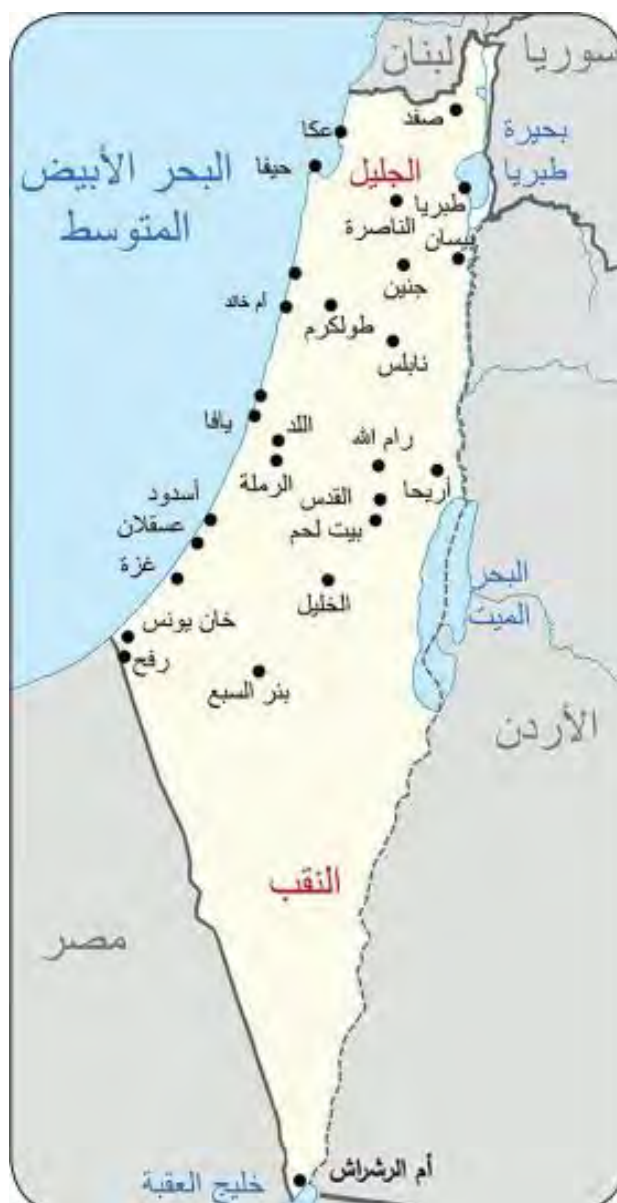
מתמטיקה (כתה י"א [הומאנית] (2017) עמ' 6)

◀ מפת הארץ עם סמל הרש"פ בראשה לצד הכיתוב "ביה"ס היסודי לבנים פרעון" מציינת את השם "תל אביב" בסוגריים והוא מלווה בתרגום לערבית "תל- אלרביע". נתניה מופיעה גם כן כ"נתאניא (אום ח'אלד)". שתיהן סומנו באדום לנוחות קוראי המחקר. העיר היהודית המודרנית חדרה, ששמה לקוח מהשפה הערבית במשמעות של "ירקרה" (בגלל הביצות שהיו שם) מופיעה גם היא. המפה הוגדלה הרבה מעבר לגודלה המקורי כדי לאפשר את קריאת שמות המקומות: