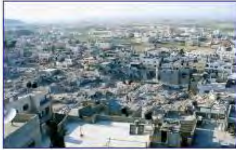
مخيم جنين عام ٢٠٠٢م