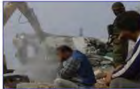
جرافات الاحتلال الصهيوني تهدم المنازل الفلسطينية