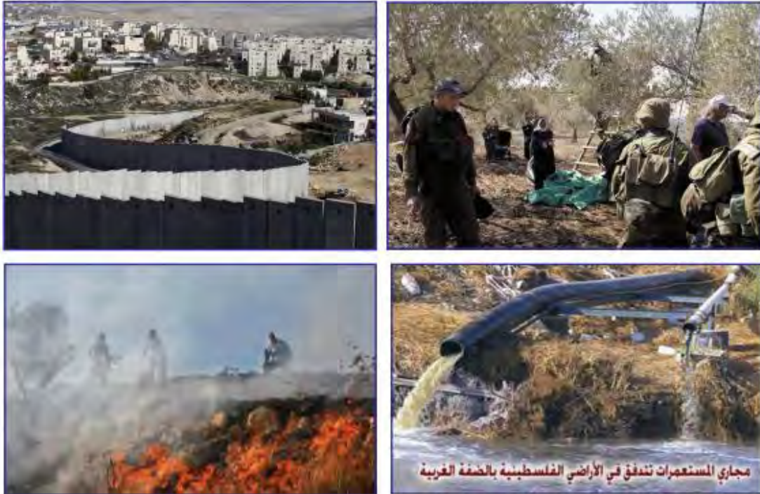
شكل (٨): عوامل مؤثرة في تحقيق الأمن الغذائي الفلسطيني

(לימודי גיאוגרפיה, כתה י"א, חלק ב' (2017) עמ' 66)