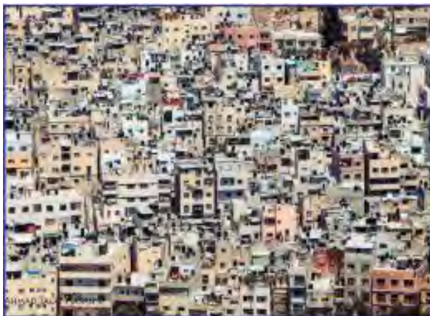
מחנה للاجئين الفلسطينيين