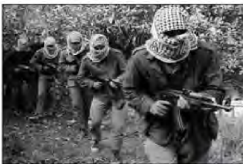
(לימודי היסטוריה, כתה י"ב [הומאנית] (2018) עמ' 45)

◀ המאבק האלים לשחרור מכונה לעיתים קרובות "מהפיכה [ת'וורה]". להלן תמונה המובאת בספר לימוד היסטוריה במסגרת פרק על מהפיכות עממיות: