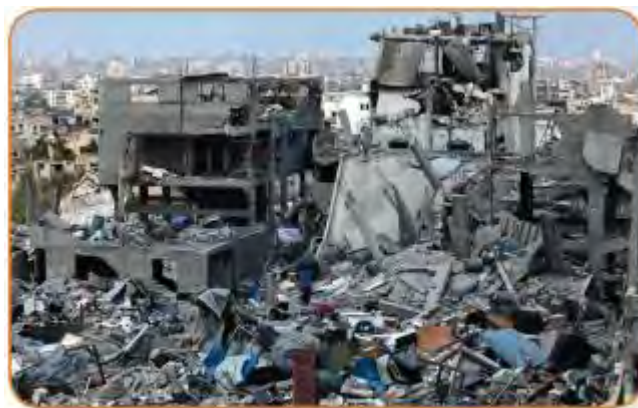
الحرب على غزة عام ٢٠١٤