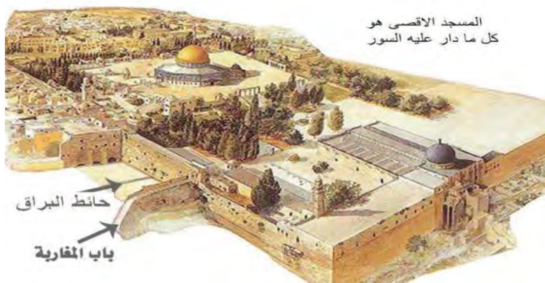
ניהול וכלכלה (כתה י"א, חלק א' [יזמות ועסקים] (2017) עמ' 40)

האסלאמית בישראל בתחילת שנות האלפיים]" וכן הכותל המערבי - הקדוש ליהודים - והנקרא כאן "כותל אל-בוראק" (ניהול וכלכלה, כתה י"א, חלק א' [יזמות ועסקים] (2017) עמ' 40). התמונה שלהלן כוללת את ההסבר "מסגד אל-אקצא הוא כל מה שמוקף ע"י החומה" וחיצים מצביעים על "כותל אל-בוראק [הכותל המערבי]" ו"שער המוגרבים". כמו-כן נאמר כי "הכיבוש הציוני סגר את שער המוגרבים מאז 1967". 7