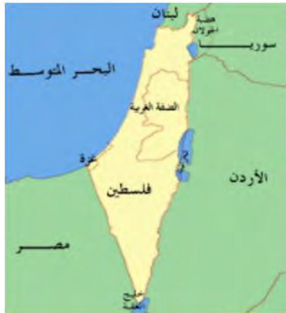
לימודי היסטוריה (כתה י"ב, טיוטה (ללא תאריך [2018]) עמ' 142)