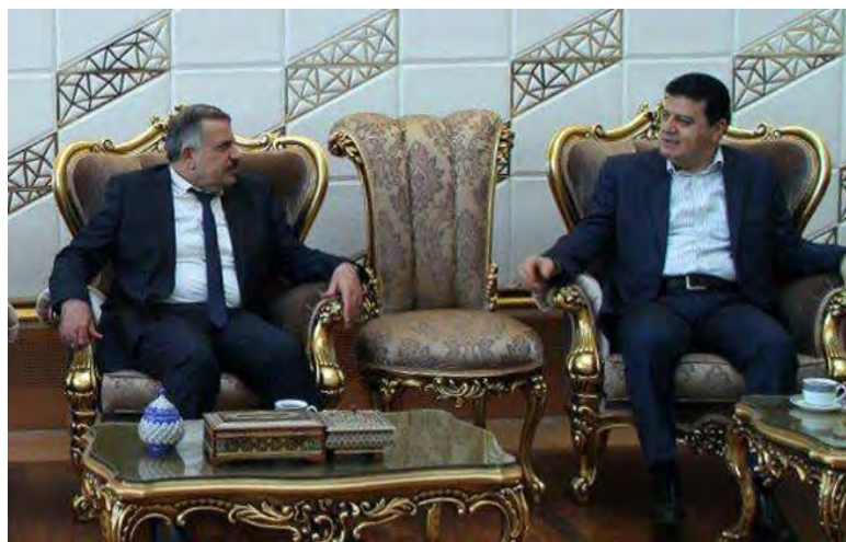
שר החשמל הסורי (משמאל) בטהראן (28 בספטמבר 2018)