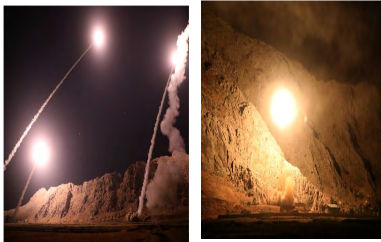
מתקפת הטילים למזרח סוריה (תסנים, 1 באוקטובר 2018)

◀ מרכז המעקב הסורי לזכויות אדם דיווח (2 באוקטובר 2018), כי שיגור הטילים כוון לאזור העיירה הג'ין, שבשליטת דאעש בסמוך לגבול סוריה-עיראק, וכי בתקיפה האיראנית נהרגו שמונה פעילי דאעש ו/או בני משפחותיהם. מושל מחוז כרמאנשאה הכחיש דיווחים בתקשורת לפיהם אחד הטילים, ששוגרו לעבר סוריה, נחת בשטח המחוז. סוכנות הידיעות האיראנית פארס דיווחה, כי הטילים ששוגרו הם מדגם ד'ו-אלפקאר (Zolfaghar) לטווח 750 ק"מ וקיאם (Qiam) לטווח 800 ק"מ. על אחד הטילים נכתב: "מוות לאמריקה, מוות לישראל, מוות לבית סעוד (פארס, 1 באוקטובר 2018).