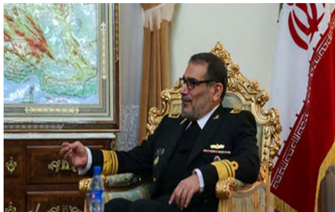
עלי שמח'אני (פארס, 27 בספטמבר 2018)

התייעצויות סביב המצב בסוריה התקיימו גם בין שרי החוץ של רוסיה, תורכיה ואיראן, שנפגשו בשולי עצרת האו"ם בניו-יורק.