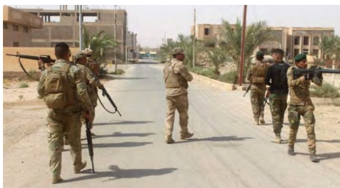
Пеший патруль иракских сил безопасности в ходе проведения одной из операций против организации ИГИЛ (газета "Ираки ньюз", 7 сентября 2018 г.)

◆ Уничтожение боевиков организации ИГИЛ: служащие иракских сил безопасности, которые проводили крупную операцию к югу от г. Мосул , уничтожили 13 боевиков организации ИГИЛ, приблизительно в 12 км к югу от села Киара (газета "Ираки ньюз", 12 сентября 2018 г.).