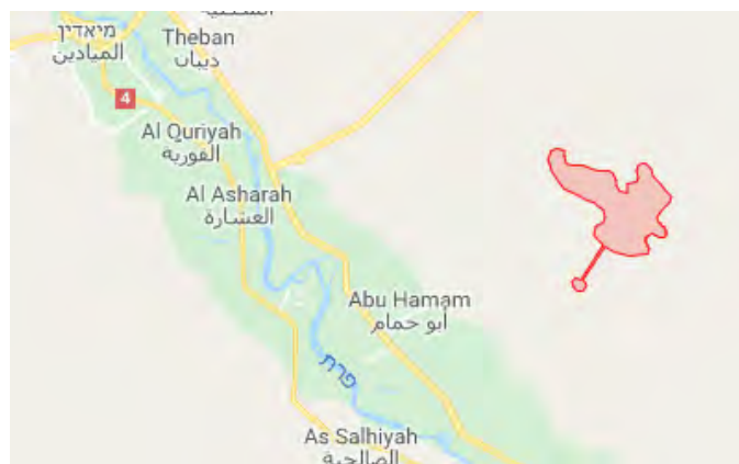
Нефтяное месторождение Аль Танак (обозначено красным цветом)

► 12-го сентября 2018 г. боевики организации ИГИЛ совершили нападение на подразделение сил группировки SDF, дислоцированное неподалеку от нефтяного месторождения Аль Танак , которое находится приблизительно в 37 км к юго-востоку от г. Аль Миадин. Несколько бойцов сил группировки SDF было убито и ранено (сирийский наблюдательный центр по защите прав человека, 12 сентября 2018 г.). Целью совершения этого нападения была, судя по всему, попытка отвлечь внимание группировки SDF от боевых действий, ведущихся в районе между селами Хаджин и Аль Шафа, а также в районе села Аль Багуз. Следует отметить, что нефтяное месторождение Аль Танак – одно из наиболее крупных в Сирии.