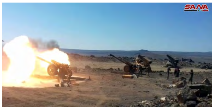
Полевые артиллерийские орудия и реактивные ракетные установки сирийской армии, принимающие участие в операции в районе села Аль Сафа (12 сентября 2018 г.)