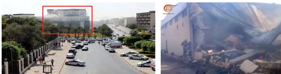
Справа: сотрудники службы пожарной охраны возле развалин здания штаб-квартиры национального института нефти (канал Ютуб "Аль Миадин", 10 сентября 2018 г.). Слева: клубы дыма поднимаются над зданием штаб-квартиры национального института нефти (в красной рамке), в результате нападения боевиков организации ИГИЛ (Erem News, сайт новостей из Объединенных Арабских Эмиратов, 11 сентября 2018 г.)