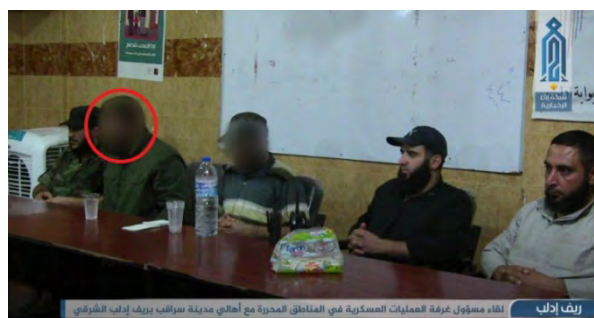
Боевики группировки "Штаб по освобождению Аль Шаам" (справа) и представители населения г. Саракаб (слева) в ходе встречи (агентство новостей "Абаа", 14 сентября 2018 г.)