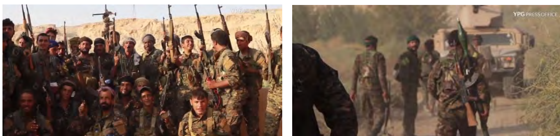
Справа: бойцы сил группировки SDF направляются к селу Аль Багуз. Слева: бойцы сил группировки SDF поблизости от села Аль Багуз

► На данном этапе наступления происходят столкновения, между силами группировки SDF и боевиками организации ИГИЛ, в районе сел Хаджин и Аль Багуз, которые расположены к востоку от г. Аль Абу Кемаль. Силы международной коалиции оказывают поддержку бойцам группировки SDF путем нанесения ударов с воздуха и ведения артиллерийских обстрелов, в результате чего было убито не менее 17 боевиков организации ИГИЛ (сирийский наблюдательный центр по защите прав человека, 10 сентября 2018 г.). Группе боевиков организации ИГИЛ удалось уничтожить 1 бронированное транспортное средство сил группировки SDF, применив против него противотанковый ракетный комплекс, в районе села Аль Багуз, где ведутся ожесточенные боевые действия.