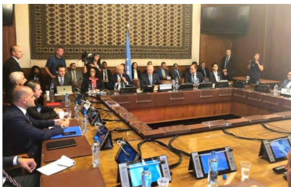
Беседы, проходившие в Женеве, между представителями России, Турции, Ирана и ООН. Слева: члены российской делегации (аккаунт Твиттер министерства иностранных дел Российской Федерации, 12 сентября 2018 г.)