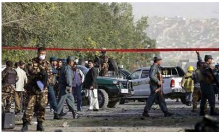
Место совершения теракта (сайт "Аджел", 9 сентября 2018 г.)

себя ответственность за совершение этого теракта и заявил, что в результате было убито и ранено 55 человек (газета "Сада Аль Балад", 10 сентября 2018 г.).