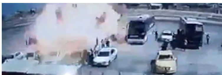
Момент взрыва заминированного автомобиля (небольшого грузовика) организации ИГИЛ, который был припаркован напротив ресторана, расположенного к северу от г. Тикрит (12 сентября 2018 г.)