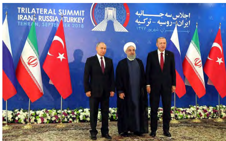
Президент Турции Раджип Тайип Эрдоган (справа), президент Ирана Хасан Рухани (в центре) и президент Российской Федерации Владимир Путин (слева), в ходе государственной встречи на высшем уровне, состоявшейся в Тегеране (сайт президента России, 7 сентября 2018 г.)

В ходе политических контактов, которые велись на протяжении последних недель, возникли разногласия между Россией, Ираном и Турцией , вокруг вопроса о необходимости захвата района г. Идлиб. В то время, как Россия и Иран выступают в поддержку масштабного сухопутного наступления, Турция возражает против него, публично призывает к прекращению огня и требует от России и от Ирана прекратить ведущиеся их силами бомбардировки и обстрелы . Министр иностранных дел Турции пояснил, что в том случае, если эти бомбардировки и обстрелы будут прекращены – Турция будет согласна действовать в согласовании со всеми замешанными сторонами, с целью добиться окончания присутствия "террористических организаций" в районе г. Идлиб (газета "Хорайет Дейли ньюз", 12 сентября 2018 г.). Эти разногласия уже помешали выработке соглашения в ходе встречи на высшем уровне, которая проводилась в Тегеране (7 сентября 2018 г.) при участии лидеров России, Ирана и Турции.