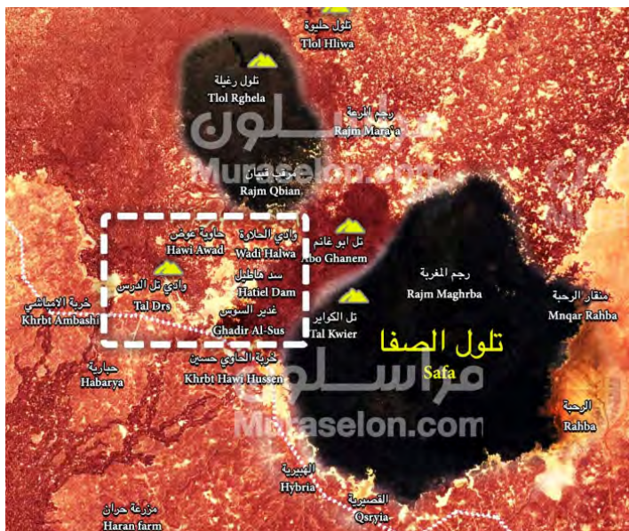
Анклав организации ИГИЛ (обозначен черным цветом), который был разрезан на 2 части. Район, захваченный в последнее время силами сирийской армии, обозначен пунктиром белого цвета (сайт "Марасалон", 30 августа 2018 г.)