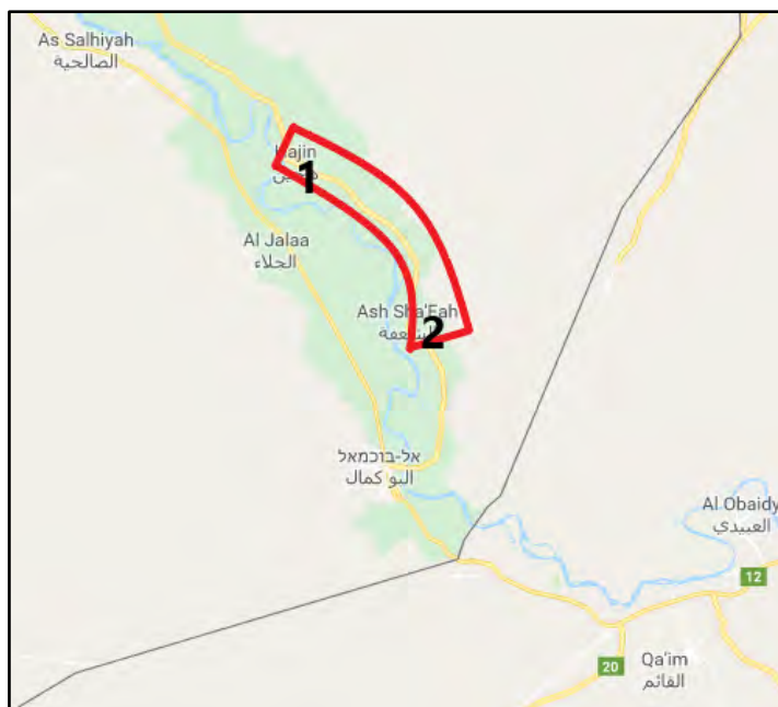
Анклав организации ИГИЛ, расположенный между селами Хаджин (1) и Аль Шафа (2)

коалиции разбрасывали над селом Хаджин листовки с призывом, обращенным к боевикам организации ИГИЛ, сдаться, а к местным жителям – не приближаться к укреплениям и к другим объектам организации (агентство новостей "Хатуа", 4 сентября 2018 г.).