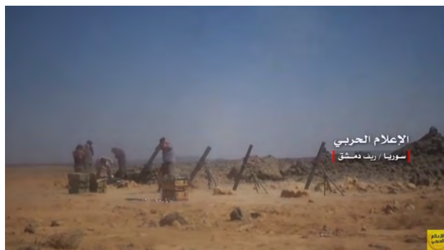
Справа: силы сирийской армии ведут минометный обстрел в направлении села Аль Сафа, которое находится под контролем организации ИГИЛ. Слева: зенитная артиллерийская установка сирийской армии ведет огонь в направлении села Аль Сафа (орган боевой пропаганды сирийской армии, 30 августа 2018 г.)