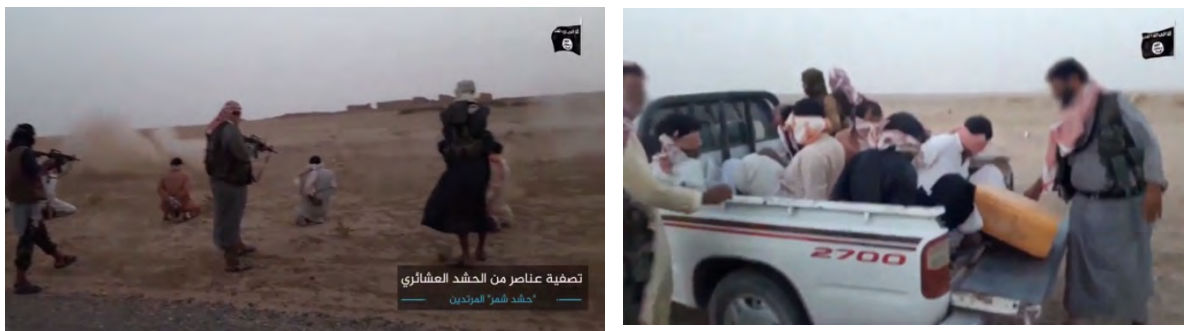
Справа: бойцы сил "призыва племен", члены племени Шамер, доставляются боевиками организации ИГИЛ к месту совершения казни. Слева: момент совершения казни бойцов сил "призыва племен", членов племени Шамер, боевиками организации ИГИЛ (сайт http://archive.org , 31 августа 2018 г.)