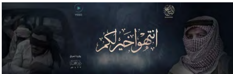
Заставка к ролику "Вам лучше прекратить", который был распространен округом Салах Аль Дин организации ИГИЛ (сайт http://archive.org , 31 августа 2018 г.)

► Округ Салах Аль Дин организации ИГИЛ на территории Ирака распространил ролик под заголовком "Вам лучше прекратить" . В ролике был снят боевик организации ИГИЛ, который говорил о нападениях, совершенных в прошлом организацией ИГИЛ против суннитов, проживающих на территории Ирака, и в частности – против суннитских племен, в том числе и племени Шамер (наиболее многочисленное племя в западной части Ирака). По словам боевика, причиной этих нападений является сотрудничество племен с иракской армией, полицией и силами "призыва племен" в ведении боевых действий против организации ИГИЛ. Боевик высказывал угрозы в адрес суннитов, требуя от них прекратить сотрудничество с "шиитским режимом неверных" . В ролик были включены отрывки архивных съемок, на которых запечатлена казнь членов племени Шамер, бойцов сил "призыва племен", которые были захвачены боевиками организации ИГИЛ (сайт http://archive.org , 31 августа 2018 г.).