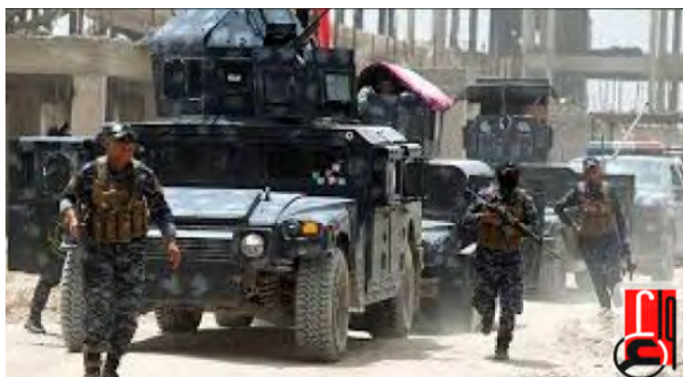
Подразделение иракской полиции в ходе проведения одной из операций (иракское агентство новостей, 31 августа 2018 г.)

◆ Обнаружение взрывных устройств: служащие иракской полиции обнаружили 28 взрывных устройств в провинции Киркук (иракское агентство новостей, 31 августа 2018 г.). В ходе другой операции служащие иракских сил безопасности обнаружили 450 взрывных устройств, которые хранились в нескольких тайниках, приблизительно в 49 км к северо-западу от г. Аль Рамади (иракское агентство новостей, 31 августа 2018 г.).