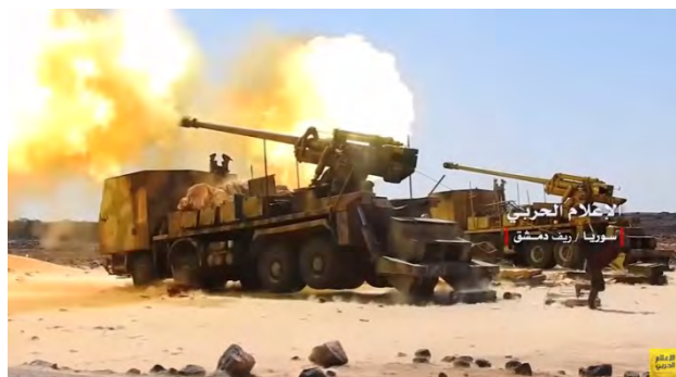
Справа: артиллерийские орудия сирийской армии, установленные на грузовиках, ведут огонь в направлении села Аль Сафа. Слева: запуск ракетных снарядов в направлении села Аль Сафа (орган боевой пропаганды сирийской армии, 30 августа 2018 г.)