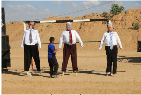
בובות תלויות של בנימין נתניהו אביגדור ליברמן ודונלד טראמפ נשיא ארה"ב. הבובות נתלו סמוך לבמה שבה נאם אחמד בחר בכיר חמאס (דף הפייסבוק של "הרשות הלאומית העליונה של צעדת השיבה", 7 בספטמבר 2018)