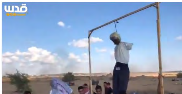
תליית בובה דמות הנשיא טראמפ והעלאתה באש במזרח ח'אן יונס (סרטון בחשבון הטוויטר QUDSN, 7 בספטמבר 2018)