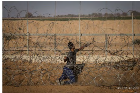
מימין: עימותים במזרח ח'אן יונס. משמאל: מהעימותים במזרח העיר עזה (דף הפייסבוק של "הרשות הלאומית העליונה של צעדת השיבה", 7 בספטמבר 2018).

◀ במספר מוקדים הבעירו המפגינים כרזות עליהן דמותו של דונאלד טראמפ נשיא ארה"ב. כמו כן תלו בובות בדמותם של בנימין נתניהו, ראש ממשלת ישראל, אביגדור ליברמן, שר הביטחון ונשיא ארה"ב דונאלד טראמפ ובמספר מקרים הבעירו אותן באש.