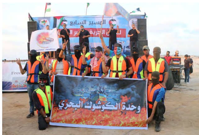
על השלט שנושאים הפעילים כתוב "יחידת הצמיגים הימיים" (דף הפייסבוק של "הרשות הלאומית העליונה של צעדת השיבה")

הוועדה הלאומית לצעדת השיבה הודיעה כי בכוונתה להרחיב את פעילויות המחאה . במסגרת זאת פרסמה הוועדה כי מעתה יתקיים באופן קבוע משט מחאה מרצועת עזה בכל יום שני. במקביל למשט תתקיימה הפגנות לאורך אזור החוף . בכל יום שלישי תתקיים הפגנה באזור מעבר ארז. לשם כך הודיעה הוועדה הלאומית, כי הוחל בהקמתו של "מחנה שיבה" חדש סמוך לזיקים שנועד עבור הפלסטינים שיגיעו להפגנות באזור מעבר ארז (דף הפייסבוק של "הרשות הלאומית העליונה של צעדת השיבה", 8 בספטמבר 2018; קדסנט, 8 בספטמבר 2018).