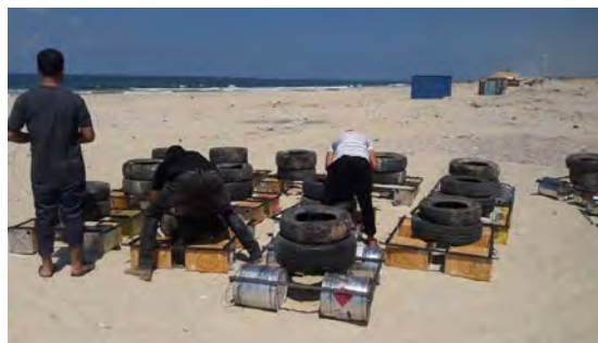
הכנת צמיגים על גבי רפסודות לשיגורם כשהם בוערים לעבר חוף ישראל (דף הפייסבוק של "הרשות הלאומית העליונה של צעדת השיבה", 10 בספטמבר 2018)