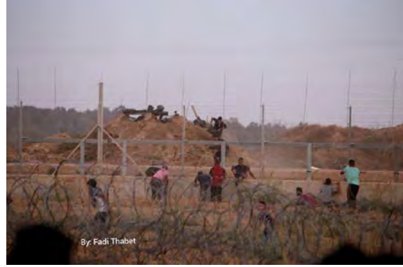
פלסטינים חוצים את גדר הביטחון מזרחית למחנה הפליטים אלברייג' וחוזרים למוצב (נטוש) של צה"ל (חשבון הטוויטר QUDSN, 7 בספטמבר 2018)