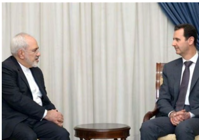
פגישת זריף - אסד בדמשק (תסנים, 3 בספטמבר 2018).

◀ שר החוץ הסורי, וליד אל-מעלם (Walid al-Muallem), אמר, כי ארצו נחושה לקדם את שיתוף הפעולה הצבאי שלה עם איראן. מעלם, שהגיע ב-30 באוגוסט 2018 לפגישה במוסקבה עם עמיתו הרוסי, סרגיי לברוב, ציין, כי איראן היא שותפה מרכזית וידידתה של סוריה וכי היועצים הצבאיים האיראנים מילאו תפקיד מכריע במערכה נגד הטרוריסטים בסוריה לצד הצבא הסורי. בהתייחסו לביקור שר ההגנה האיראני, אמיר חאתמי, בשבוע שעבר בדמשק, במהלכו נחתם הסכם לשיתוף פעולה צבאי בין שתי המדינות, אמר מעלם, כי הגיוני לחתום על הסכמים לשיתוף פעולה צבאי בין שתי המדינות על מנת לאפשר את הרחבת הקשרים ביניהן בתחום זה (אירן"א, 31 באוגוסט 2018).