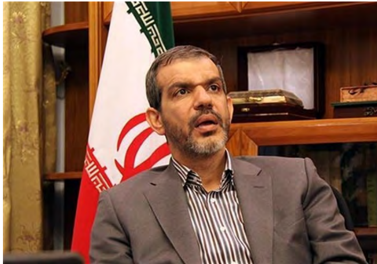
חסן דנא'י-פר, שגריר איראן לשעבר בעיראק (תסנים, 2 בספטמבר 2018).

◀ סגן הרמטכ"ל האיראני, קדיר נזאמי (Qadir Nezami), נפגש במהלך ביקורו בבגדאד לצורך כינוס הועדה הביטחונית המרובעת, עם שר ההגנה העיראקי, ערפאן אלחיאלי (Irfan al-Hayali), ודן עימו בהרחבת שיתוף הפעולה הביטחוני בין שתי המדינות. אלחיאלי אמר, כי עיראק מוכנה לממש את ההסכמים שכבר נחתמו בין בכירים צבאיים של שתי המדינות והודה לאיראן על שיתוף הפעולה שלה במערכה נגד דאעש (אירנ"א, 2 בספטמבר 2018).