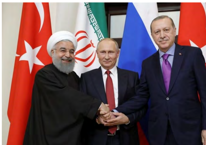
נשיאי רוסיה, איראן ותורכיה.

◀ בריאיון עיתונאי אמר שר החוץ האיראני, מחמד-ג'ואד זרִיף (Mohammad Javad Zarif), כי איראן רואה בוועידת הפסגה המשולשת הזדמנות עבור שלושת הנשיאים לקיים התייעצויות נוספות בנוגע לתהליך ההסדרה המדינית בסוריה. הוא ציין, כי מבחינתה של איראן, הפתרון למשבר בסוריה יושג באמצעות שיחות מדיניות.