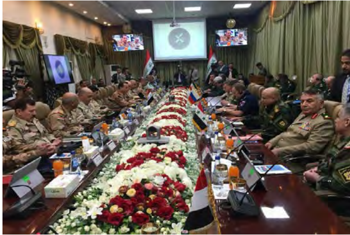
הועדה הביטחונית המרובעת (אירנ"א, 2 בספטמבר 2018).