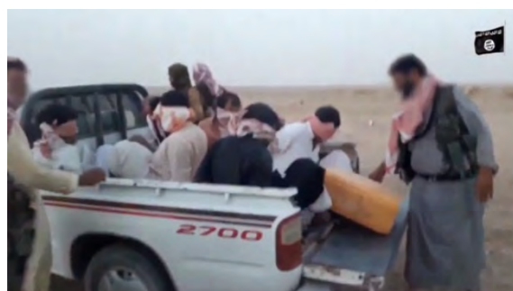
מימין: אנשי הגיוס השבטי, בני שבט שמר, מובלים ע"י פעיל דאעש למקום הוצאתם להורג. משמאל: אנשי "הגיוס השבטי", בני שבט שמר, מוצאים להורג ע"י פעילי דאעש ( https://archive.org , 31 באוגוסט 2018).