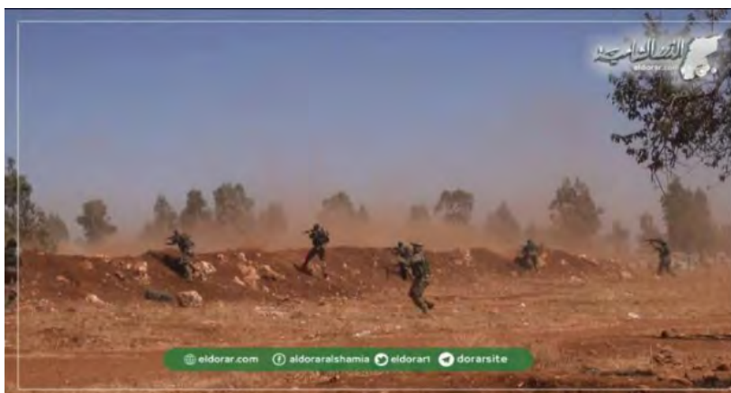
כוחות המורדים מתכוננים למערכה באדלב (אלדרר אלשאמיה, 30 באוגוסט 2018).

◀ ארגוני המורדים שבחסות המטה לשחרור אלשאם המשיכו לתגבר את אזורי החיכוך עם צבא סוריה שמצפון לחמאה וממערב לאדלב. השבוע תוגברו האזורים הללו ע"י פעילי המטה לשחרור אלשאם והמפלגה האסלאמית התורכסתאנית 4 . דווח כי הכוחות הללו סיימו לבצע עבודות ביצורים וסיימו להתוות את תוכניות הלחימה שלהם (אלדרר אלשאמיה, 30 באוגוסט 2018).