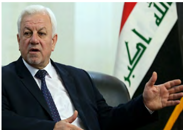
שגריר עיראק בטהראן (דפאע פרס, 21 באוגוסט 2018)