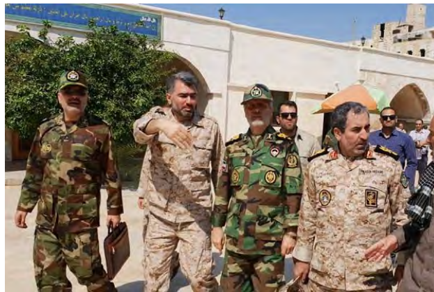
חאתמי בעיר חלב (מהר, 28 באוגוסט 2018)

◀ ב-28 באוגוסט 2018 ביקר חאתמי בליווי מפקדים בכירים בצבא הסורי בעיר חלב ותוּדַרְך בּנוּגַע לּמאַמְצִים להשלים את טיהור העיר מקבוצות הטרור שעדיין פועלות בשטחה (תסנים, 28 באוגוסט 2018).