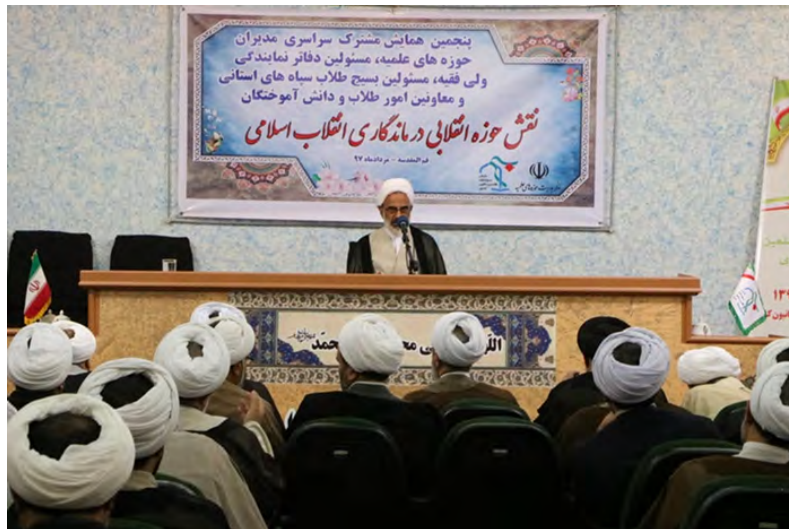
נציג המנהיג העליון במשמרות המהפכה בכנס בקום (אירנ"א, 18 באוגוסט 2018)

◀ נציג המנהיג העליון במשמרות המהפכה, חג'ת אלאסלאם עבדאללה חאג'י צאדקי (Hojjat-ul-Islam Abdollah Hajji Sadeghi), שיבח בכנס בעיר קום (Qom) את תרומתם של לוחמי החטיבה האפגאנית פאטמיון הפועלת בחסות משמרות המהפכה בסוריה ולוחמי ארגון חזבאללה הלבנוני להשבת השליטה ברוב שטחי סוריה לידי משטר אסד. הוא אמר, כי הפאטמיון וחזבאללה הם הלוחמים בשדה הקרב וכי חלליהם מחשיבים עצמם כחיילי המנהיג העליון של איראן, מה שמהווה עדות לעומק השפעתה של איראן באזור. לדברי צאדקי, המודעות להשפעה זו היא הסיבה לעצבנותו של נשיא ארה"ב, דונלד טראמפ, כלפי איראן (אירנ"א, 18 באוגוסט 2018).