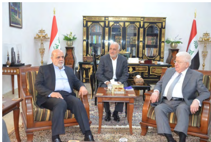
פגישת נשיא עיראק עם שגריר איראן בבגדאד (אתנח'אב, 27 באוגוסט 2018)

◀ אמיר עבדאללהיאן (Amir Abdollahian), יועצו המיוחד של יו"ר המג'לס לעניינים בינלאומיים, נפגש ב-26 באוגוסט 2018 עם קבוצת חברי פרלמנט עיראקים חברי רשימת אלפתח המזוהה עם המיליציות השיעיות הפרו-איראניות, שנבחרו לאחרונה בבחירות הכלליות שנערכו במדינה. הוא ציין, כי יש לשמר את עצמאותה, אחדותה הלאומית ושלמותה הטריטוריאלית של עיראק, שהושגו בשנות המערכה נגד הכיבוש הזר בעיראק ונגד הטרור של דאעש. עבדאללהיאן הצביע על מעמדה הפוליטי והכלכלי המרכזי של עיראק וציין, כי לחזרתה למעמדה הטבעי והחשוב באזור תפקיד חשוב בהבטחת היציבות והביטחון באזור (מהר, 26 באוגוסט 2018).