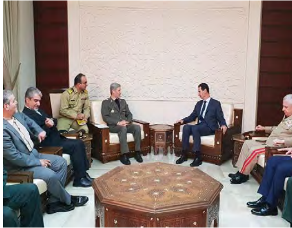
פגישת חאתמי עם הנשיא אסד (תסנים, 26 באוגוסט 2018)

◀ ב-28 באוגוסט 2018 ביקר חאתמי בליווי מפקדים בכירים בצבא הסורי בעיר חלב ותוּדַרְך בּנוּגַע לּמאַמְצִים להשלים את טיהור העיר מקבוצות הטרור שעדיין פועלות בשטחה (תסנים, 28 באוגוסט 2018).