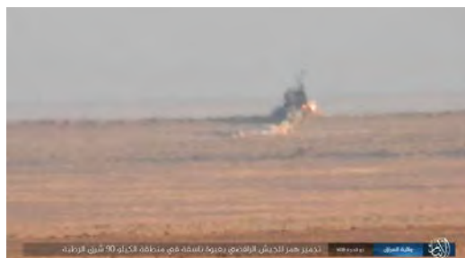
פיצוץ מטען חבלה של דאעש, שהביא להשמדת רכב של צבא עיראק ממזרח לאלרטבה. www.k1falh.ga , אתר המזוהה עם דאעש, 16 באוגוסט 2018.

◀ עיקרי הפעולות שעליהן דיווח דאעש : השמדת כלי רכב שהסיע את אנשי המשטרה הפדרלית, 37 ק"מ ממערב לכרכוב ; פיצוץ שני מטעני חבלה כתשעה ק"מ ממערב לבגדאד (כ-15 שיעים נהרגו ונפצעו); פיצוץ מטען חבלה נגד אוטובוס בצפון בגדאד (עשרה אנשי "הגיוס העממי" נהרגו ונפצעו); פיצוץ מטען חבלה נגד ריכוז שיעים בצפון מזרח בגדאד (שבעה הרוגים ופצועים); פיצוץ מטען חבלה נגד כלי רכב של צבא עיראק, כתשעים ק"מ ממזרח לאלרטבה ; פיצוץ כלי רכב של המשטרה הפדרלית כ-26 ק"מ מדרום לכרכוב ; פיצוץ שני מטעני חבלה נגד כלי רכב של כוחות ההתערבות המהירה כ-67 ק"מ מצפון לבעקובה ; פיצוץ מטען כלי רכב של "הגיוס העממי", כ-34 ק"מ מצפון מזרח לבעקובה ; הפעלת מטען חבלה נגד כלי רכב של "הגיוס העממי", כ-45 ק"מ מדרום מערב לכרכוב (חמישה הרוגים).