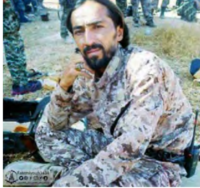
המפקד בחטיבת אלפאטמיון, שנהרג בידי דאעש במרחב הכפרי של אלבוכמאל (חשבון הטוויטר האינדונזי @BIGsarmad, 16 באוגוסט 2018).