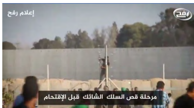
תמונה מסרטון המתעד חיתוך גדר הביטחון לפני החדירה לעמדת צלפים של צה"ל (דף הפייסבוק של "הרשות הלאומית העליונה של צעדת השיבה", 3 באוגוסט 2018)

במהלך האירועים הופגנה אלימות רבה מצד הנוכחים אשר ניסו לחבל במתקנים ביטחוניים לאורך הגדר. בכמה מקרים היו עימותים אלימים עם כוחות צה"ל שיאם של האירועים היה כאשר מספר פלסטינים חצו את גדר הביטחון בדרום רצועת עזה. הם השליכו סמוך לגדר מטען ובקבוקי תבערה ולאחר מכן שבו לרצועת עזה (דובר צה"ל, 3 באוגוסט 2018). התקשורת הפלסטינית דיווחה על מספר פלסטינים, שחצו את הגדר, והצליחו להיכנס למוצב צה"ל. על פי הדיווחים חלק מהמפגינים שחצו את הגדר חזרו לרצועת עזה כשברשותם ציוד של צה"ל (דניאל אלטון שהאב, 3 באוגוסט 2018).