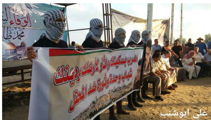
כרזה שהונפה במזרח העיר עזה המעודדת ביצוע פיגועי דקירה. על הכרזה נכתב: פגע באמצעות סכינך, ונקום את נקמת אדמתך ודתך. צעירים, אחדות ומהפכה נגד הכובש (דף הפייסבוק של "הרשות הלאומית העליונה של צעדת השיבה", 4 באוגוסט 2018)