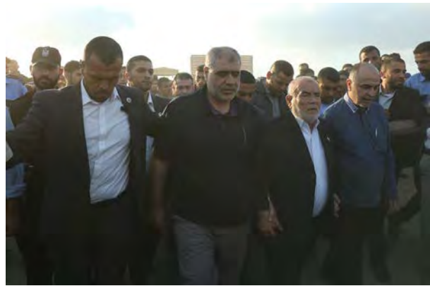
בכירי חמאס ב"צעדת השיבה". מימין: סגן יו"ר המועצה המחוקקת ובכיר חמאס, אחמד בחר, וחבר הלשכה המדינית של חמאס, מחמד נצר, שהגיע עם משלחת חמאס מ"החוף" במחנה השיבה במזרח ג'באליא (דף הפייסבוק של המועצה המחוקקת ברצועה, 3 באוגוסט 2018)