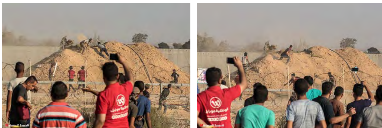
פלסטינים שחדרו לעמדת צלפים של צה"ל במזרח רפיח לוקחים ציוד מהעמדה (דף הפייסבוק של "הרשות הלאומית העליונה של צעדת השיבה", 3 באוגוסט 2018)

◀ בתגובה לחדירה תקף טנק של צה"ל עמדה של חמאס (דובר צה"ל, 3 באוגוסט 2018). התקשורת הפלסטינית דיווחה כי כוחות צה"ל תקפו עמדת תצפית של "מגני הספר" במזרח רפיח וכי לא היו נפגעים (חשבון הטוויטר אמאמה, 3 באוגוסט 2018).