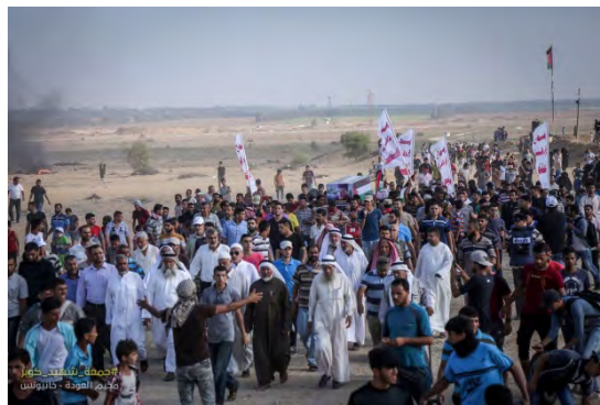
הלוויה סמלית למחבל, שביצע פיגוע דקירה קטלני ביישוב אדם, במסגרת אירועי צעדת יום שישי (דף הפייסבוק של "הרשות הלאומית העליונה של צעדת השיבה", 3 באוגוסט 2018)