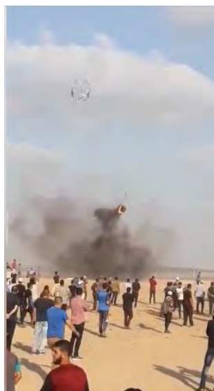
הפרחת עפיפון אליו נקשר צמיג בוער במזרח העיר עזה (דף הפייסבוק של "הרשות הלאומית העליונה של צעדת השיבה", 3 ו-5 באוגוסט 2018)