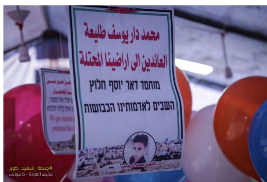
הפרחת בלונים במרכז הרצועה אליהם הוצמדו תמונות אסירים והרוגים פלסטינים ומסרים שונים לישראל (דף הפייסבוק של "הרשות הלאומית העליונה של צעדת השיבה", 3 באוגוסט 2018)