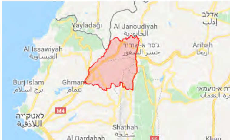
Zone montagneuse kurde (en route) visitée par al-Julani

effectué des visites sur les lignes d'affrontement avec les milices sous contrôle iranien dans les environs d'Alep et Hama (Abba, 21 août 2018).