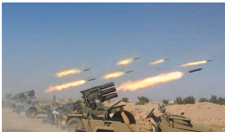
Tirs de roquettes de l'armée syrienne sur les concentrations de force et les lignes de défense du Siège de Libération d'Al-Sham au Sud-Est d'Idlib (Butulat al-Jash al-Suri, 16 août 2018)