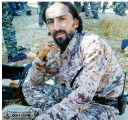
Le commandant de la brigade d'Al-Fatimiyn tué par l'Etat islamique dans la zone rurale d'Abu Kamal (Compte Twitter indonésien Sermad Forever @BIGsarmad, 16 août 2018)

considérée comme vitale par les Iraniens, à travers laquelle passe la route de l'approvisionnement terrestre entre l'Irak et la Syrie.