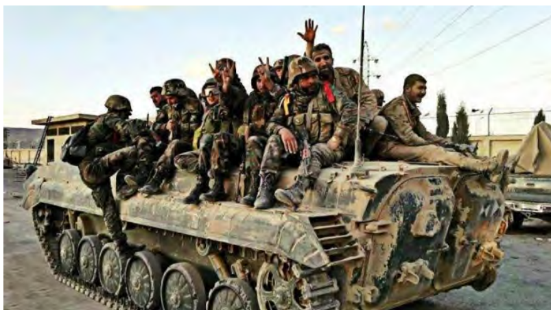
Renforts de l'armée syrienne vers Idlib (Muraselen, 18 août 2018)

► L'armée syrienne a continué à renforcer les différents fronts qui bordent Idlib. Selon les médias syriens, des caravanes ont été vues sur les routes entre Hama et Idlib et sur les routes menant à la zone rurale de Lattaquié. De plus, des renforts sont arrivés à l'aéroport militaire de Hama. Selon une source militaire syrienne, au vu de l'échec simultané, les forces blindées turques ont été transférées dans la zone frontalière turque avec le district d'Idlib (Al-Arabiya al-Hadith, 19 août 2018).