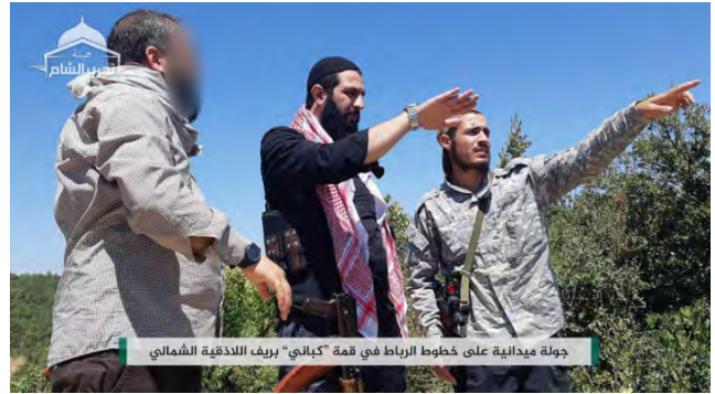
Gauche : Abu Muhammad al-Julani (au Centre en noir), commandant du Siège de Libération d'Al-Sham, lors d'une tournée des lignes de défense de l'organisation dans la région kurde (Nord-de Lattaquié). Gauche : Membre du Siège de Libération d'Al-Sham renforçant une position de l'organisation (Abba, 21 août 2018)