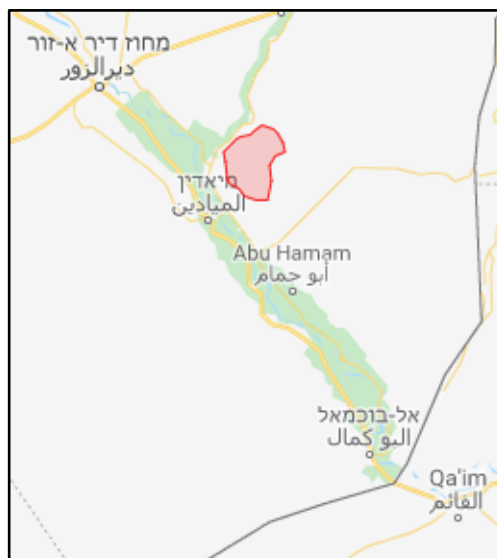
Le champ de pétrole d'Al-Amar, près d'Al-Muyadeen (en rouge)

► Dans la nuit du 17 au 18 août 2018, des activistes de l'Etat islamique ont attaqué un complexe résidentiel des forces de la coalition internationale à la base du champ pétrolifère d'al-Amar, à environ 17 kilomètres au Nord d'Al-Mayadeen, où se trouvaient des membres des FDS (Liban 24, 18 août 2018). L'organisation a d'abord fait exploser une voiture piégé à proximité du complexe. Les forces de la coalition ont mené des attaques qui ont entraîné la mort de plusieurs membres de l'Etat islamique (Dir al-Zawar 24, 19 août 2018).