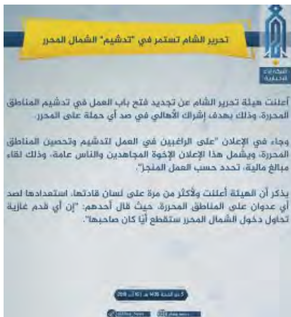
Annnonce du Siège de Libération d'Al-Sham appelant ses membres à travailler pour aider à fortifier la région d'Idlib (Abba, 16 août 2018)

► Dans le cadre des préparatifs de la bataille pour la région d'Idlib, le Siège de Libération d'Al-Sham renforce les zones sous son contrôle . Le 6 août 2018, l'organisation a publié un tract dans lequel elle offrait un travail rémunéré aux militants et aux citoyens qui aideraient à renforcer le "Nord libéré" (région d'Idlib) pour empêcher toute attaque (Abba, 16 août 2018).