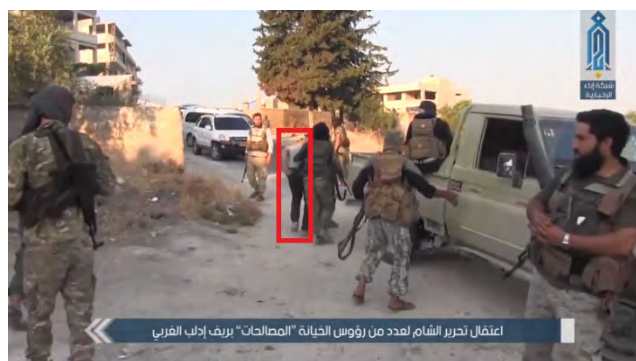
Droite : Membres du Siège de Libération d'Al-Sham lors de l'arrestation d'un des principaux défenseurs des accords de réconciliation. Gauche : L'un des principaux défenseurs des arrangements de réconciliation arrêté par des membres du Siège de Libération d'Al-Sham, après son arrestation (Abba, 20 août 2018)

► Selon nous, les arrestations et les exécutions, à la veille de l'attaque prévue par les forces syriennes, visaient à consolider le statut du Siège de Libération d'Al-Sham dans l'enclave d'Idlib . Il nous semble que les arrestations se font principalement parmi les militants appartenant aux organisations rebelles, de peur qu'ils préfèrent accepter les accords de réconciliation (à savoir les accords de capitulation), comme cela s'est passé dans le Sud de la Syrie. L'arrestation de partisans des arrangements de réconciliation pourrait également être une réponse aux tracts diffusés par l'armée syrienne dans la région d'Idlib, exhortant les résidents à adhérer rapidement aux accords de réconciliation .