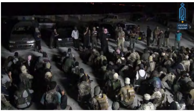
Droite : Briefing des membres du Siège de Libération d'Al-Sham avant leur départ pour les arrestations. Gauche : Un convoi de membres du Siège de Libération d'Al-Sham en route pour procéder aux arrestations (Aba, 20 août 2018)