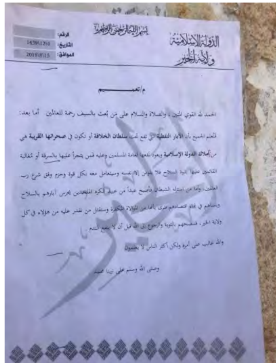
Le tract distribué par la Province de Dakhir de l'Etat islamique, qui menace de tuer quiconque garde les puits de pétrole et de punir sévèrement ceux qui volent le pétrole (Compte Twitter de Dir Al-Zawar 24 [Dirazur 24], 20 août 2018)