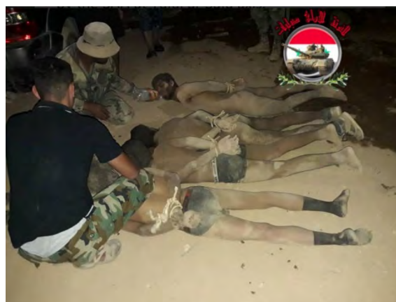
Droite : Membres de l'Etat islamique capturés par l'armée syrienne dans la région d'al-Safafa (Compte Twitter @ Bosni94, 18 août 2018). Gauche : Char de l'armée syrienne dans l'enclave d'Al-Suwayda (Sana, 19 août 2018)