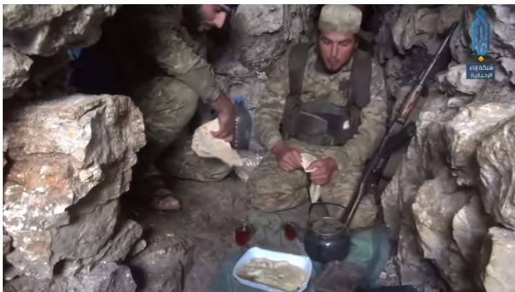
Membres du Siège de Libération d'al-Sham en position sur la montagne surplombant l'axe Kubani, dans la région kurde (Abba, 21 août 2018)