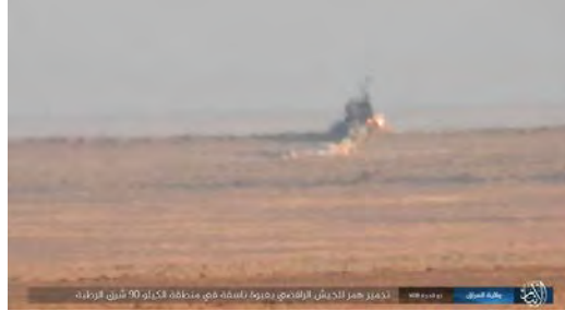
تفجير عبوة ناسفة لتنظيم الدولة الإسلامية أدى إلى تدمير سيارة للجيش العراقي إلى الشرق من الرطبة. www.k1falh.ga ، موقع موالي لتنظيم الدولة الإسلامية، 16 آب/ أغسطس 2018).

◀ أهم العمليات التي أفاد عنها تنظيم الدولة الإسلامية: تدمير سيارة كان يسافر فيها أفراد من الشرطة الاتحادية على مبعده ما يقارب 37 كلم إلى الغرب من كركوك؛ تفجير عبوتين ناسفتين على مبعده ما يقارب تسعة كيلومترات إلى الغرب من بغداد (أسفر عن مقتل وجرح حوالي 15 شيعياً)؛ تفجير عبوة ناسفة استهدفت حافلة في شمال بغداد (أسفر عن مقتل وجرح عشرة أشخاص من "الحشد الشعبي")؛ تفجير عبوة ناسفة استهدفت حشداً من الشيعة في شمال شرق بغداد (أسفر عن سبعة قتلى وجرحى)؛ تفجير عبوة ناسفة استهدفت سيارة للجيش العراقي، على مبعده ما يقارب تسعون كيلومتراً إلى الشرق من الرطبة؛ تفجير سيارة للشرطة الاتحادية على مبعده ما يقارب 29 كلم إلى الجنوب من كركوك؛ تفجير عبوتين ناسفتين استهدفتا سيارات لقوات التدخل السريع على مبعده ما يقارب 67 كلم إلى الشمال من بعقوبة؛ تفجير عبوة ناسفة استهدفت سيارة "الحشد الشعبي" على مبعده ما يقارب 34 كيلومتراً إلى الشمال الشرقي من بعقوبة؛ تفجير عبوة ناسفة استهدفت سيارة "الحشد الشعبي" على مبعده حوالي 45 كلم إلى الجنوب الغربي من كركوك (أسفر عن سقوط خمسة قتلى).