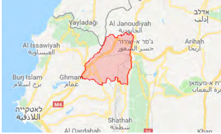
منطقة جبل الأكراد (باللون الأحمر) التي زار فيها أبو محمد الجولاني قواته على خطوط الجبهة (Google Maps).