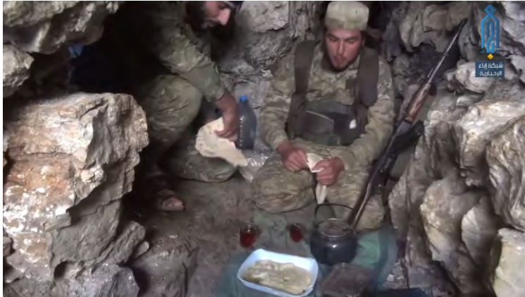
عناصر هيئة تحرير الشام داخل موقع في جبل يطل على محور كباني في منطقة جبل الأكراد (إبء، 21 آب/ أغسطس 2018).