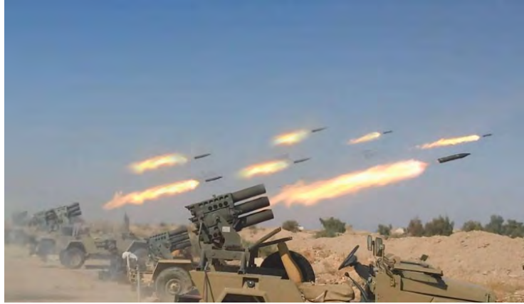
الجيش السوري يقصف بالقذائف الصاروخية حشود قوات وخطوط دفاعية لهيئة تحرير الشام إلى الجنوب الشرقي من إدلب (بطولات الجيش السوري، 16 آب/ أغسطس 2018).

في سياق الاستعدادات لبداية المعركة، يقوم الجيش السوري بشن هجمات محلية وقصف مدفعي على مواقع تنظيمات المتمردين في محيط إدلب من خلال التركيز على مواقع هيئة تحرير الشام. وجاء في الأنباء أن الجيش السوري يهاجم "مرتزقة أجانب" تسللوا من تركيا، وهم قسم لا يستهان به من عناصر هيئة تحرير الشام المنتشرين في أرياف حماة وإدلب (سانا، 18 آب/ أغسطس 2018).