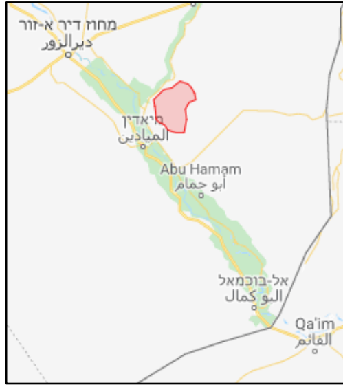
القسم المركزي من حقل العمر النفطي قرب الميادين (باللون الأحمر).

◀ في ليلة 17-18 آب/ أغسطس 2018 هاجم عناصر تنظيم الدولة الإسلامية مساكن جنود التحالف الدولي في قاعدة تقع في حقل العمر النفطي، على مبعده ما يقارب 17 كلم إلى الشمال الشرقي من الميادين. ويتواجد في تلك القاعدة أيضاً عناصر من قوات سوريا الديمقراطية (SDF) (لبنان 24، 18 آب/ أغسطس 2018). في المرحلة الأولى من الهجوم فجر تنظيم الدولة الإسلامية سيارة مفخخة بهدف شق الطريق والتقدم نحو المساكن. وتعرقل الهجوم بسبب تدخل طائرات لقوات التحالف، حيث قامت بضربات أدت إلى مقتل عدد من عناصر تنظيم الدولة الإسلامية. ومن ثم قام تنظيم الدولة الإسلامية بتنفيذ هجومين آخرين بالتزامن معاً واشتبك مع مقاتلي قوات سوريا الديمقراطية (SDF) (دير الزور 24، 19 آب/ أغسطس 2018).