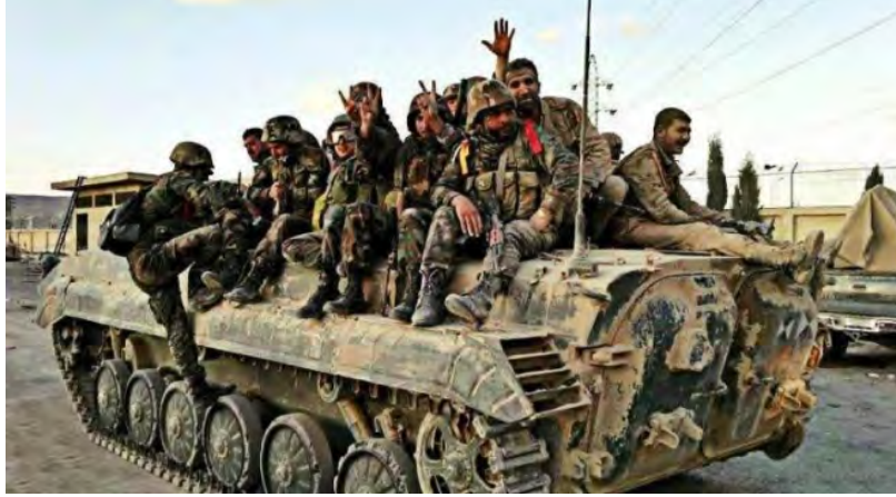
تعزيزات الجيش السوري في طريقها إلى جبهة إدلب (مراسلون، 18 آب/ أغسطس 2018).