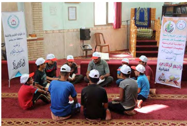
שינון הקוראן במחנה קיץ במחנה הפליטים ח'אן יונס בשיתוף פעולה עם אגודת דאר אלקוראן ואלסונה (דף הפייסבוק של ועדת מחנות הקיץ בח'אן יונס, 16 ביולי 2018).