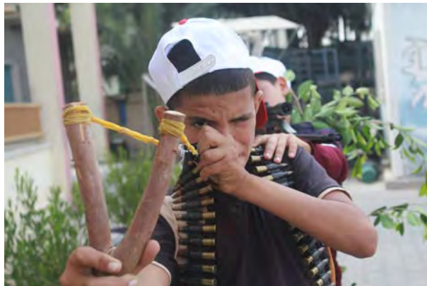
אימונים במחנה הקיץ באזור מען/סניף אבו עבידה בח'אן יונס בשימוש בקלע דוד לשיפור יכולות יידוי אבנים (דף הפייסבוק של ועדת מחנות הקיץ באזור מען, 15 ביולי 2018).