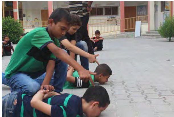
אימון בחטיפת אזרחים ישראלים והשתלטות עליהם (דף הפייסבוק של ועדת מחנות הקיץ באזור מען, 14 ו-15 ביולי 2018).