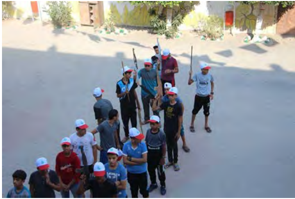
אימונים בנשק במחנה קיץ של חמאס בשכונת אלאמל, במחנה הפליטים ח'אן יונס (דף הפייסבוק של ועדת מחנות הקיץ בח'אן יונס, 17 ביולי 2018).