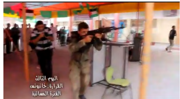
תחילת תנועה לקראת הסתערות על "עמדת צה"ל" (דף הפייסבוק של ועדת מחנות הקיץ בח'אן יונס, 17 ביולי 2018).