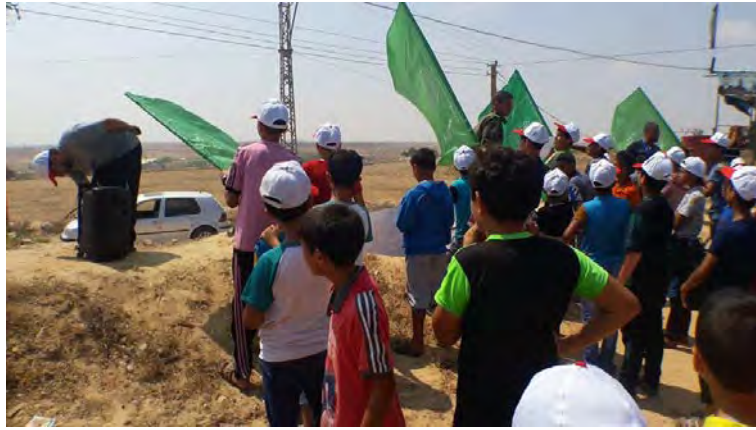
ילדי מחנה הקיץ בעיירה קרארה עורכים סיור סמוך לגדר הביטחון במזרח ח'אן יונס (דף הפייסבוק של ועדת מחנות הקיץ בח'אן יונס, 17 ביולי 2018).