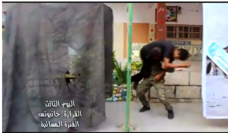
חטיפת חייל צה"ל מהעמדה (דף הפייסבוק של ועדת מחנות הקיץ בח'אן יונס, 17 ביולי 2018).