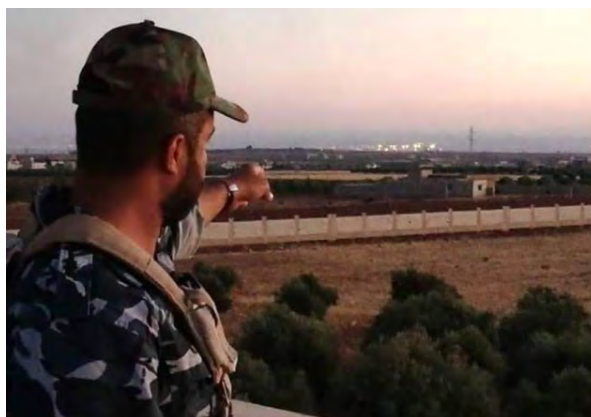
חייל סורי משקיף לעבר מעבר אלנציב (רשת ההסברה הצבאית המרכזית, 1 ביולי 2018).