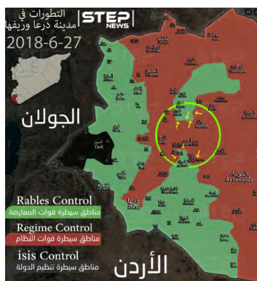
מימין: ביתור המובלעת של המורדים באזור בצר אלחריר ובעקבות זאת המשך ההתקפות לכיוון צפון ודרום (ח'טוה, 27 ביוני 2018). משמאל: התקפות צבא סוריה על חלקה הדרומי של מובלעת המורדים המזרחית והתקפות מקומיות מצפון מערב לדרעא לכיוון מערב (ח'טוה, 30 ביוני 2018).