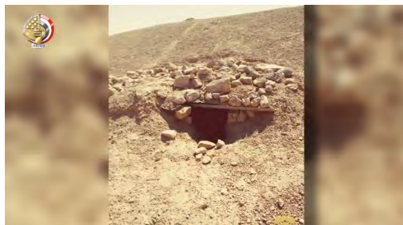
מימין: מקום מסתור של "פעילי טרור". משמאל: אמצעי לחימה שנתפסו על-ידי כוחות הביטחון המצרים (דף הפייסבוק הרשמי של דובר צבא מצרים, 3 ביולי 2018).