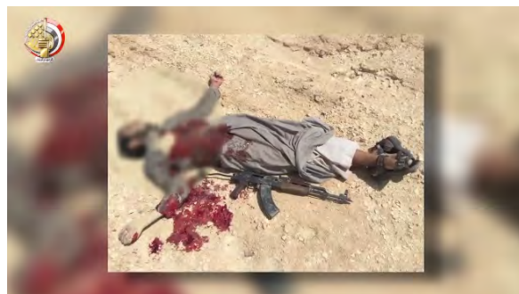
מימין: גופתו של "פעיל טרור", שנהרג בסיני. משמאל: מנהרה שאותרה והושמדה על-ידי כוחות הביטחון המצרים ברפיח (דף הפייסבוק הרשמי של דובר צבא מצרים, 3 ביולי 2018).