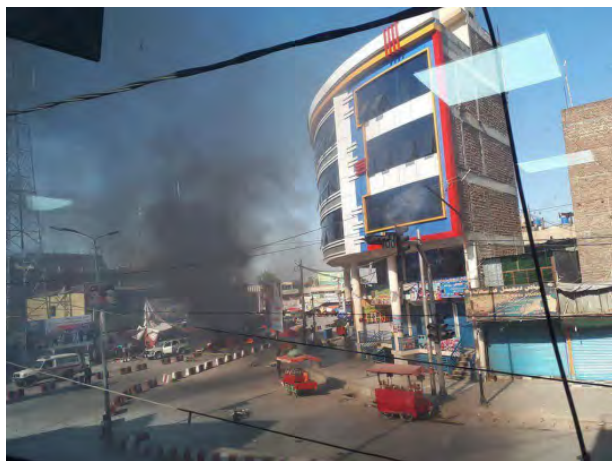
זירת פיגוע ההתאבדות של דאעש במרכז ג'לאלאבאד (חשבון הטוויטר @Khabarnama@khabarnamaaf, אתר תקשורת אפגני, 2 ביולי 2018).

◀ ב-1 ביולי ביצע מחבל מתאבד פיגוע התאבדות בג'לאלאבאד. בפיגוע נהרגו 17 הנדים וסיקים ושני אנשי ביטחון (ח'אאמה פרס, 1 ביולי 2018). דאעש נטל אחריות לפיגוע. בהודעה מטעמו נמסר, כי מחבל מתאבד חדר לתוך ריכוז של חיילי צבא אפגניסטאן, הנדים וסיקים, במרכז העיר ג'לאלאבאד ופוצץ אפוד נפץ שנשא על גופו. כתוצאה מכך לטענת דאעש, נהרגו למעלה מ-40 אנשים, בהם מועמד לפרלמנט האפגני ( www.k1falh.ga , אתר המזוהה עם דאעש, 1 ביולי 2018).