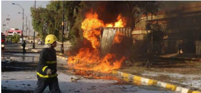
זירת פיצוץ מכונית התופת בדרום כרכוכ (אלנג' באא', 1 ביולי 2018).

אך סביר להניח שמדובר בארגון זה. במתחם המחסנים היו פתקי קלפיות , שהיו מיועדים לספירה ידנית חוזרת בעקבות טענות לזיופים בבחירות לפרלמנט (סקאי ניוז, 1 ביולי 2018). לפיכך נראה שהפיגוע נועד לערער את המערכת השלטונית העיראקית , בהמשך לניסיונות דאעש (שלא צלחו) לשבש את הבחירות.