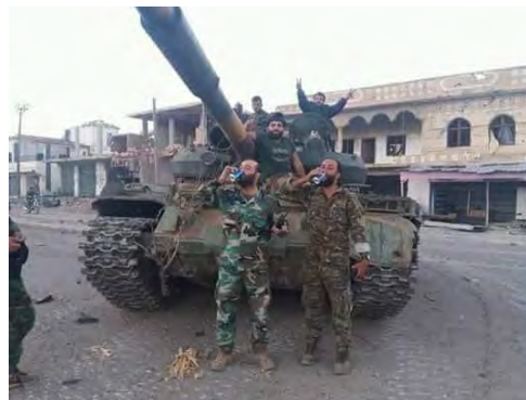
מימין: לוחמים של צבא סוריה מחטיבת ד'ו אלפקאר בתמונת ניצחון בבצר אלחריר. משמאל: לוחמים של צבא סוריה ושל חטיבת ד'ו אלפקאר באזור בצר אלחריר (עמוד הפייסבוק של חטיבת ד'ו אלפקאר, 26 ביוני 2018).

חטיבת ד'ו אלפקאר הינה מסגרת צבאית עיראקית-שיעית המופעלת ע"י האיראנים. היא הוקמה ביוני 2013 על מנת לסייע לחטיבה שיעית-עיראקית נוספת, חטיבת אבו פצ'ל אלעבאס בהגנה על מתחם הקבר הקדוש של אלסת זינב, שמדרום לדמשק 6 (ראו להלן). החטיבה מורכבת בעיקר מפעילים עיראקים, שפעלו בעבר במיליציות שיעיות עיראקיות המופעלות ע"י איראן 7 .