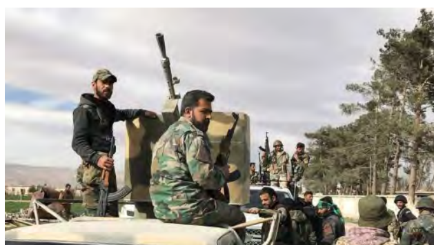
מימין: פעילות חיילי צבא סוריה במרחב דרעא (בטולאת אלג'יש אלסורי, 28 ביוני 2018). משמאל: פעילות חיילי צבא סוריה מצפון לדרעא (ההסברה הקרבית של חזבאללה, 29 ביוני 2018).