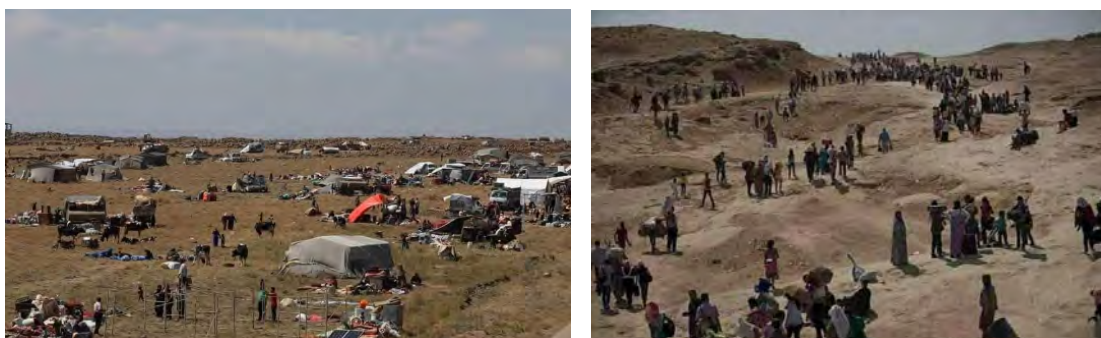
מימין: עקורים נמלטים מכפריהם במרחב דרעא (אורינט ניוז, 30 ביוני 2018). משמאל: מחנה עקורים במרחב דרעא (אקתצאד, אתר כלכלי סורי, 1 ביולי 2018).

◀ לפי נתוני האו"ם, העדכניים ל-2 ביולי 2018, כ-270,000 אנשים נעקרו מבתיהם מאז תחילת המערכה בדרום סוריה (אתר האו"ם, 2 ביולי 2018). בתקשורת הסורית דווח, כי כ-86,000 עקורים נמלטו לרמת הגולן, כ-30,000 מהם מצויים מדרום לעיירה רפיד וסמוך לנקודת האו"ם שבקרבת קניטרה, שבמרכז רמת הגולן (אקתצאד, אתר כלכלי סורי, 1 ביולי 2018). העקורים, סובלים ממצוקה הומניטארית קשה. ישראל העניקה סיוע הומניטארי (מזון, טיפול רפואי) למאות עקורים, שהגיעו קרוב לגבולה עם סוריה, אך הודיעה כי לא תאפשר להם לעבור לשטחה. ירדן מגישה לעקורים סיוע בתחום ההומניטארי (סיוע רפואי) אך גם היא הודיעה שהיא לא תקלוט יותר פליטים סורים בשטחה.