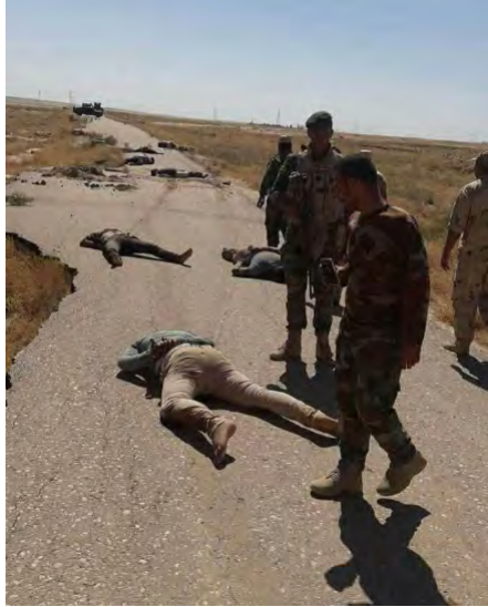
عناصر الأمن العراقيين قرب جثامين المخطوفين الذين أعدمهم تنظيم الدولة الإسلامية على شارع ديالى- كركوك (BasNews، 27 حزيران/ يونيو 2018).

◀ تبين بخلاف التقارير السابقة بأن تنظيم الدولة الإسلامية قد أعدم المخطوفين الستة الذين اختطفهم عناصر التنظيم على شارع صالح - كركوك ولم يفرج عنهم 8 . في 27 حزيران/ يونيو 2018 أفادت التقارير عن العثور على جثامين ثمانية من المخطوفين على شارع ديالى- كركوك (السومرية نيوز، 27 حزيران/ يونيو 2018). وعرض التقرير صوراً يظهر فيها عناصر من قوات الأمن العراقية قرب جثامين المخطوفين (BasNews، 27 حزيران/ يونيو 2018).