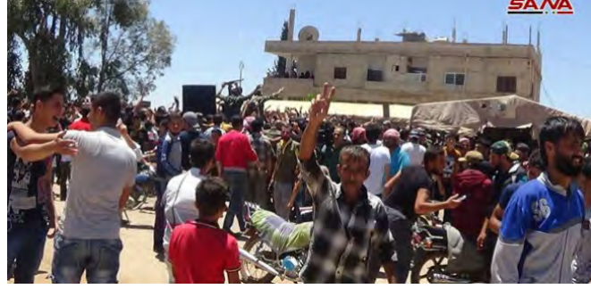
على اليمين: سكان بلدة ابطع إلى الشمال من درعا يرحبون بدخول الجيش السوري ويرفعون صورة الرئيس السوري بشار الأسد (سانا، 29 حزيران/ يونيو 2018).