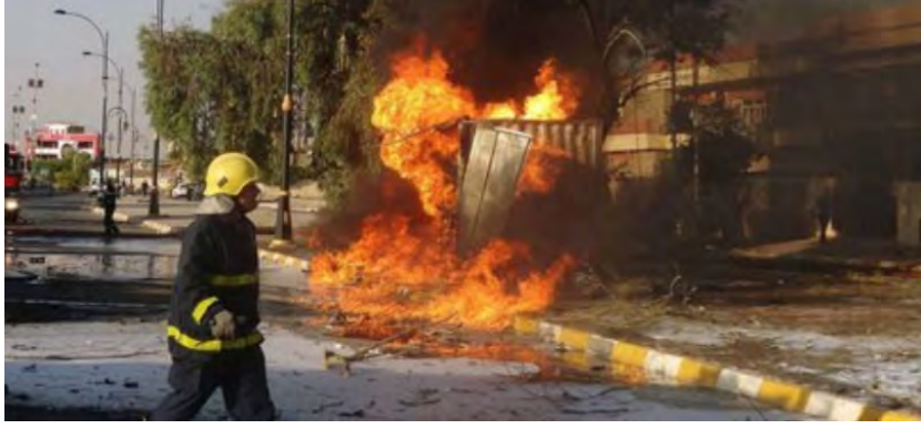
مسرح عملية تفجير السيارة الملغمة في جنوب كركوك (النجباء، 1 تموز/ يوليو 2018).