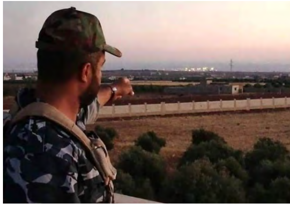
سوري يطل على معبر النصيب (شبكة الإعلام الحربي السوري، 1 تموز/ يوليو 2018).

بعد تقطيع مقاطعة المتمردين إلى الشمال الشرقي من درعا في منطقة بصر الحرير، أطلق الجيش السوري والقوات المساندة له عملية منسقة باتجاه الجنوب (التحرك الأساسي) وباتجاه الشمال (التحرك الثانوي). وتستعين القوات الزاحفة بغطاء جوي روسي وسوري. يبدو أن القوات السورية قد سيطرت على معظم الجزء الشمالي من المقاطعة الشرقية. يبدو أن القوات السورية قد سيطرت على معظم الجزء الشمالي من المقاطعة الشرقية. وبتقديرنا فإن الغاية التنفيذية المركزية لقوات الجيش السوري المتقدمة من الشمال إلى الجنوب على امتداد الشارع الرئيسي (M-5) هو معبر النصيب على الحدود السورية-الأردنية. وأعلنت وحدة الإعلام في الجيش السوري أن الجيش السوري بات على مبعده حوالي 7 كلم عن معبر النصيب (شبكة الإعلام الحربي السوري، 1 تموز/ يوليو 2018). لكن يبدو أن هناك قتال محلي في الجزء الشمالي من المقاطعة بين الجيش السوري وبين تنظيمات المتمردين ولم يكتمل احتلال المقاطعة بعد.