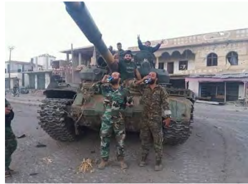
على اليمين: مقاتلون من الجيش السوري من لواء ذو الفقار في صورة نصر في بصر الحرير. على اليسار: مقاتلون من الجيش السوري ومن لواء ذو الفقار في منطقة بصر الحرير (صفحة فيسبوك لواء ذو الفقار، 26 حزيران/ يونيو 2018).