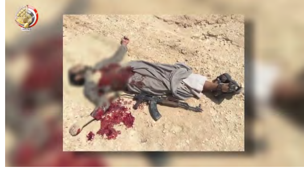
على اليمين: جثة " إرهابي" تم قتله في سيناء. على اليسار: نفق عثرت عليه قوات الأمن المصرية وفجرتة في رفح (صفحة فيسبوك الرسمية للناطق عن الجيش المصري، 3 تموز/ يوليو 2018).