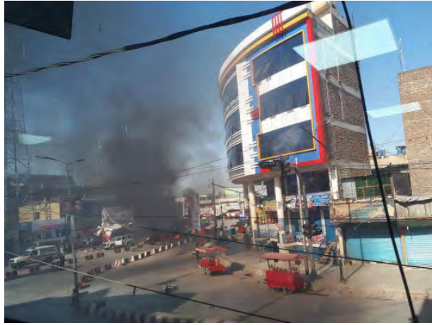
مسرح العملية الانتحارية التي نفذها تنظيم الدولة الإسلامية في وسط جلال اباد (حساب تويتر Khabarnama@khabarnamaaf، موقع إعلامي أفغاني، 2 تموز/ يوليو 2018).

◀ في 1 تموز/ يوليو نفذ إرهابي انتحاري عملية انتحارية في جلال اباد. أسفرت العملية عن مقتل 17 هندياً وسيخ وعصرين من قوات الأمن (خاتمة برس، 1 تموز/ يوليو 2018). تبني تنظيم الدولة الإسلامية المسؤولية عن العملية. وجاء في بيان أصدره التنظيم أن إرهابياً انتحارياً اندس داخل حشد من من جنود الجيش الأفغاني وهنود وسيخ في مركز مدينة جلال اباد وفجر سترة ناسفة كان يرتديها. ما أدى على حسب مزاعمه إلى مقتل أكثر من 40 شخصاً، ومنهم أحد المرشحين للبرلمان الأفغاني (www.k1falh.ga، موقع موالى لتنظيم الدولة الإسلامية، 1 تموز/ يوليو 2018).