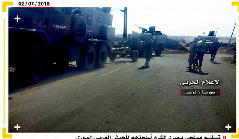
|| تسليم مسلحي بصرى الشام أسلحتهم للجيش العربي السوري

عناصر من تنظيمات المتمردين في بصرى الشام يسلمون أسلحتهم للجيش السوري (شبكة الإعلام المركزي، 2 تموز/ يوليو 2018).