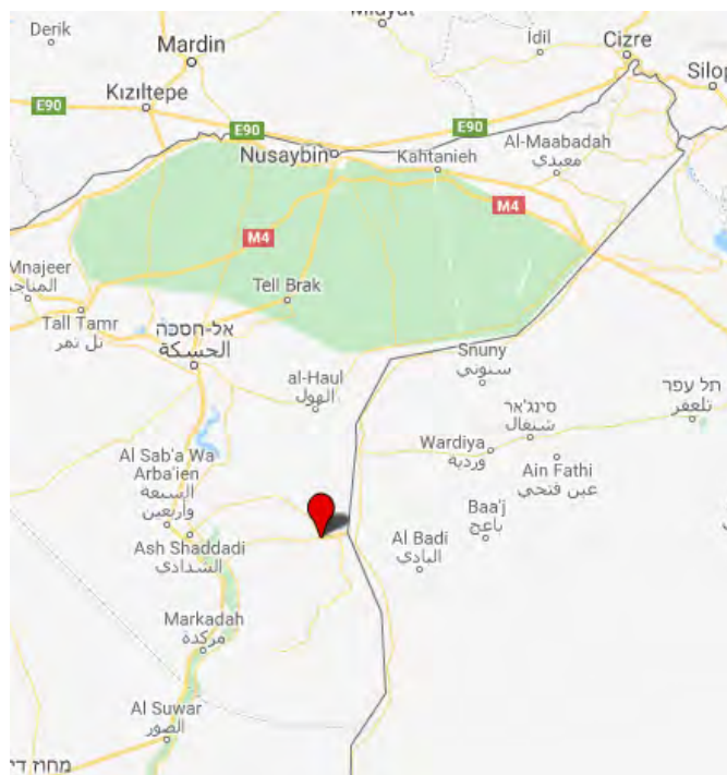
Село Аль Дашиша, опорный пункт организации ИГИЛ, которое было захвачено силами группировки SDF

17-го июня 2018 г. силы курдской группировки SDF захватили село Аль Дашиша, основной опорный пункт организации ИГИЛ на пространстве, лежащем к югу от г. Аль Хаска. Поступали сообщения о том, что организация ИГИЛ потеряла не менее 30 человек убитыми , а также, что ее боевики отступили и из еще нескольких деревень, находящихся поблизости от этого села (сирийский наблюдательный центр по защите прав человека, 17 июня 2018 г.). Захват этого села является важным достижением для сил группировки SDF, а также важным шагом в процессе зачистки пространства, лежащего к югу от г. Аль Хаска, от присутствия организации ИГИЛ, и в укреплении курдского контроля к востоку от реки Евфрат.