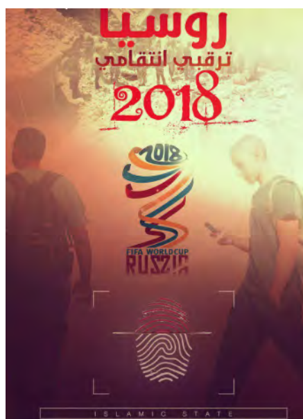
Листовка организации ИГИЛ с угрозами в адрес чемпионата мира по футболу, который проводится в России: "Россия 2018 – жди моей мести" (приложение "Телеграм", 16 июня 2018 г.)

► В ходе последних дней организация ИГИЛ усилила свою деятельность по подстрекательству к совершению терактов на территории России "одинокими волками". В ходе проведения чемпионата мира по футболу , 16-го июня 2018 г., в мобильном приложении "Телеграм" была опубликована листовка, в которой размещена надпись на арабском языке "Россия 2018 – жди моей мести" . На заднем плане изображены разрушенные строения в Сирии, которые были подвергнуты бомбардировкам по решению российских властей, а также 2 боевиков с рюкзаками за спиной (намек на террористов, отправляющихся на совершение теракта). В нижней части листовки помещено изображение отпечатка пальца, а под ним – надпись на английском языке "исламское государство" (приложение "Телеграм", 16 июня 2018 г.).