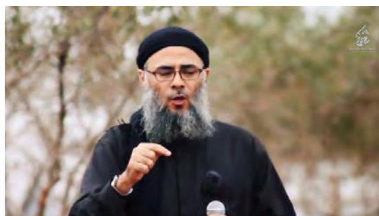
Справа: шейх Сами Аль Ариди, высший религиозный авторитет в "Организации хранителей религии", входящей в структуру организации "Аль Кайда". Слева: боевики "Организации хранителей религии" выдвигаются для совершения нападения на подразделение сирийской армии (Ютуб, 16 июня 2018 г.)