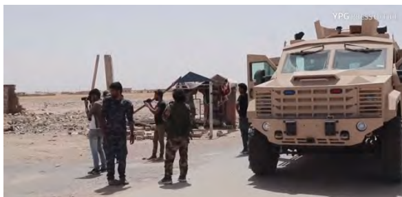
Справа: силы группировки SDF в селе Аль Дашиша. Слева: село Аль Дашиша. (YPG PRESS OFFICE, 17 июня 2018 г.)