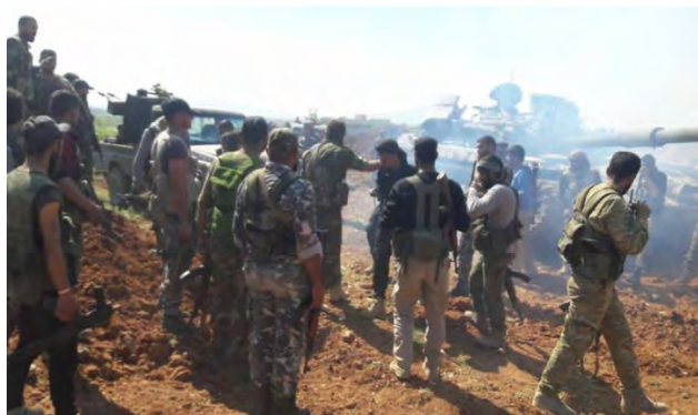
Прибытие дополнительных подразделений сирийской армии в район села Аль Сафа (газета "Аль Махаор", 17 июня 2018 г.)

целью которого является окончательная ликвидация присутствия организации ИГИЛ в этом районе (телеканал "Аль Алам", 17 июня 2018 г.; сайт "Укат Аль Шаам", 16 июня 2018 г.).