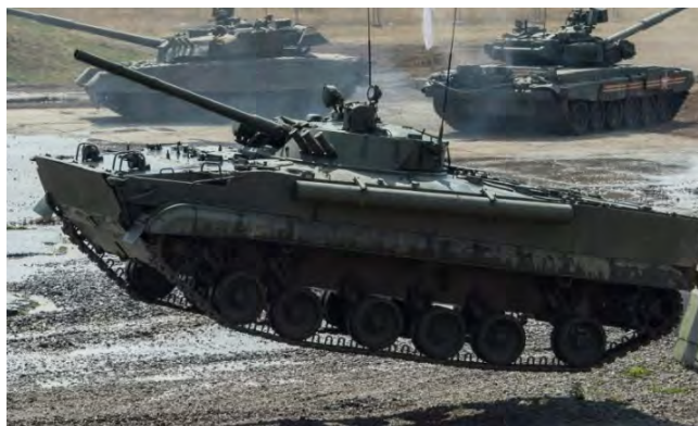
Танки сирийской армии в ожидании начала операции по захвату южной части Сирии (газета "Аль Махаор", 16 июня 2018 г.)

► В свою очередь, группировка "Свободная армия Сирии" и другие повстанческие организации также ведут приготовления к боевым действиям в районе г. Дерра. Район был разделен на подчинение нескольким оперативным центрам, и различные действующие в нем формирования получили дополнительные поставки оружия и боеприпасов (газета "Анав Балади", 18 июня 2018 г.). В сирийских органах СМИ сообщалось, что не было достигнуто значительного прогресса в политических переговорах, а также, что сирийская армия предоставит повстанческим организациям лишь небольшой период времени для принятия решения, заинтересованы ли они в достижении договоренности о примирении или в войне, хотя и создается впечатление, что "они выбрали войну" (сайт "Батулат Аль Джиш Аль Сури", 18 июня 2018 г.; газета "Анав Балади", 18 июня 2018 г.).