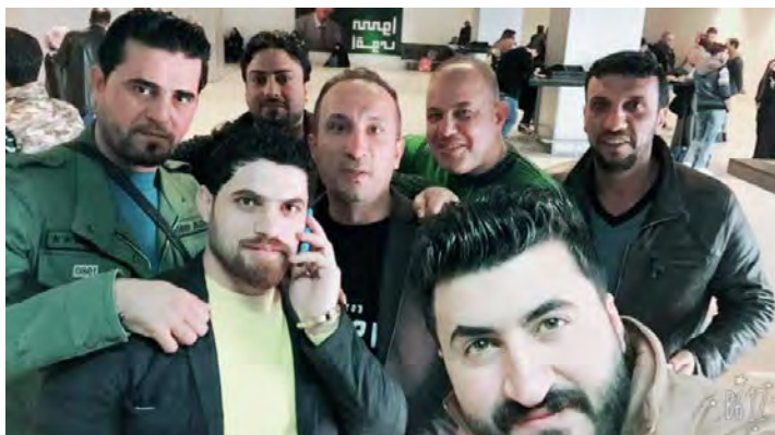
Боевики милиции "батальоны имама Али" в Сирии (страница Фейсбук милиции "батальоны имама Али", 20 января 2018 г.)

► Командование сил "народного призыва" опубликовало, 18-го июня 2018 г., "разъяснительное заявление", в котором была затронута тема действий иракских шиитских милиций на территории Сирии (официальный сайт сил "народного призыва", 18 июня 2018 г.):