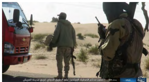
Справа: 2 боевика округа Синай организации ИГИЛ останавливают грузовик на международной трассе, которая проходит к западу от г. Аль Ариш. Слева: оружие, снаряжение и личные вещи убитых солдат египетской армии (агентство новостей "Хек", 15 июня 2018 г.)