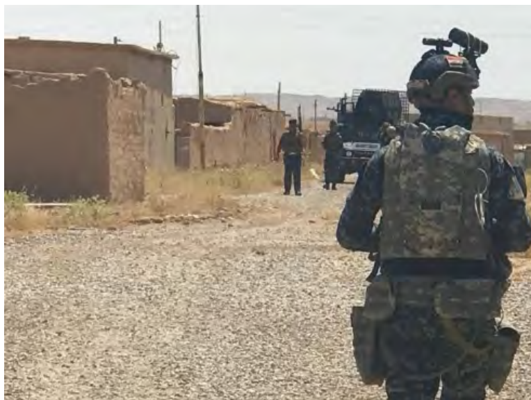
Бойцы иракских сил безопасности в округе Аль Давас, расположенном к северо-западу от г. Киркук (газета "Вакалат Куль Аль Ирак", 11 июня 2018 г.)