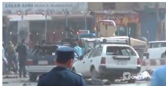
Справа: служащие афганских сил безопасности поблизости от места совершения самоубийственного теракта организации ИГИЛ в г. Джелалабад. Слева: некоторые из тел погибших лежат на земле на месте совершения теракта (аккаунт Твиттер TVNewsAF@1TVNewsAF1, 17 июня 2018 г.)