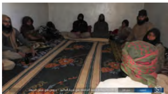
Справа: боевики организации ИГИЛ, среди которых есть и подростки, в ходе урока на тему "достоинств джихада", в деревне Аль Багуз Аль Фукани, расположенной неподалеку от г. Аль Абу Кемаль. Слева: боевики организации ИГИЛ роют окопы в деревне (агентство новостей "Хек", 2 июня 2018 г.)