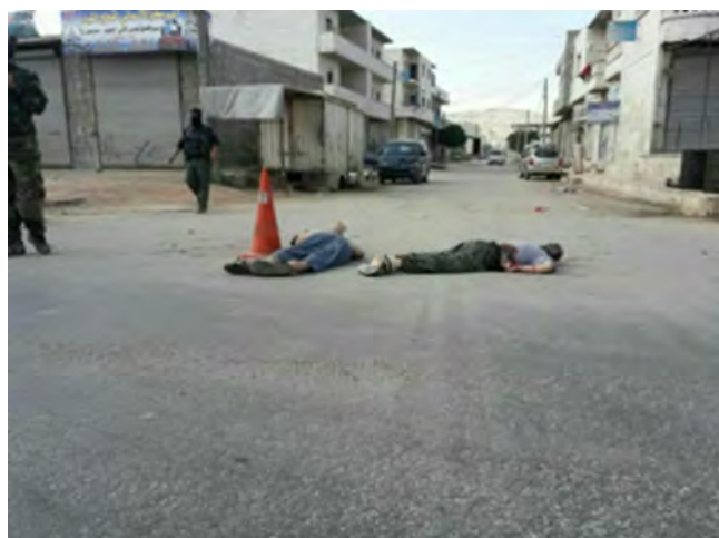
Тела 2 боевиков организации ИГИЛ, брошенные на улице после их казни боевиками группировки "Штаб по освобождению Аль Шаам" в г. Аль Дана, расположенном к северу от г. Идлиб (агентство новостей "Хек", 1 июня 2018 г.)

► 2 боевика организации ИГИЛ были захвачены при установке взрывных устройств поблизости от городского банка крови в г. Аль Дана, расположенного приблизительно в 32 км к северу от г. Идлиб. Оба террориста были казнены боевиками группировки "Штаб по освобождению Аль Шаам", доминирующей джихадистской организации в районе г. Идлиб (агентство новостей "Спутник", 1 июня 2018 г.).