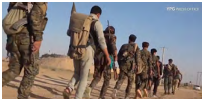
Колонна бойцов группировки SDF выдвигается для атаки на объекты организации ИГИЛ, расположенные в районе села Аль Дашиша (YPG PRESS OFFICE, 4 июня 2018 г.)