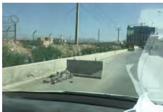
Справа: тело одного из боевиков организации ИГИЛ, принимавшего участие в попытке нападения на комплекс афганского министерства внутренних дел в Кабуле, лежит возле бетонного ограждения. На заднем плане, судя по всему – одно из зданий комплекса министерства внутренних дел. Слева: тело боевика организации ИГИЛ, возле которого лежат автоматические винтовки и разгрузочные жилеты