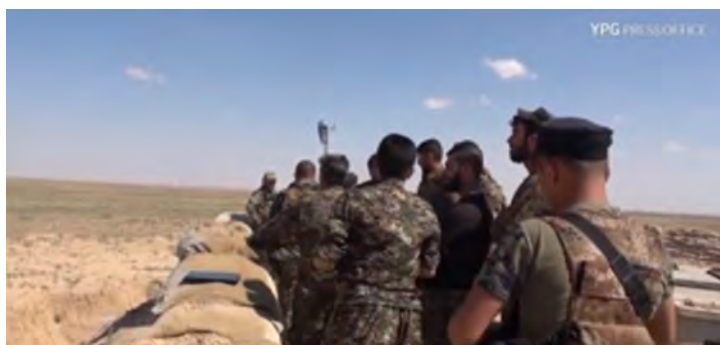
Бойцы группировки SDF на боевых позициях в районе села Аль Дашиша (YPG PRESS OFFICE, 4 июня 2018 г.)

► 3-го июня 2018 г. поступило сообщение о том, что происходят столкновения между боевиками организации ИГИЛ и силами группировки SDF, в районе села Аль Дашиша. Сообщалось, что в ходе боев был произведен обстрел ракетными снарядами с американской военной базы, которая расположена в деревне Аль Шдади (приблизительно в 30 км к северу от села Аль Дашиша), в направлении объектов организации ИГИЛ, находящихся в 3 деревнях, расположенных к юго-востоку от г. Аль Хаска (газета "Прат пост", 3 июня 2018 г.).