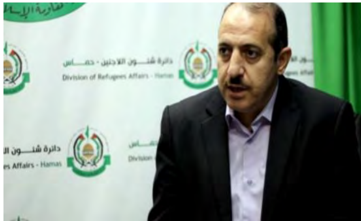
ד"ר עצאם עדואן, ראש המחלקה לענייני פליטים בחמאס.

להערכתנו במהלך 2017 נבחנו בחמאס חלופות למדיניות הקיימת כלפי ישראל. אין בידינו מידע קונקרטי על כך באשר תהליך המחשב האסטרטגי בתוך חמאס לא נעשה בפומבי . אולם מאמר שפרסם ד"ר עצאם עדואן , ראש המחלקה לענייני פליטים בחמאס, פעיל בעל שיעור קומה מדרג הביניים 3 , עשוי לפתוח צוהר לכיווני חשיבה, שרווחו בחמאס באותה עת . המאמר, התפרסם ב-7 ביוני 2017 תחת הכותרת "העימות המבוקר" והוא ניתח בהרחבה את יתרונותיו של תסריט לפיו תזום חמאס "עימות מבוקר" נגד ישראל כמענה ל"הגברת המצור" על רצועת עזה . 4 אנו סבורים כי בתפיסת "העימות מבוקר" שעליה כתב עצאם עדואן ניתן למצוא קווי דמיון למדיניות האלימות המבוקרת שבה נוקטת כיום חמאס ולפיכך ראוי לבחון בקצרה את ההיגיון שהנחה את ד"ר עצאם עדואן.