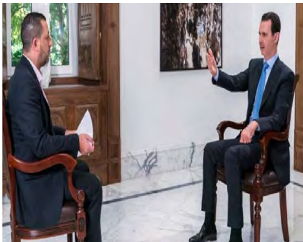
הנשיא אסד בריאיון לאלעאלם (אלעאלם, 13 ביוני 2018).

האיראנית בסוריה מוגבלת ליועצים מתנדבים בלבד הפועלים בפיקוד איראני וכי אין יחידות צבאיות איראניות או בסיסים צבאיים איראנים בשטח סוריה. הוא הוסיף, עם זאת, כי דמשק תסכים להקמת בסיסים צבאיים איראנים בסוריה אם יהיה בכך צורך. עוד אמר אסד, כי תכנן להגיע לביקור לאיראן לפני מספר חודשים, אך הביקור נדחה בשל המצב בסוריה והוא מקווה לקיימו בקרוב.