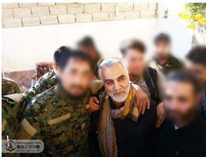
סלימאני לצד לוחמי חטיבת פאטמיון (טלגרם, 10 ביוני 2018).

◀ לא ברור היכן השמיע סלימאני את דבריו, אך ייתכן כי הדברים נאמרו במסגרת ביקור שקיים מפקד כוח קדס בסוריה וייתכן שגם בלבנון. ב-10 ביוני 2018 פרסם ערוץ הטלגרם של חטיבת פאטמיון האפגאנית המשתתפת בקרבות נגד דאעש במזרח סוריה תמונה עדכנית של סלימאני כשהוא מתועד עם לוחמי החטיבה בסוריה. יצוין, כי באופן חריג נעדר סלימאני מתהלוכות "יום ירושלים העולמי", שהתקיימו ב-8 ביוני 2018 ברחבי איראן.