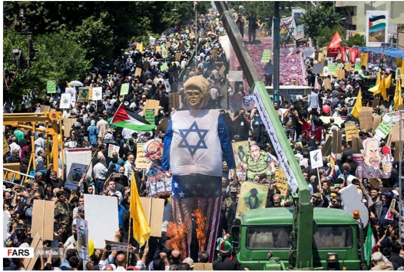
תהלוכות יום ירושלים בטהראן (פארס, 8 ביוני 2018)