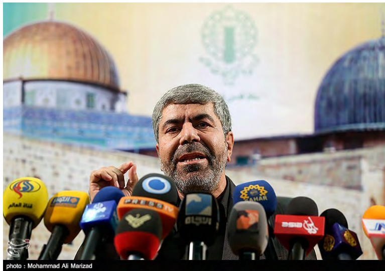
רמזאן שריף (תסנים, 1 ביוני 2018)

◀ רמזאן שריף (Ramazan Sharif), דובר משמרות המהפכה, הצהיר בנאום שקדם לתפילת יום השישי בטהראן, כי לראשונה מאז "כינון המשטר הציוני", ספגה ישראל מכה קשה מצד "חזית ההתנגדות" במתקפת הרקטות ברמת הגולן בחודש מאי וכי זוהי ראשיתה של "דרך גדולה". עוד אמר שריף, המשמש כמזכיר "מטה האנתיפאדה וירושלים" ב"מועצה המתאמת של ההסברה האסלאמית", כי "תהלוכות השיבה" בעזה מוכיחות, שבני הדור השלישי והרביעי של הלוחמים הפלסטינים מוכנים לשוב למולדתם בדומה לבני הדור הראשון של הלוחמים. שריף גינה את העברת שגרירות ארה"ב לירושלים וכינה אותה "צעד התאבדתי ומטורף" מצד הנשיא טראמפ (תסנים, 1 ביוני 2018).