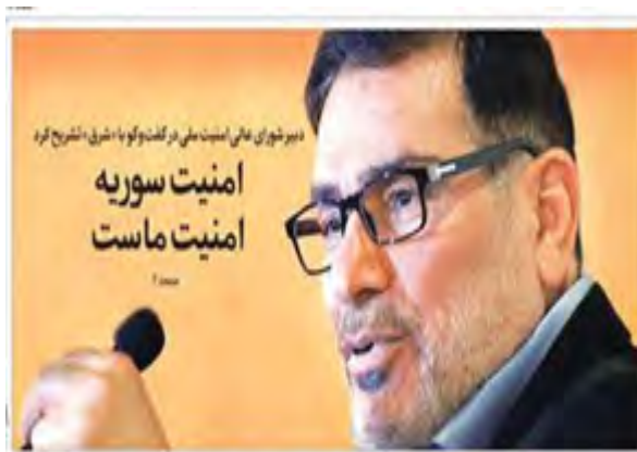
"ביטחון סוריה הוא הביטחון שלנו", מזכיר המועצה העליונה לביטחון לאומי, עלי שמח'אני (שרק, 2 ביוני 2018)

◀ שמח'אני ציין, כי לאיראן אין עמדה בנוגע להרכב הממשלה החדשה בעיראק וכי היא תתמוך בכל החלטה, שתתקבל בעניין זה על-ידי הבכירים העיראקים. איראן הוכיחה את תמיכתה בעם העיראקי במאבקו נגד צדאם חוסיין ונגד הטרוריסטים בארבעת העשורים האחרונים והיא תמשיך בתמיכתה בעיראק גם בעתיד.